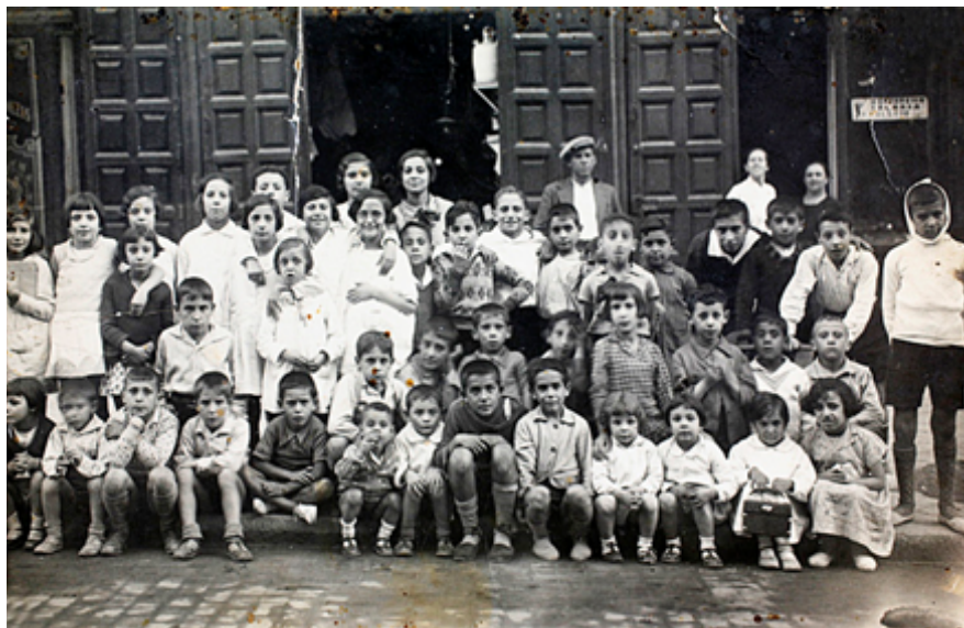
1930. Foto en la puerta del colegio. Colección 'Madrileños'.