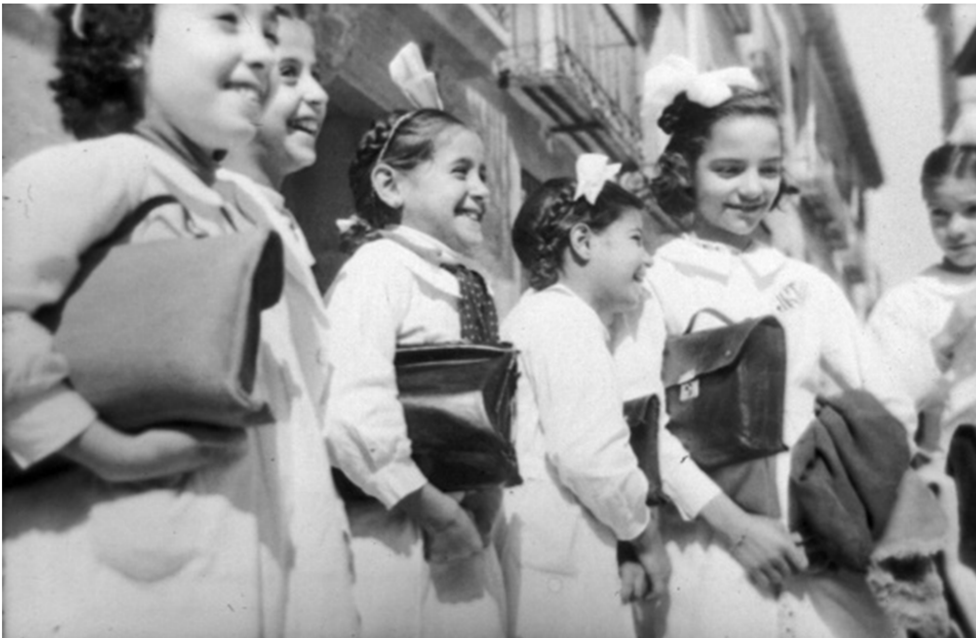
1940. Un grupo de amigas sonríen muy contentas el primer día de curso.