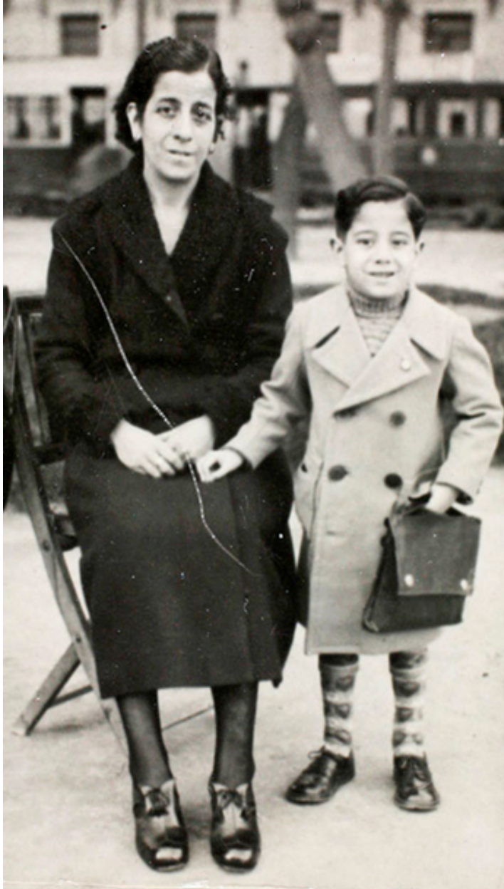
1940. Posando con mamá a la salida de clase.