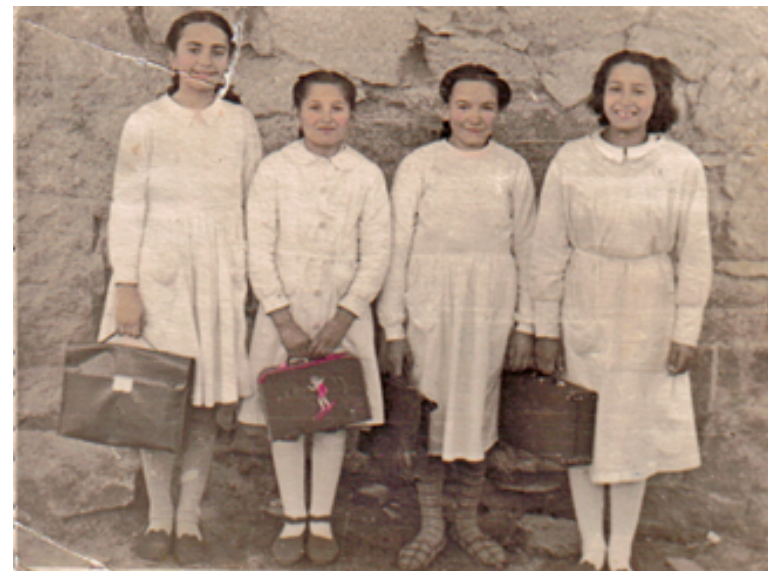
1950. Cuatro niñas con el uniforme del colegio.