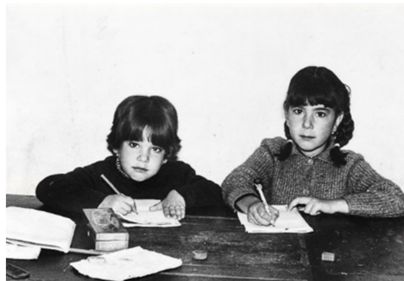
1964. Dos hermanos inician el curso en un colegio de Alcorcón.