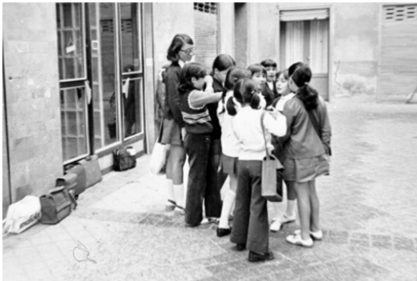
1957. Compañeras del colegio Santa Isabel en la calle Hortaleza.