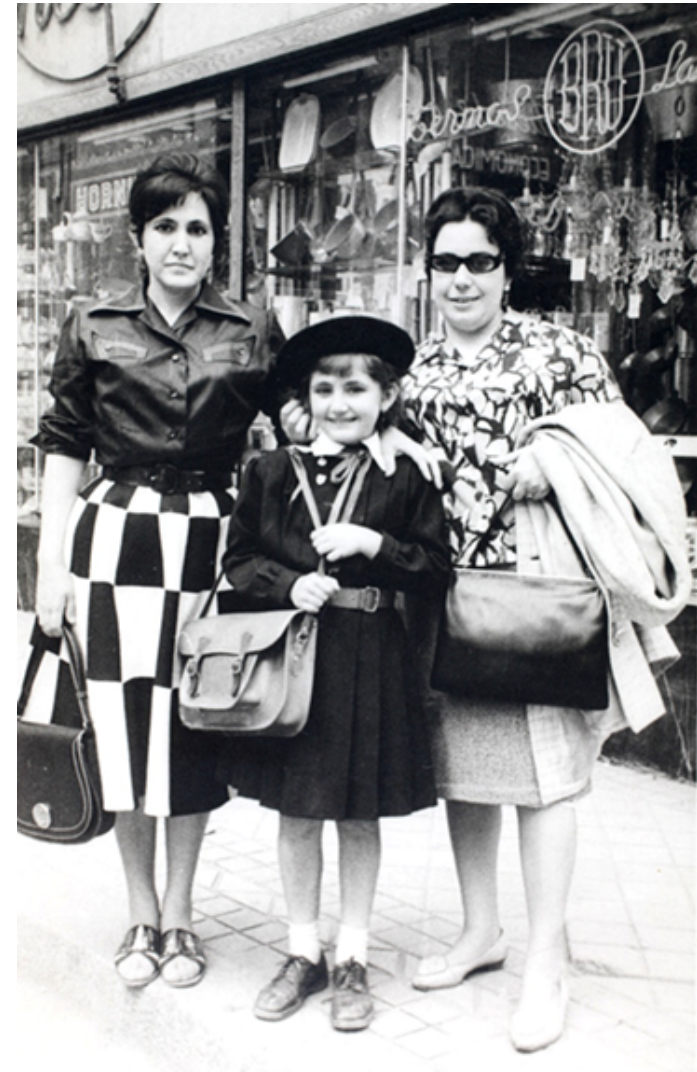
1960. Con mi madre y su amiga a la salida del cole.