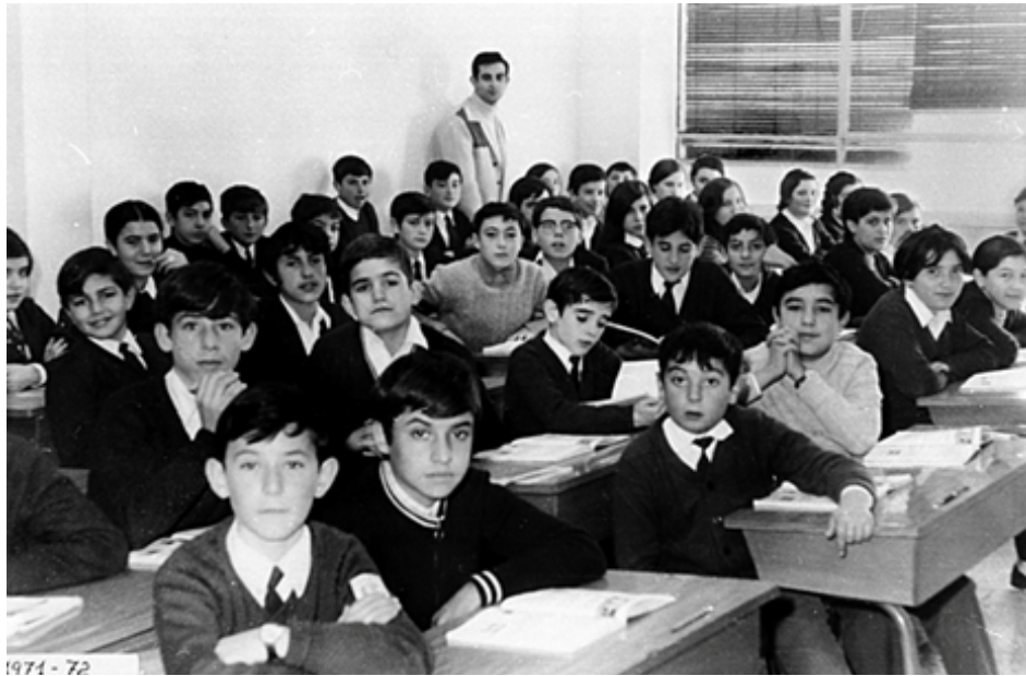
1974 - 72 1972. Alumnos del colegio Jaby (Torrejón de Ardoz) en el aula. Colección 'Madrileños'.