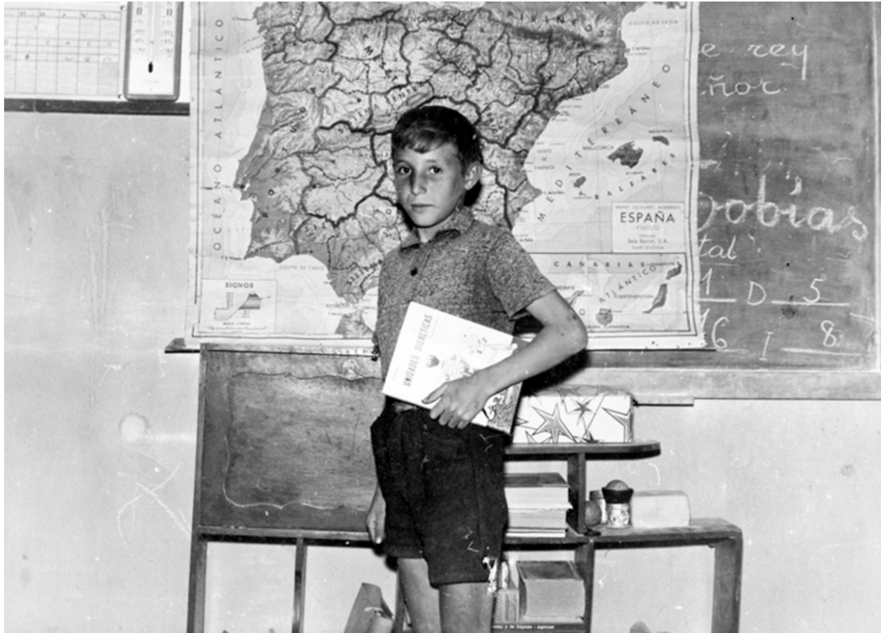
1960. Un niño en el colegio con el mapa de España detrás.