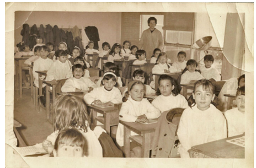
1966. Alumnas del colegio Manuel Sainz de Vicuña (Moratalaz) en clase.