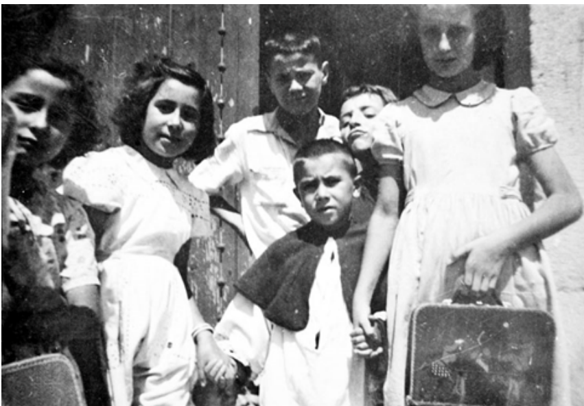
1950. Con los maletines nuevos el primer día de curso en un colegio de Cabanillas de la Sierra. Colección 'Madrileños'.