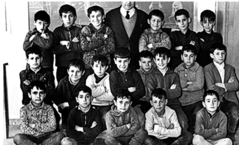
1960. Alumnos del colegio Carlos I de Torrejón de Ardoz posando con su maestro.