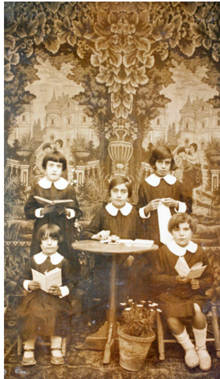
1935. Retrato de cinco compañeras de clase en un colegio de Alcalá de Henares. Colección 'Madrileños'.