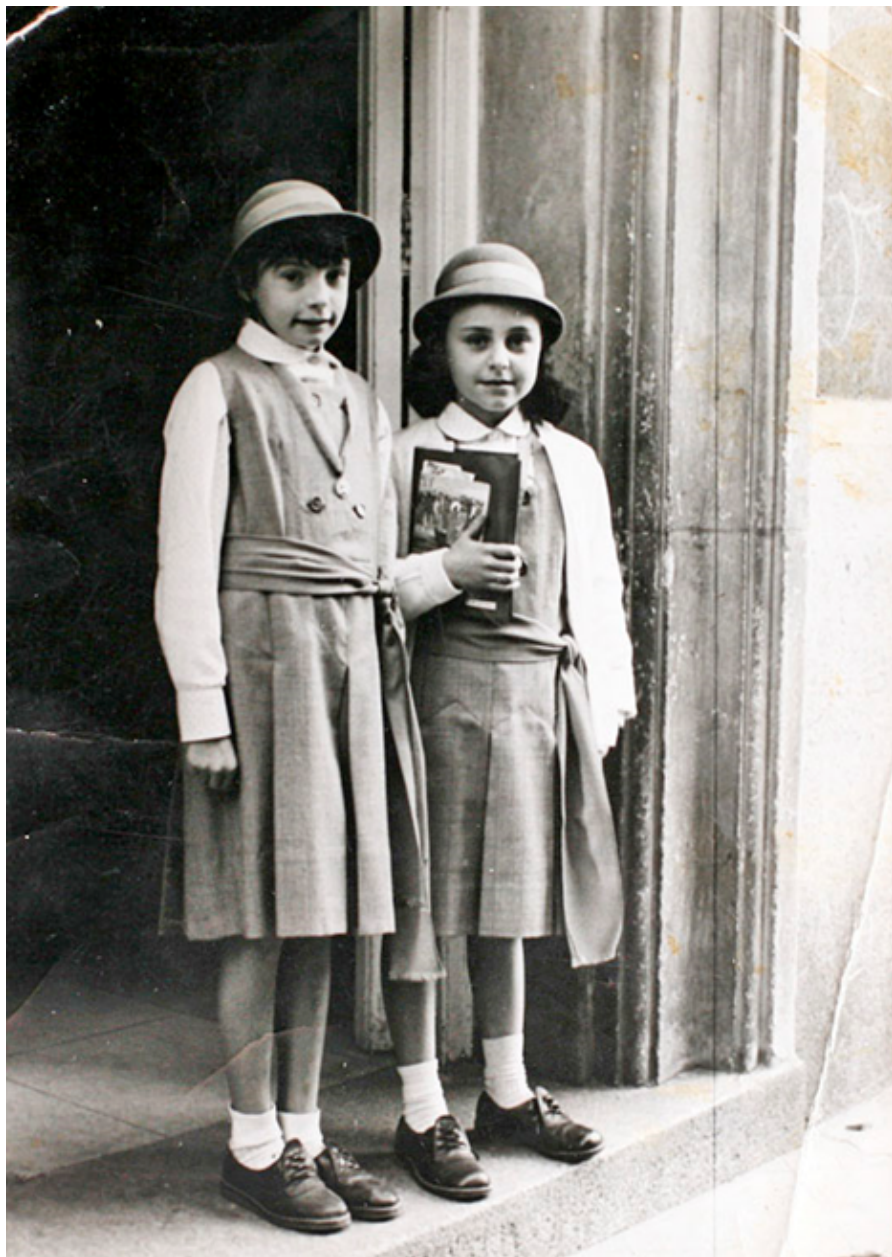
1964. Niñas en el colegio de las Concepcionistas, en la calle Princesa.