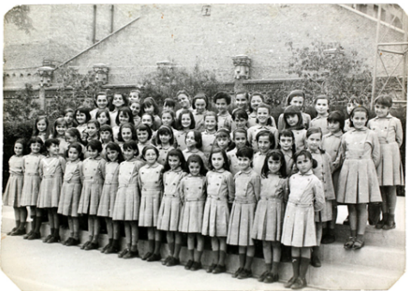
1964. Foto de grupo de una clase del colegio de las Salesianas.