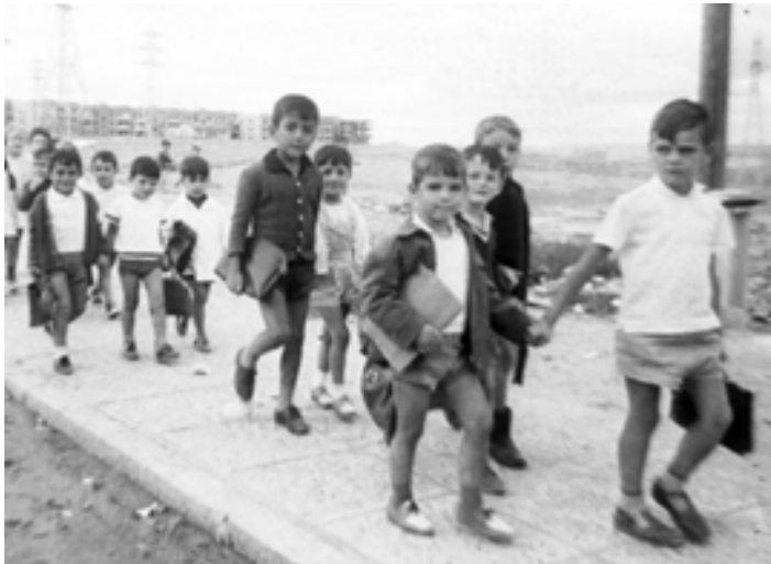
1963. Juntos al cole el primer día de clase.