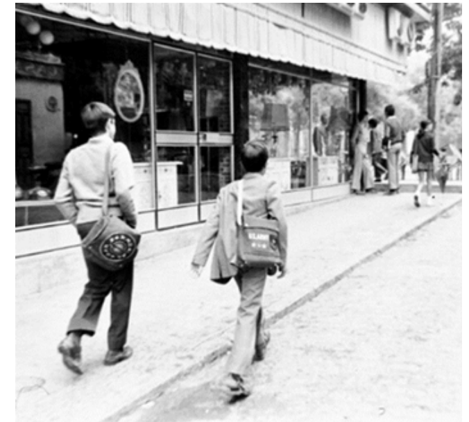
1972. Reportaje. Grupos de niños camino del colegio por diferentes calles del centro de Madrid.