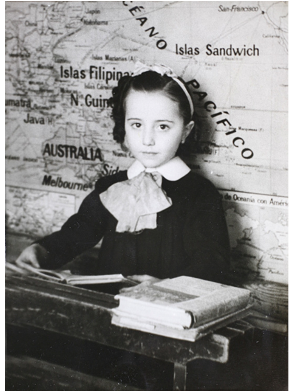
1941. Retrato en un colegio del centro de Madrid con el mapamundi.