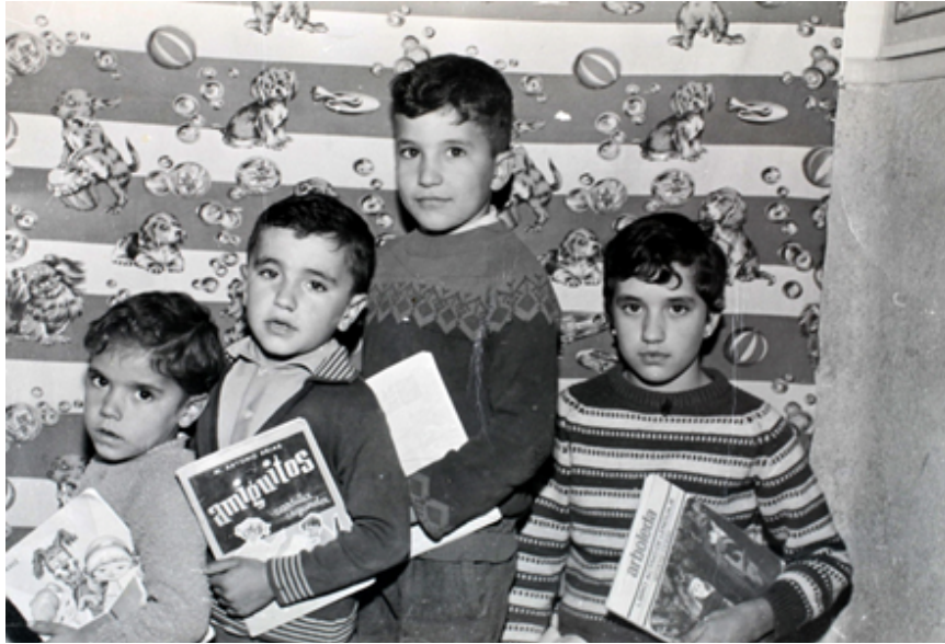
1970. Cuatro hermanos posan con sus libros. Colección 'Madrileños'.