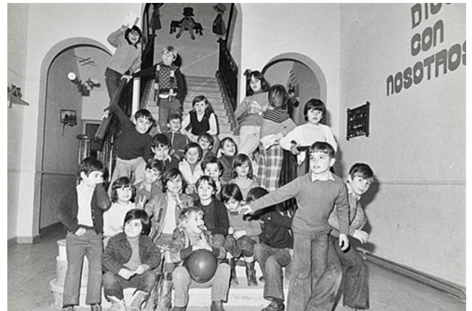
1976. Comienzo de curso en un colegio de Alcalá de Henares para hijos de emigrantes.