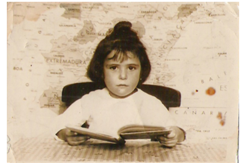
1957. Posando delante del mapa de España en un colegio de Ciudad Lineal. Colección 'Madrileños'.