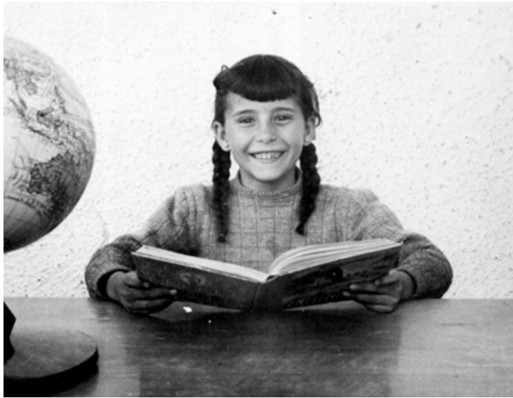
1960. Posando divertida en un aula del colegio de Los Molinos.