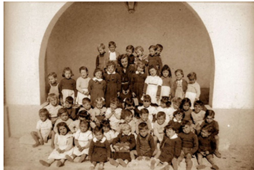
1940. Niños posando en el patio de un colegio en Mejorada del Campo. Colección 'Madrileños'.