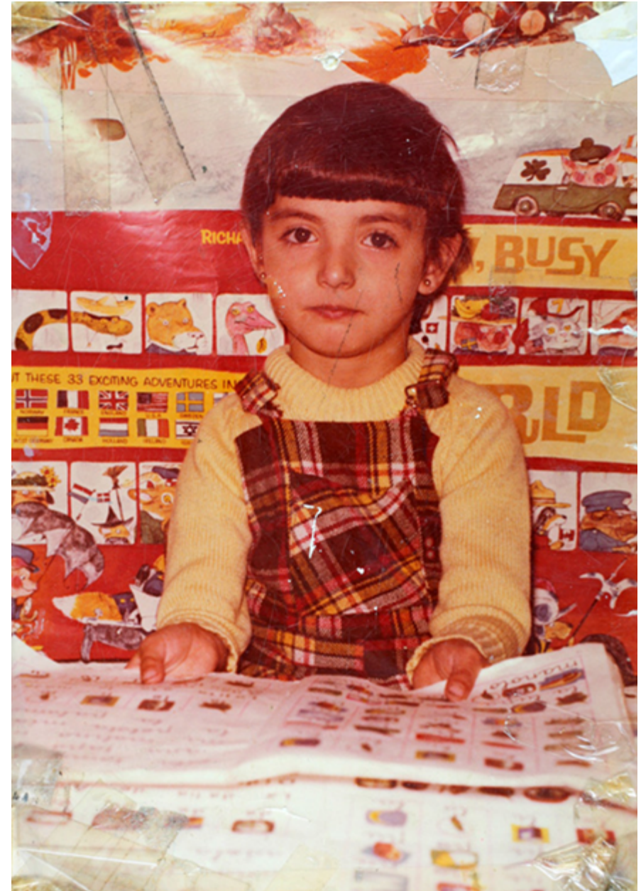
1974. Una niña en su primer día de colegio. Colección 'Madrileños'.