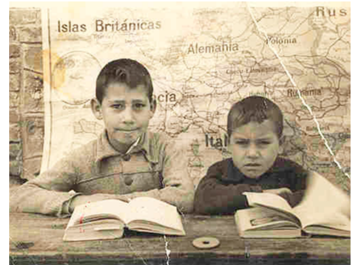
1943. Retrato de dos niños posando en un colegio de Vallecas con el mapa de Europa a la espalda. Colección 'Madrileños'.