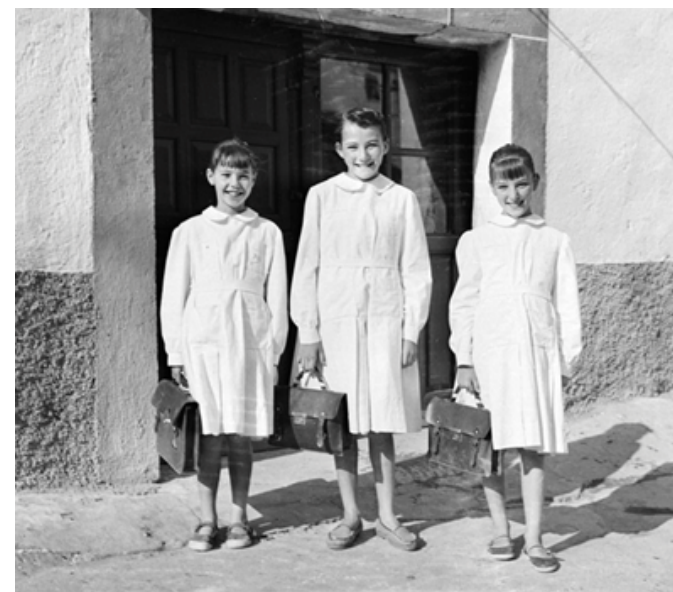
1956. Tres niñas de Lozoyuela preparadas para ir al colegio.