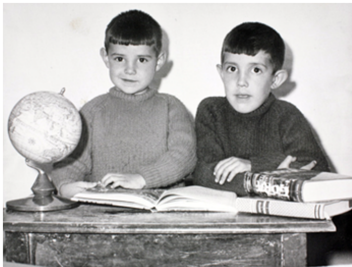
1965. Dos niños posan en su clase del colegio público del barrio de Begoña. Colección 'Madrileños'.