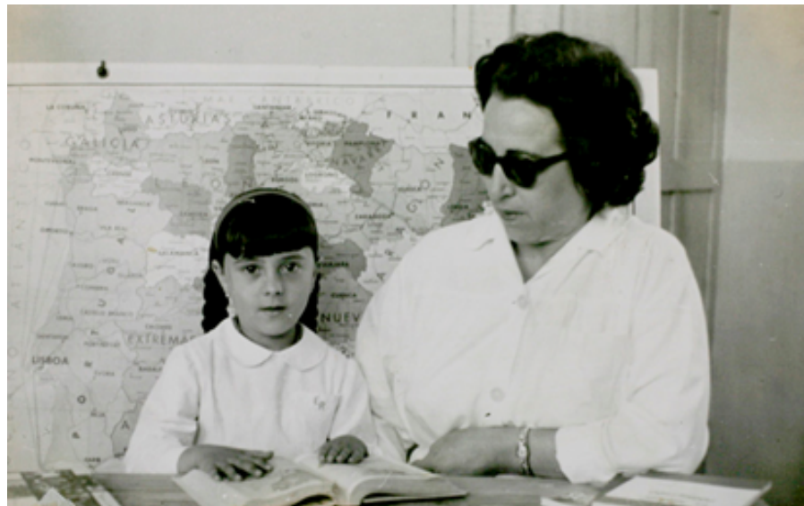
1963. Una niña y su profesora estudiando en un pupitre delante del mapa de España.