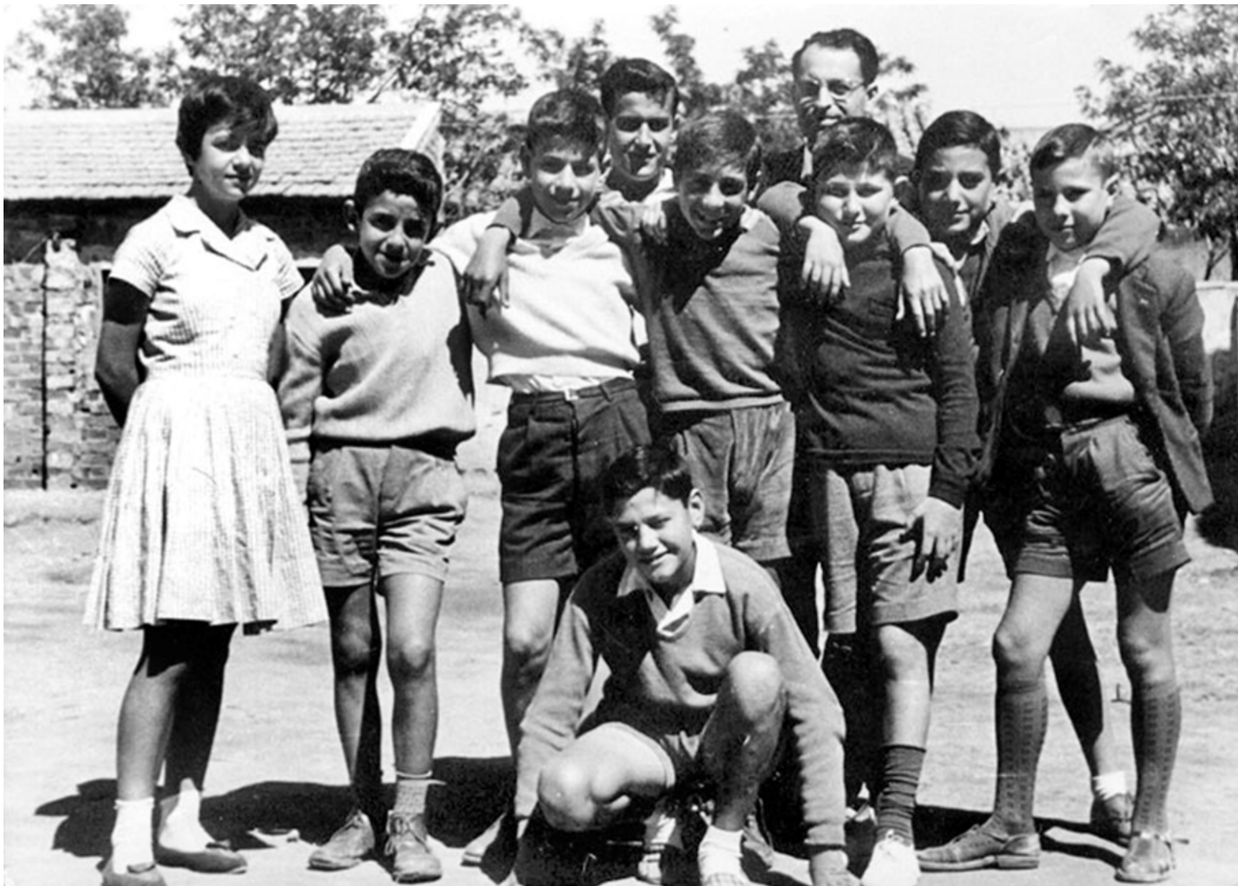
1960. Alumnos del colegio Fábregas de Torrejón de Ardoz.