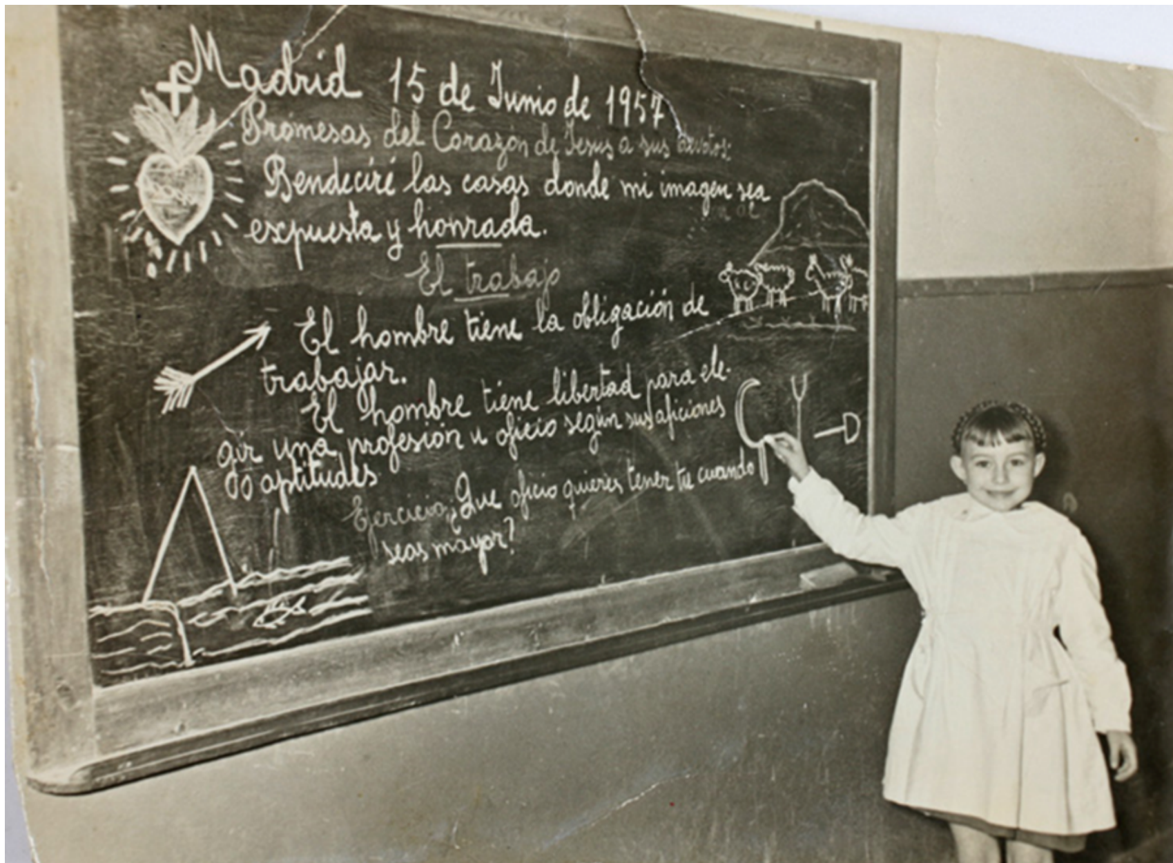
1957. Retrato de una niña escribiendo en la pizarra en un colegio de Usera.