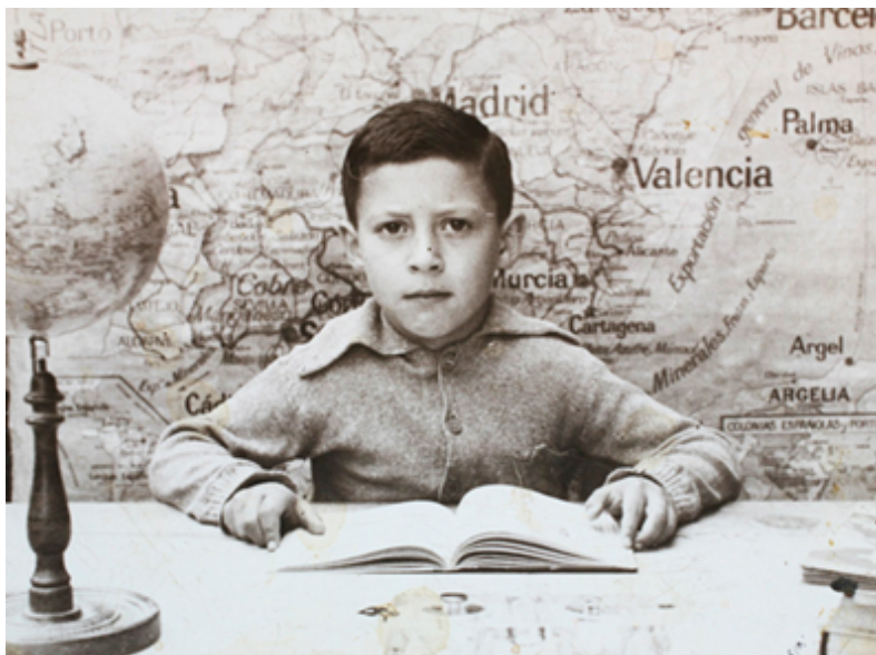
1945. Con el mapa de España, la bola del mundo y el libro de lectura. Colección 'Madrileños'.