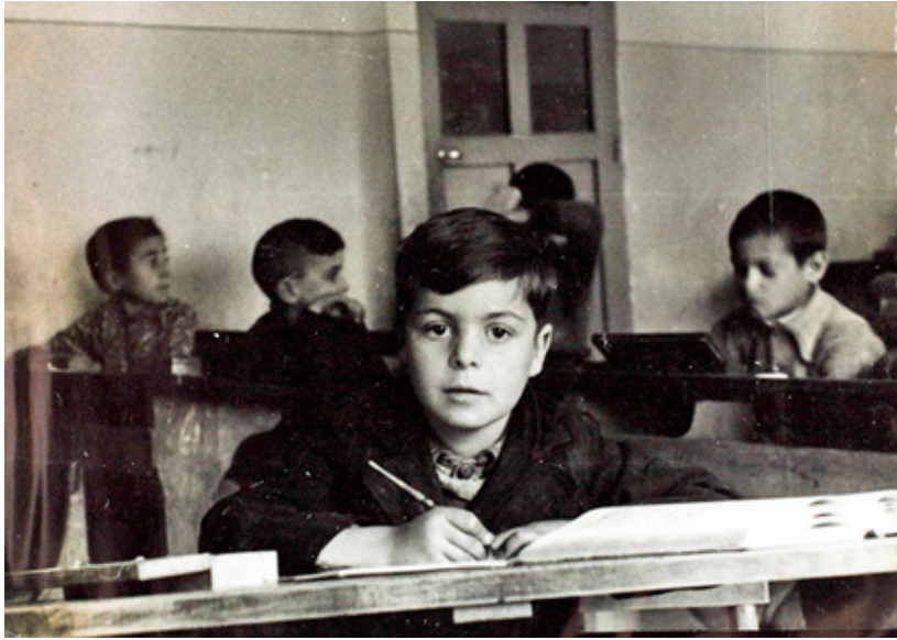
1946. Niños estudiando en el colegio Sanz Raso de Vallecas.