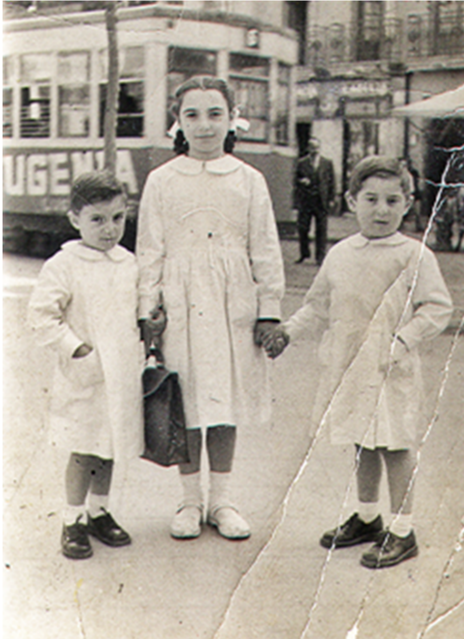
1951. Una niña y sus hermanos camino del colegio cerca de la calle Reina Victoria.