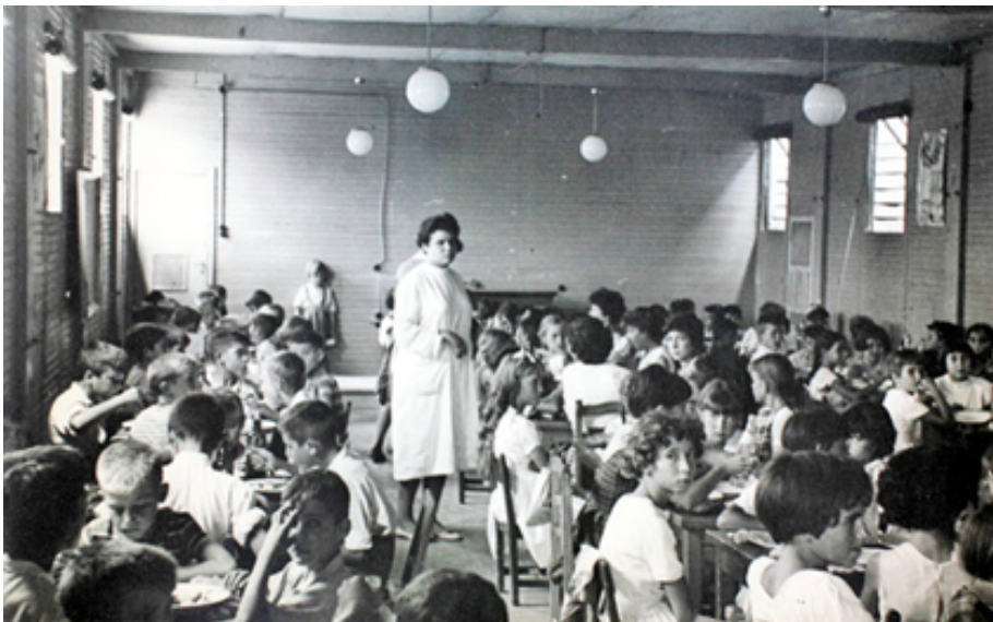
1960. El comedor de un colegio en El Pozo del Tío Raimundo.