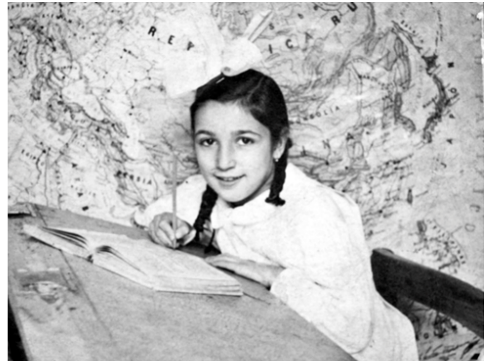
1944. Retrato en clase. Colección 'Madrileños'.