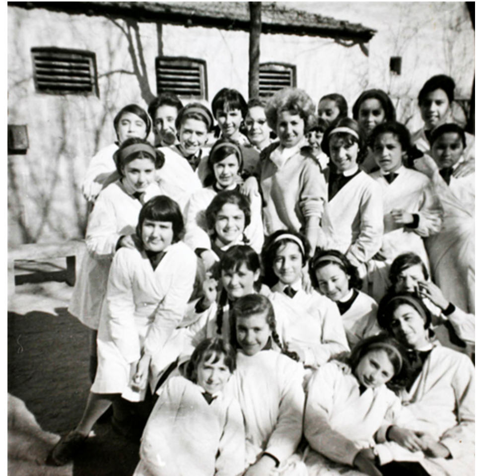
1957. Un grupo de compañeras del colegio Santa Isabel, en la calle Hortaleza, se fotografían con su profesora. Colección 'Madrileños'.