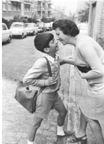
1972. Del brazo de mi madre hasta llegar al cole.