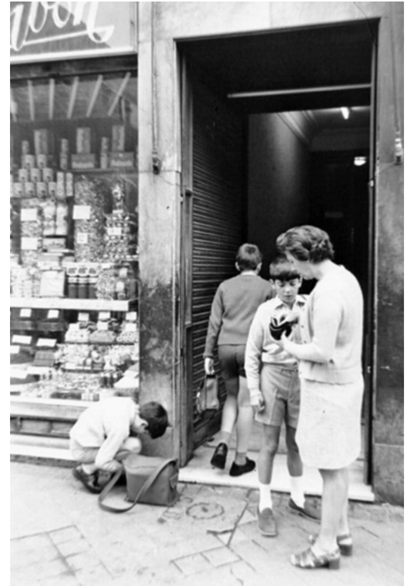
1972. Una parada camino del colegio para comprar golosinas.