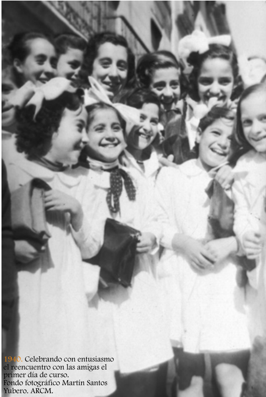
1940. Celebrando con entusiasmo el reencuentro con las amigas el primer día de curso.