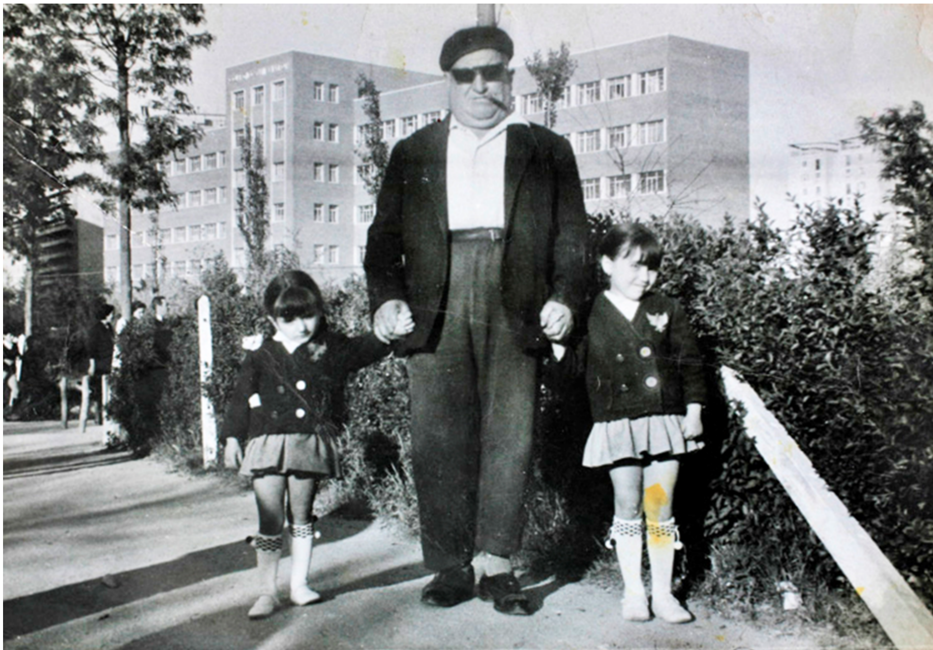
1967. Abuelo con sus nietas a la salida del colegio San Viator en la Plaza Elíptica.