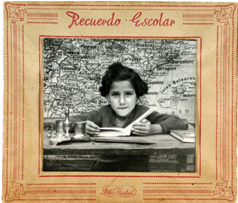
1952. Niña posando para un retrato escolar en un colegio de Vallecas.