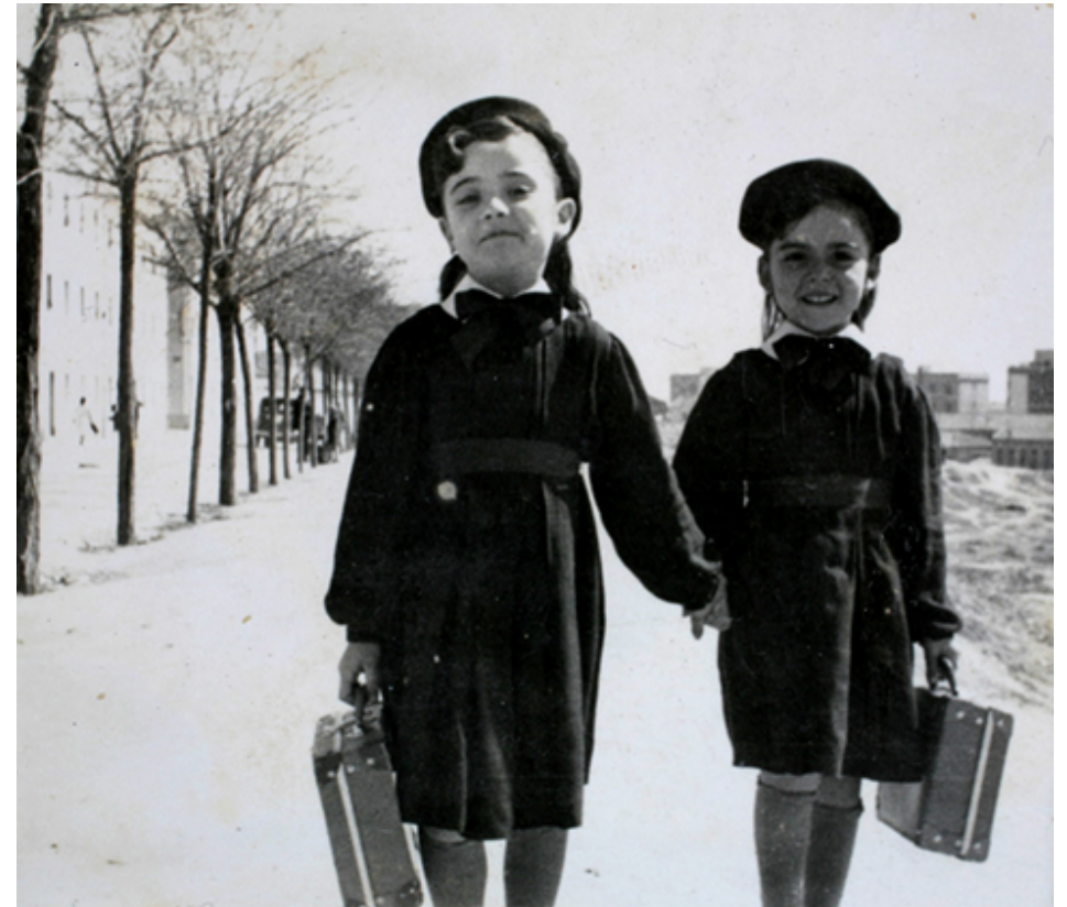
1954. Dos niñas camino del colegio con su uniforme y el maletín de la merienda. Colección 'Madrileños'.