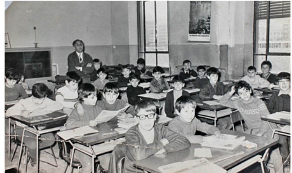
1970. Alula del colegio nacional Tirso de Molina, en el Paseo de la Ermita. Colección 'Madrileños'.