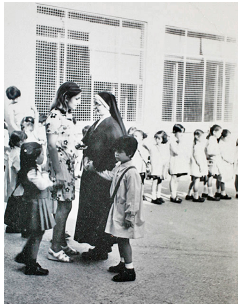
1977. Colegio de las monjas en Villaverde Alto.