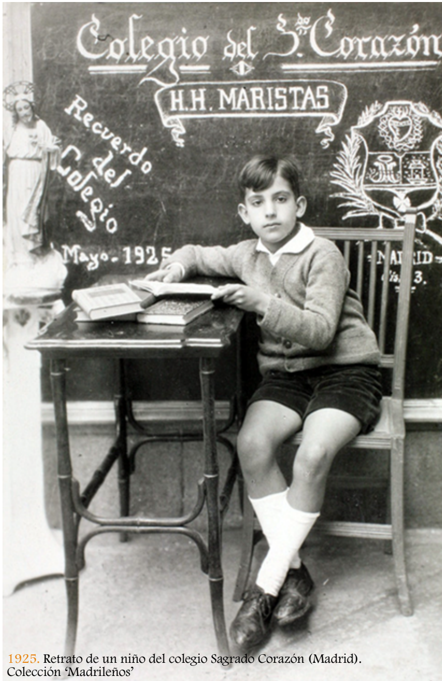
1925. Retrato de un niño del colegio Sagrado Corazón (Madrid). Colección 'Madrileños'