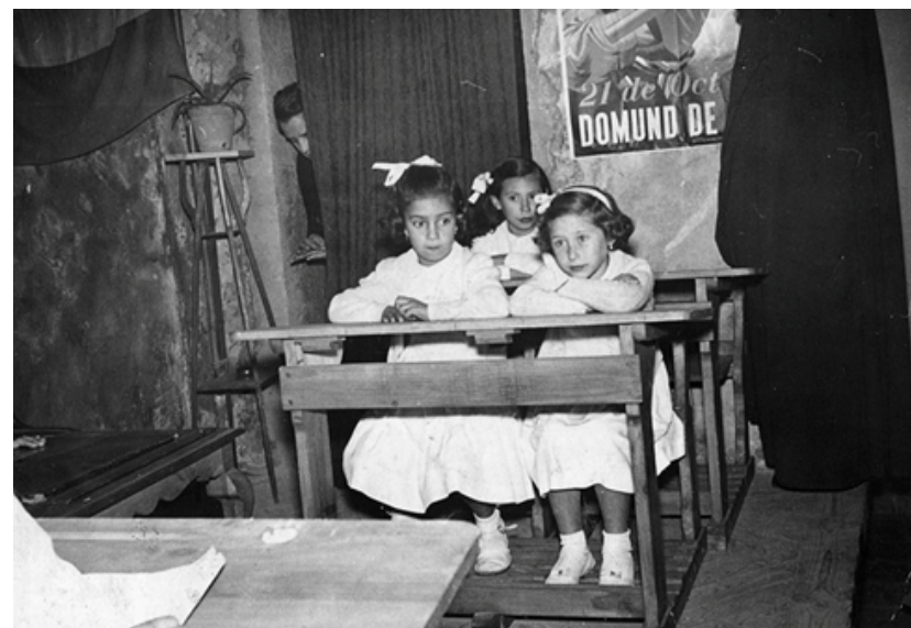
1957. Inicio de las clases en el colegio de Los Molinos. Colección 'Madrileños'.