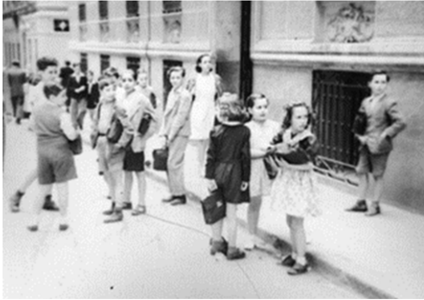
1944. Charlando con los compañeros antes de entrar al colegio.