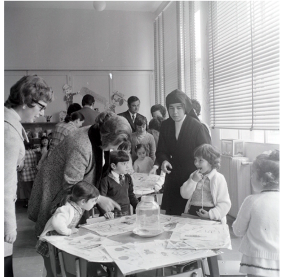
1970. Colegio de las Salesianas de Plaza de Castilla.