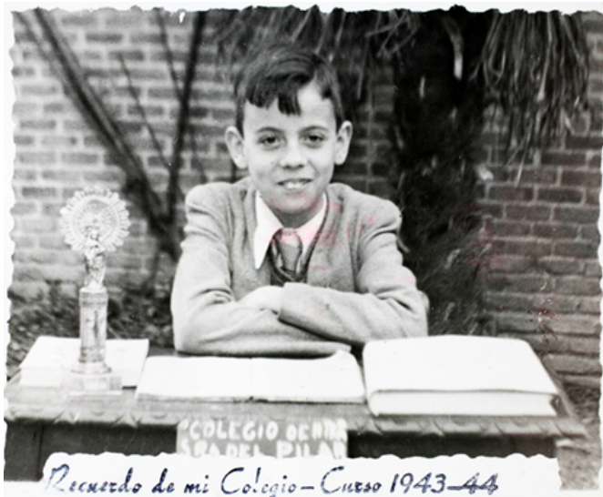
1963. Foto recordatorio del colegio Nuestra Señora del Pilar, en el barrio de Salamanca.