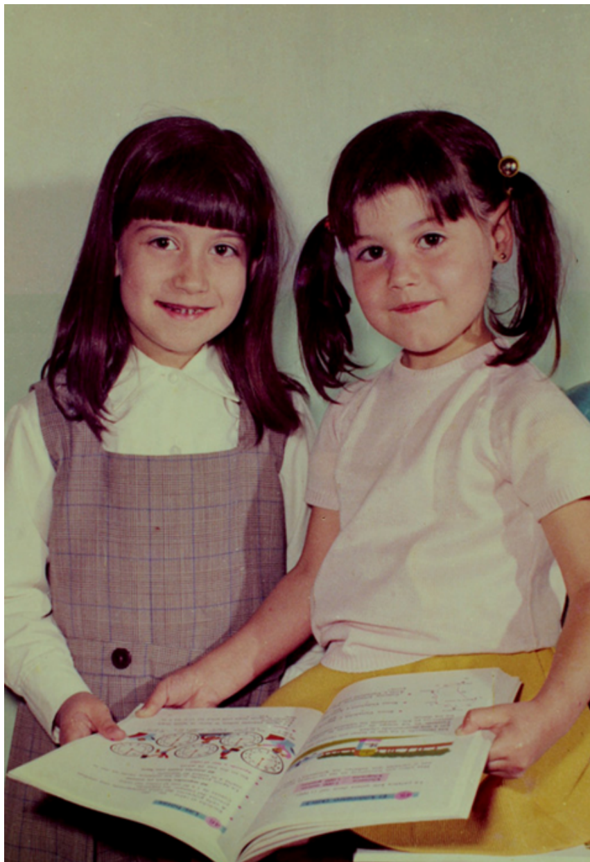
1977. Dos niñas comparten su primera cartilla en un colegio de Ciempozuelos. Colección 'Madrileños'.