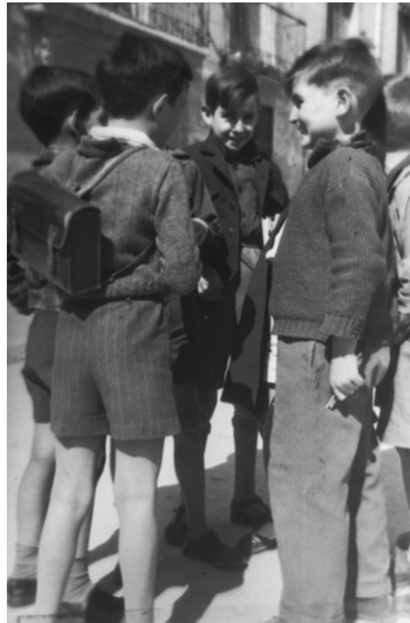
1940. Confidencias entre compañeros al terminar las clases.