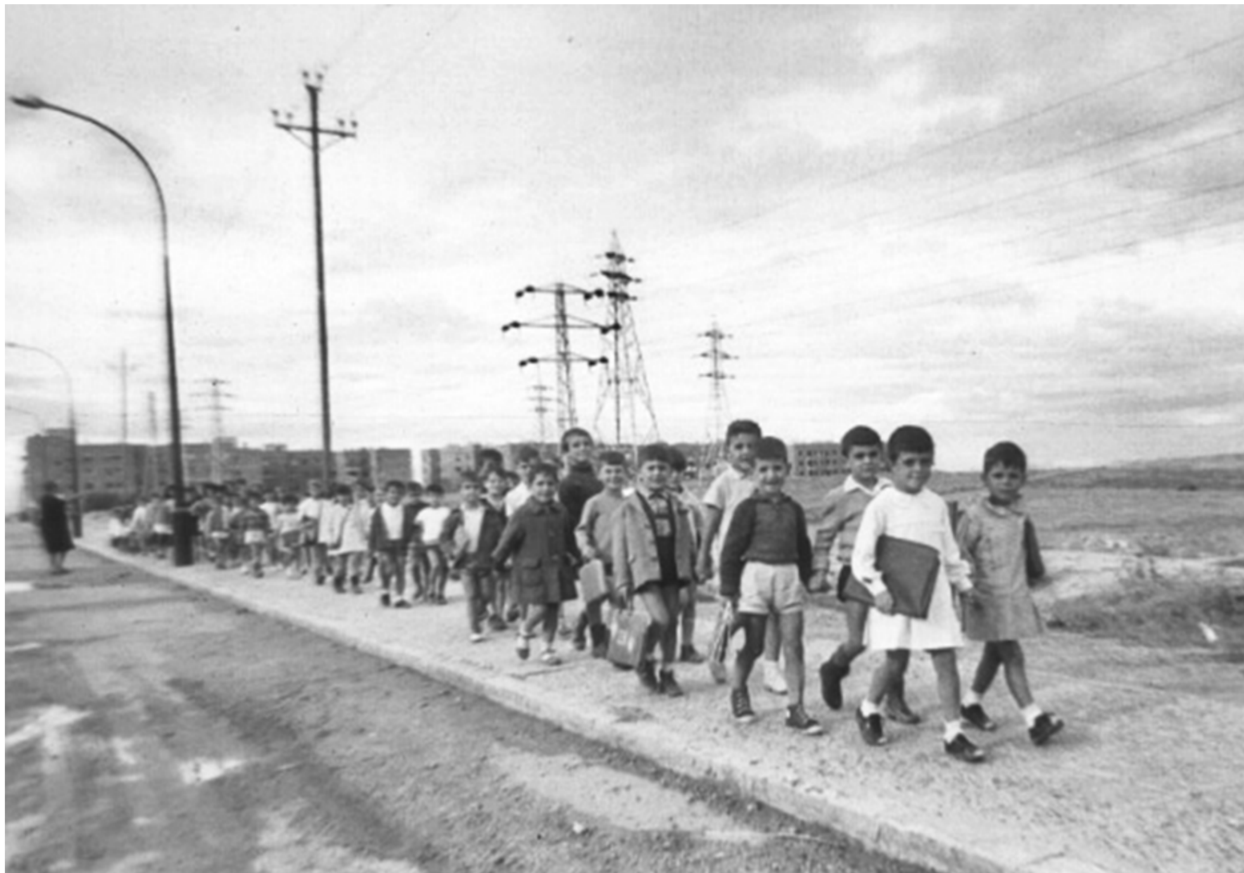
1963. Niños de un barrio en las afueras de Madrid marchan en fila hacia el colegio.