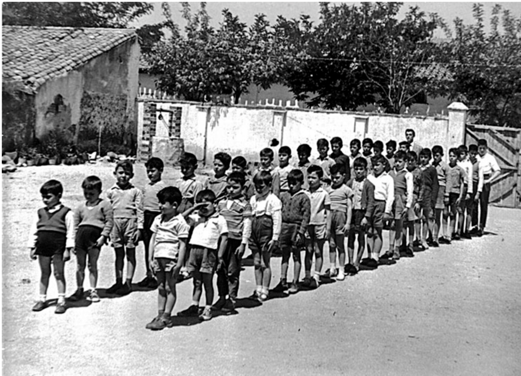
1962. Todos en fila para entrar a un colegio de Torrejón de Ardoz. Colección 'Madrileños'.