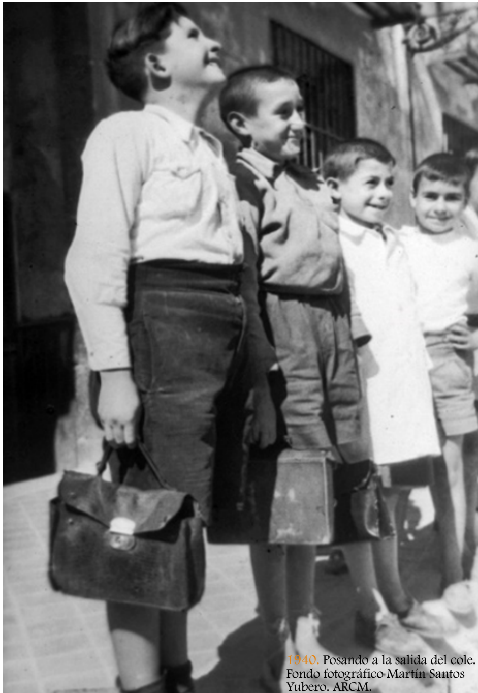
1940. Posando a la salida del cole.