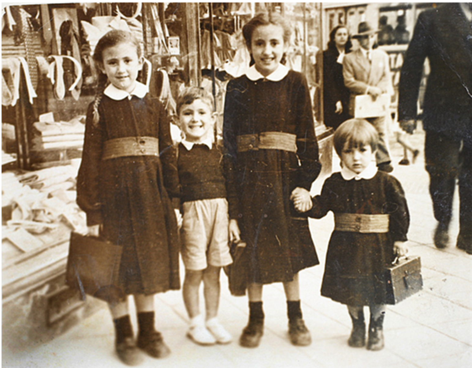
1956. Cuatro hermanos van al colegio de uniforme.