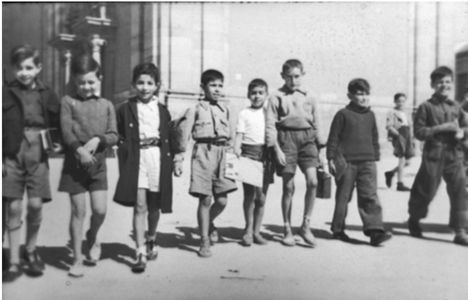
1940. Escolares a la salida de clase el primer día de curso.