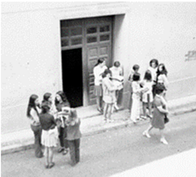
1972. Corrillos a la salida de clase.