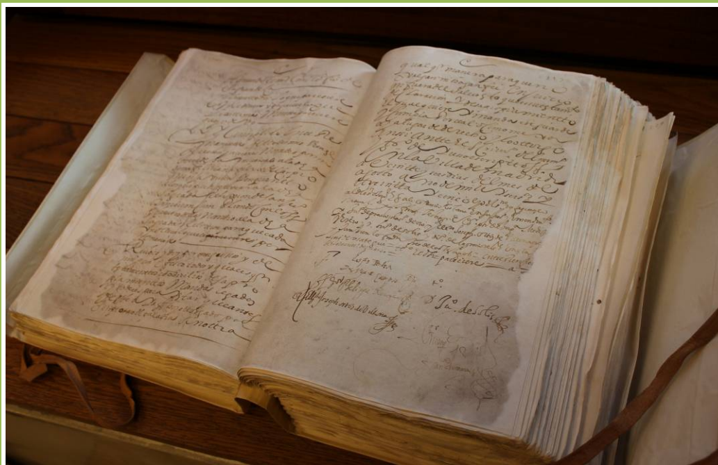
Último testamento de Lope Félix de Vega y Carpio Madrid, 26 de agosto de 1635. ARCHIVO HISTÓRICO DE PROTOCOLOS DE MADRID Tomo 6608, Folios 1.175r-1.178r.