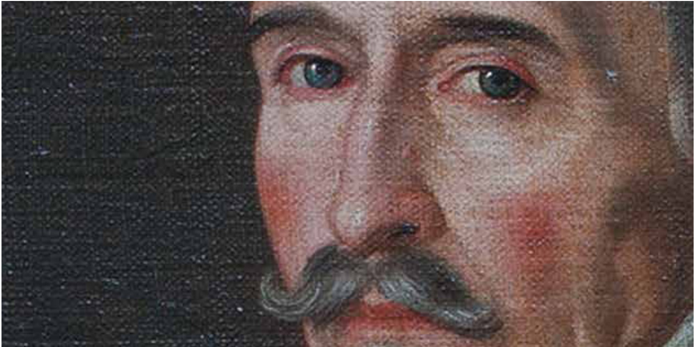
Poeta, novelista y el más grande dramaturgo español

Lope de Vega es uno de los escritores más importantes de la historia de la literatura española. De vida polémica, muchas veces alejado de las normas y la moralidad del momento, fue un amante padre y un devoto sacerdote, inquisidor y poeta. Aplaudido y admirado ya en su época –en que se le llamaba popularmente ‘Fénix de los Ingenios’–, escribió más de mil obras, vivió 73 años y protagonizó una memorable pelea con Miguel de Cervantes, responsable, sin embargo, de uno de los sobrenombres por los que el mundo entero le conoce hoy, ‘Monstruo de la Naturaleza’.