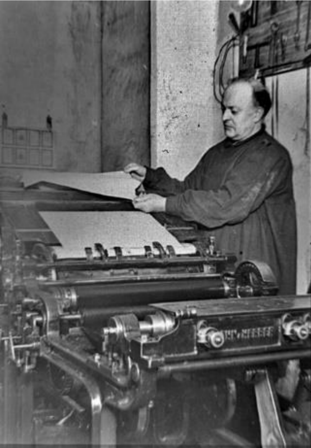
1946. IMPRESOR EN LA MÁQUINA PLANA.