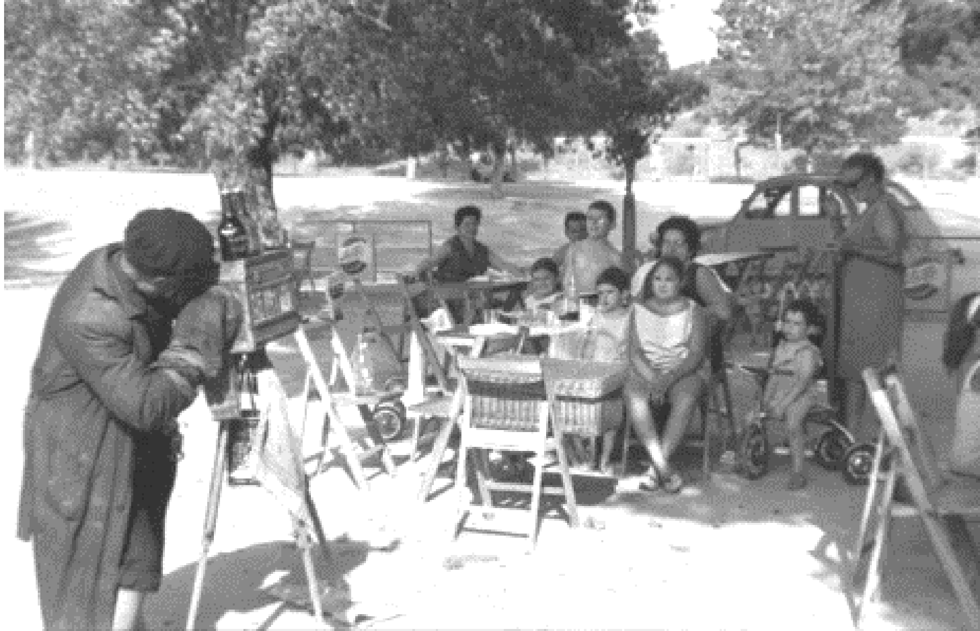
1966. FOTÓGRAFO AL MINUTO (SANTOS YUBERO) EN EL PARDO HACIENDO UN RETRATO DE GRUPO FAMILIAR.

El fotógrafo al minuto o minuterero se dedica a la producción fotográfica realizada de ocasión –en la calle o en algún lugar de interés público– con una cámara de cajón que permite el revelado en pocos minutos en el mismo lugar. Los fotógrafos minutereros solían ubicarse en sitios turísticos o atractivos, con gran afluencia de público.