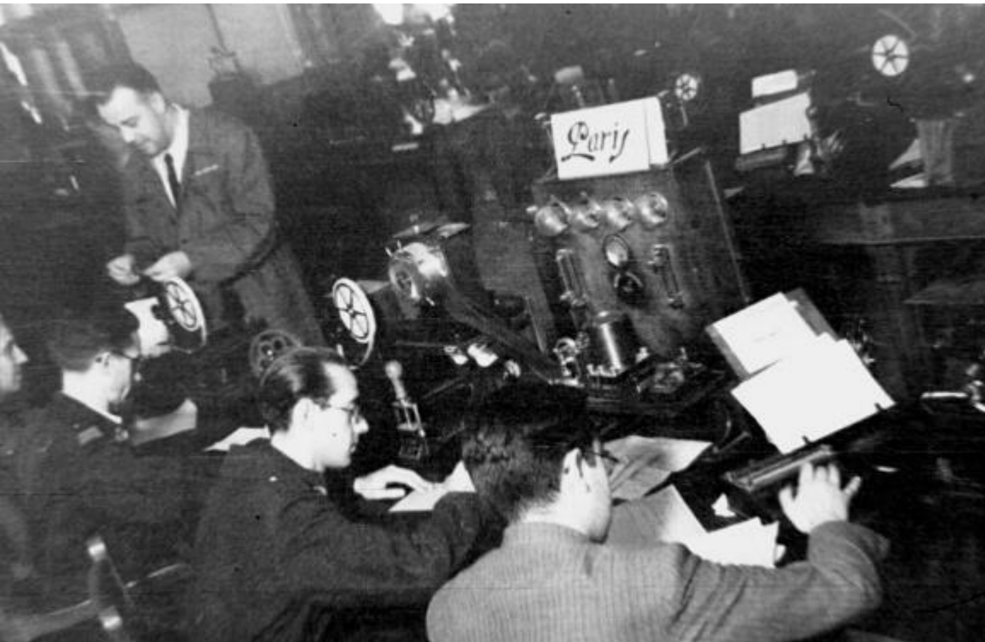
1969. TELÉGRAFOS.