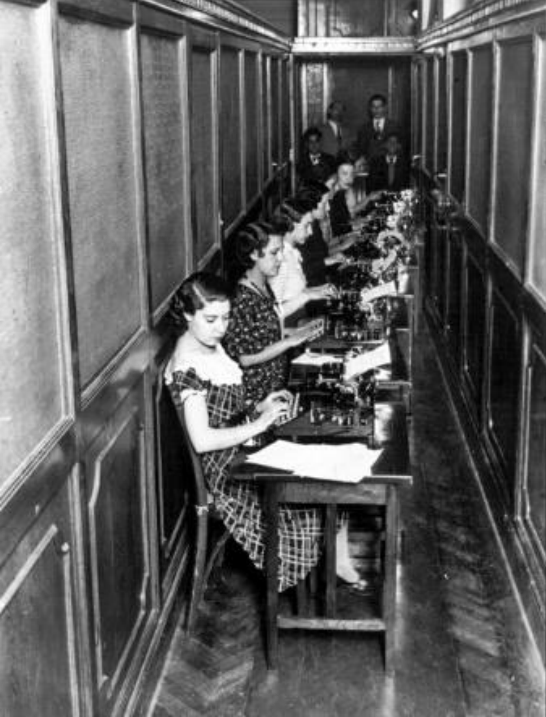
AÑOS 30. MECANÓGRAFAS. FONDO FOTOGRAFICO MARTÍN SANTOS YUBERO. ARCM.