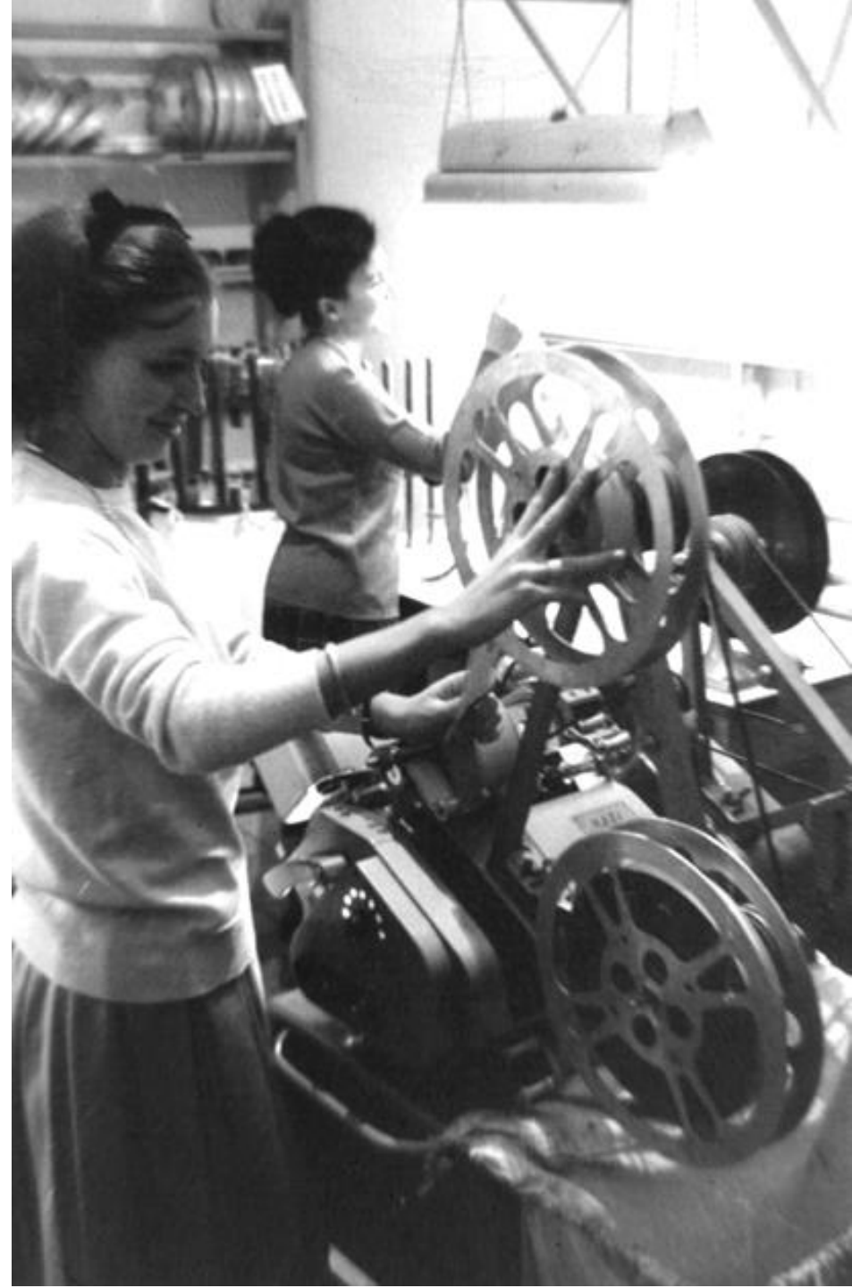
1964. MONTADORAS DE PELÍCULAS.