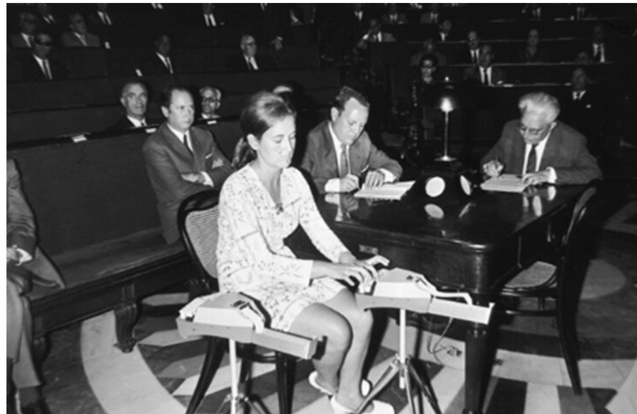
1968. TAQUÍGRAFA DE ESTENOTIPIA EN UN PLENO DE LAS CORTES.

El estenotipista es el profesional que utiliza la estenotipia, un método de escritura rápida que precisa un teclado llamado máquina de estenotipia.