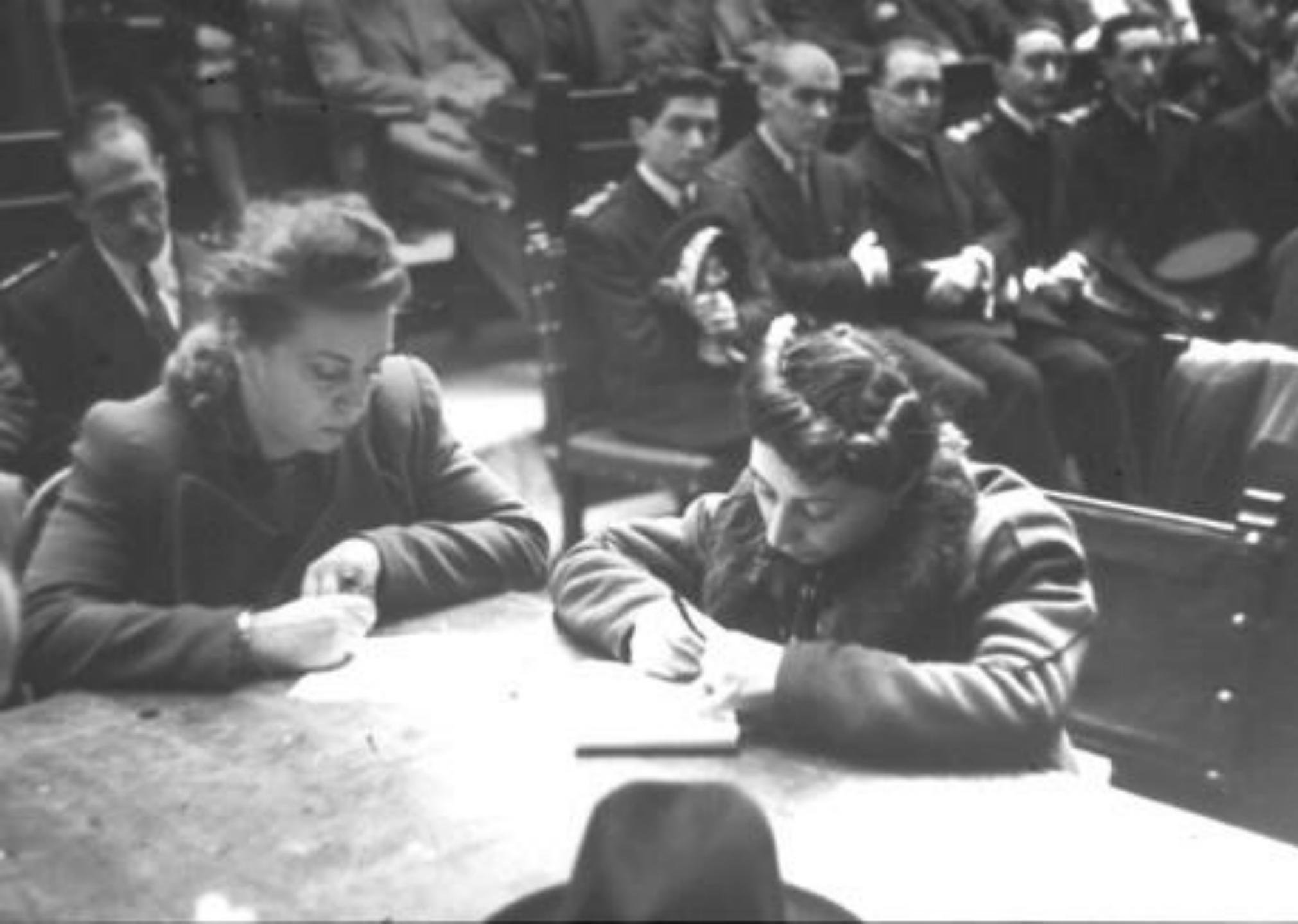
1944. TAQUÍGRAFAS.