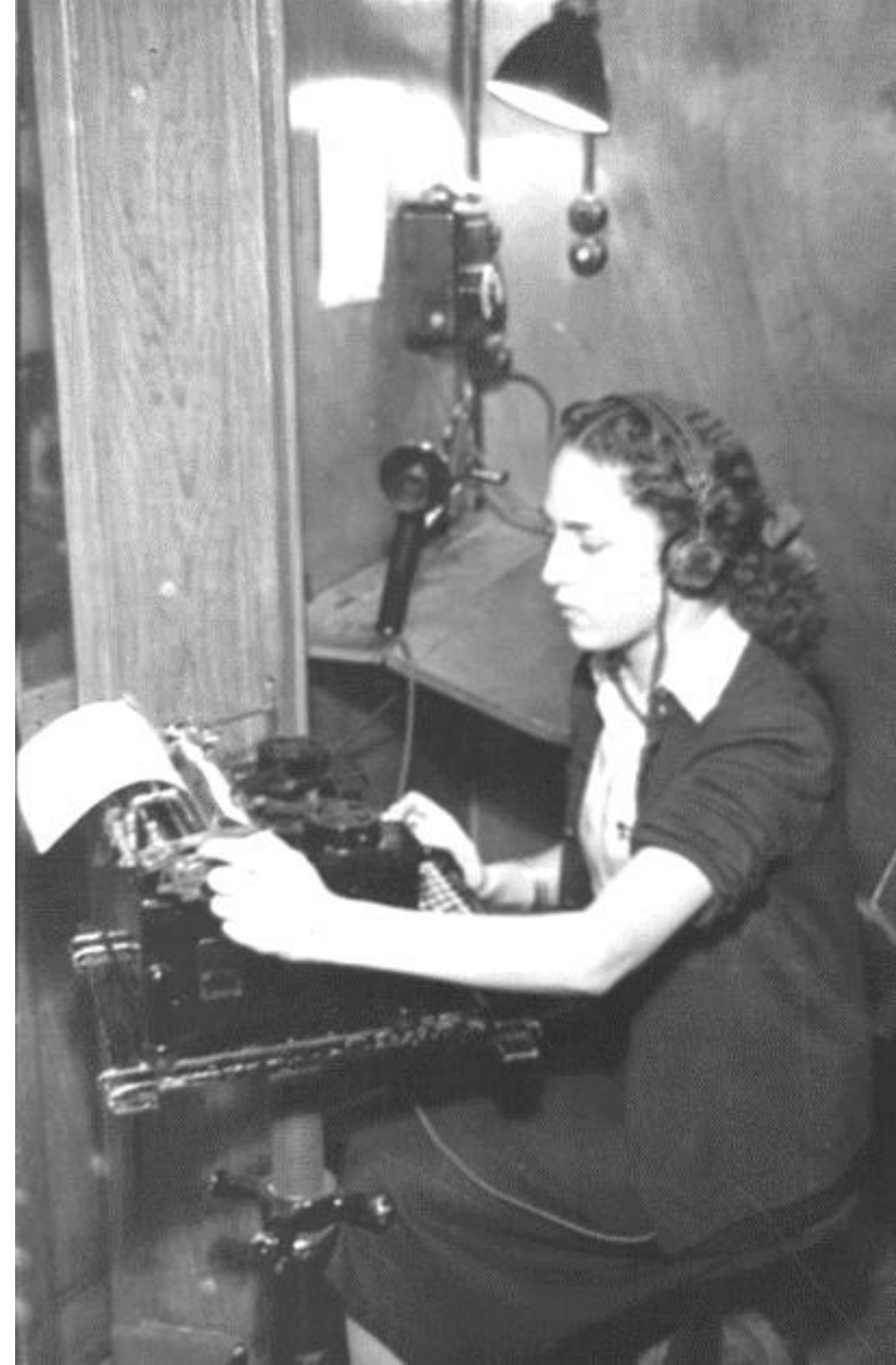
1950. MECANÓGRAFA EN LA MÁQUINA DE ESCRIBIR.