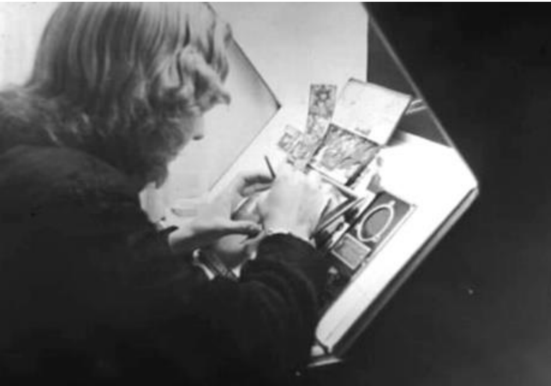
1944. ILUMINADORA DE PRUEBAS FOTOGRAFÍCAS. FONDO FOTOGRAFÍCO MARTÍN SANTOS YUBERO. ARCM.