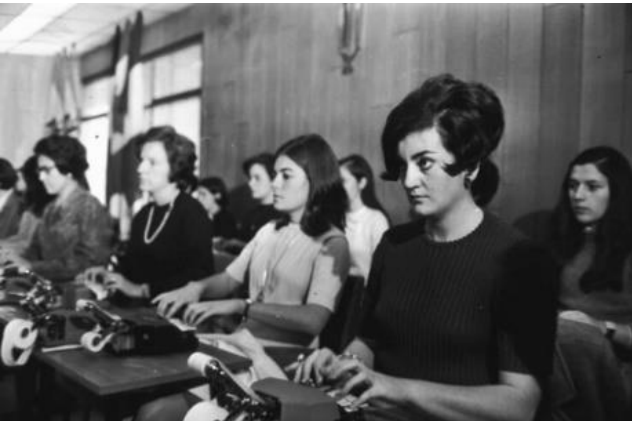
1968. ESTENOTIPISTAS. CAMPEONATO INTERNACIONAL.

El estenotipista es el profesional que utiliza la estenotipia, un método de escritura rápida que precisa un teclado llamado máquina de estenotipia.