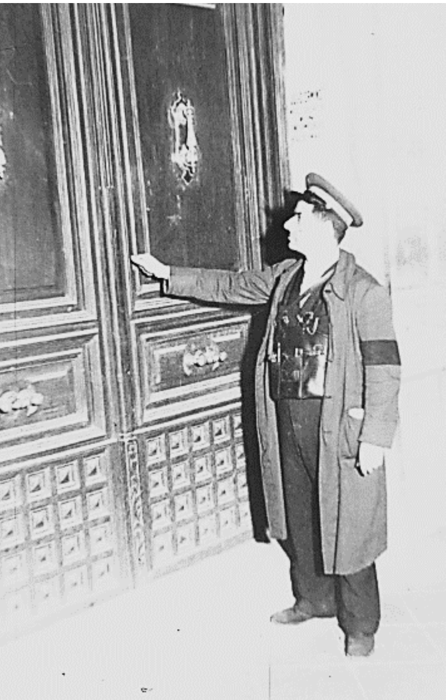
1940. SERENO ABRIENDO UNA PUERTA.

El sereno era el encargado nocturno de vigilar las calles y regular el alumbrado público. En determinadas ciudades o barrios también debía abrir las puertas. Incluso, en algunos países, anunciaba la hora y las variaciones atmosféricas. Era habitual que fuesen armados con una garrota o chuzo, y usasen un silbato para dar la alarma en caso necesario.