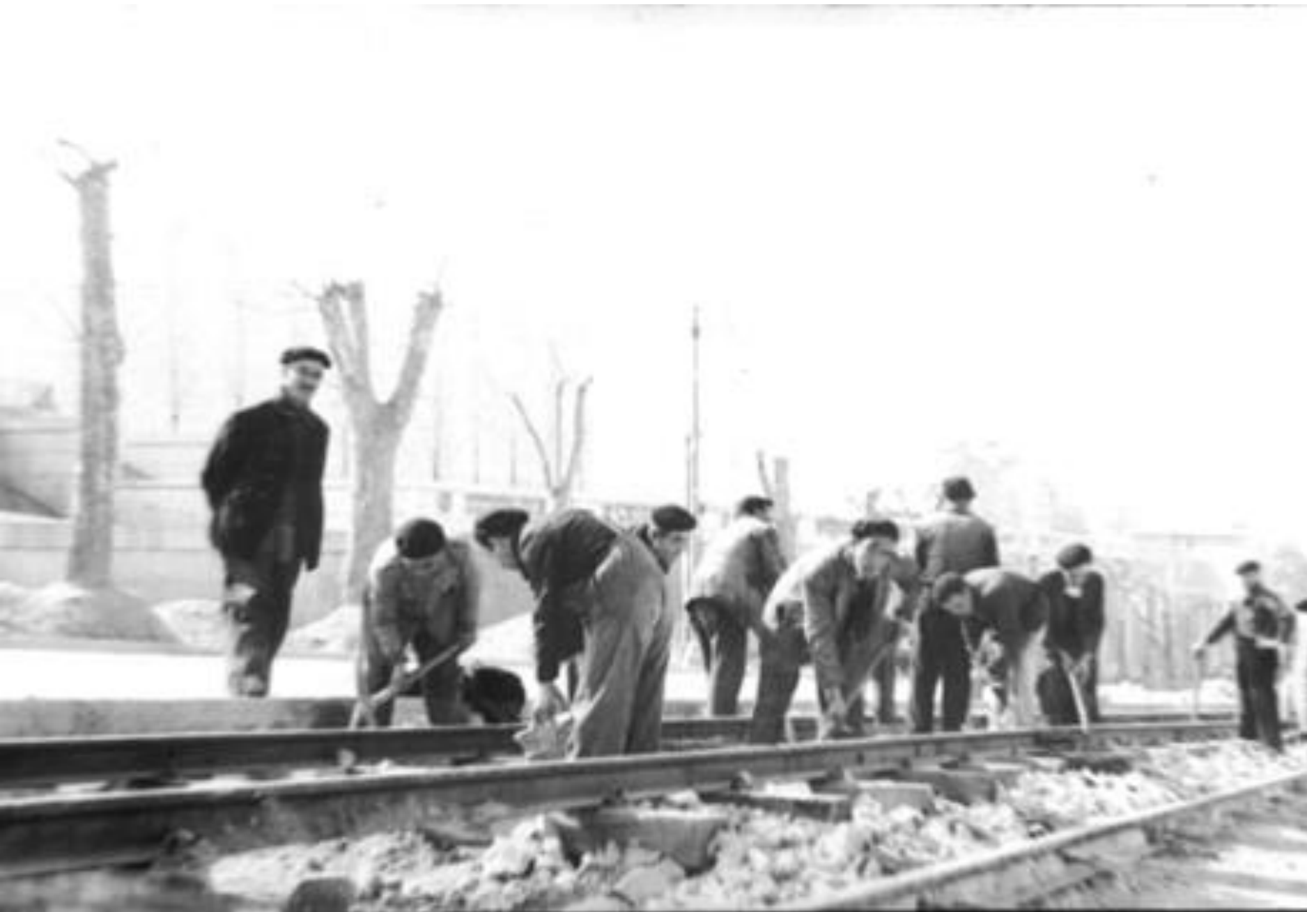
1944. ARREGLO DE VÍAS DEL TRANVÍA EN EL PASEO DE SAN VICENTE.