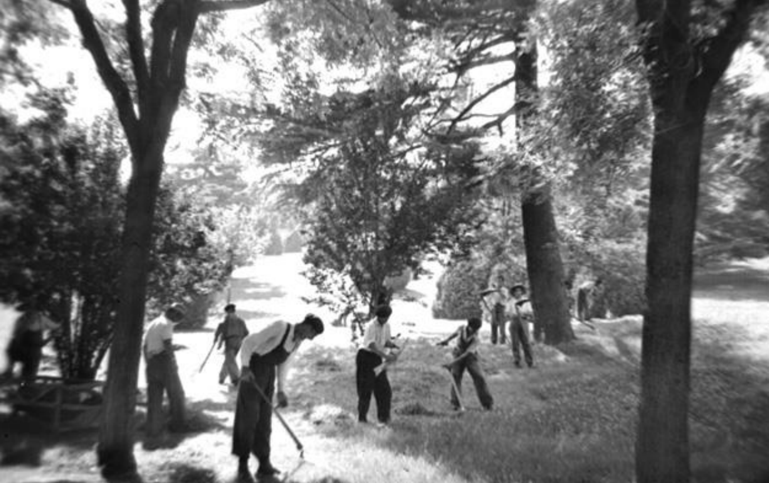
1955. SEGANDO LA HIERBA EN EL PARQUE DEL OESTE.