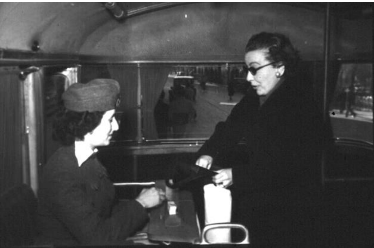
1955. SEÑORITA COBRADORA DE AUTOBUSES AL BARRIO DE LA CONCEPCIÓN. FONDO FOTOGRÁFICO MARTÍN SANTOS YUBERO. ARCM.