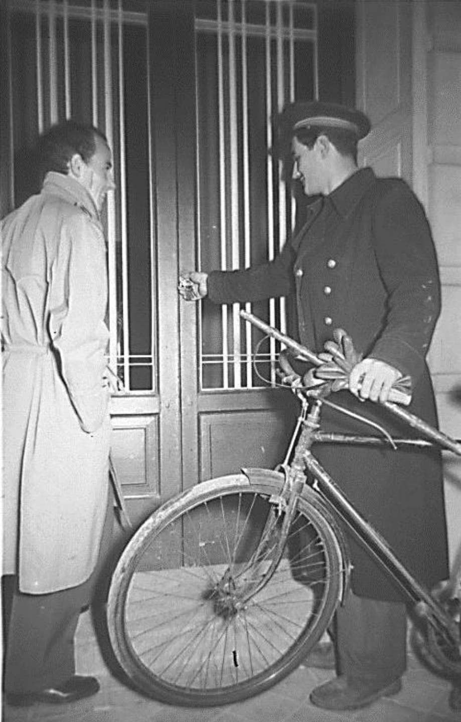
1954. SERENO EN BICICLETA.