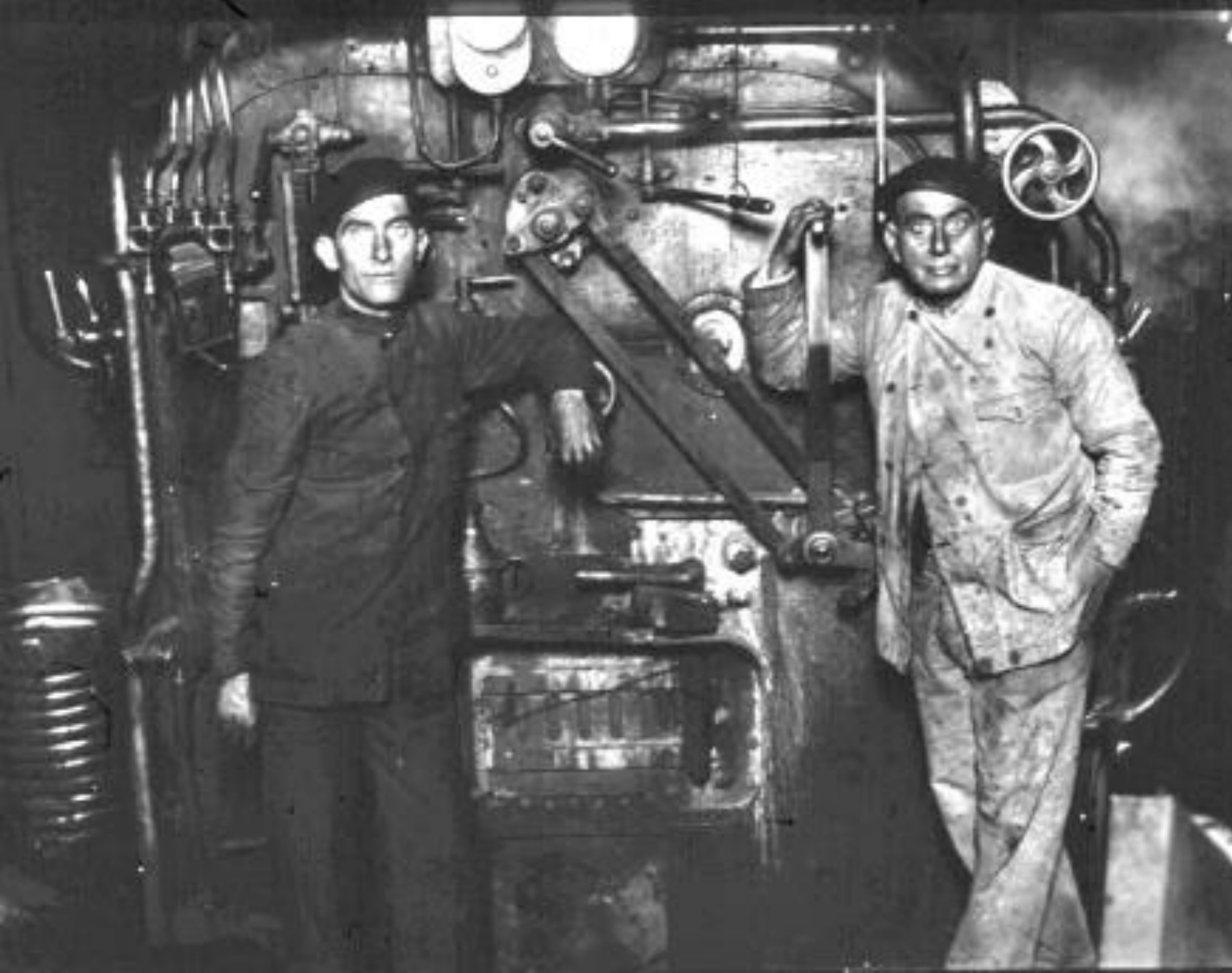
1933. MAQUINISTA Y FOGONERO.