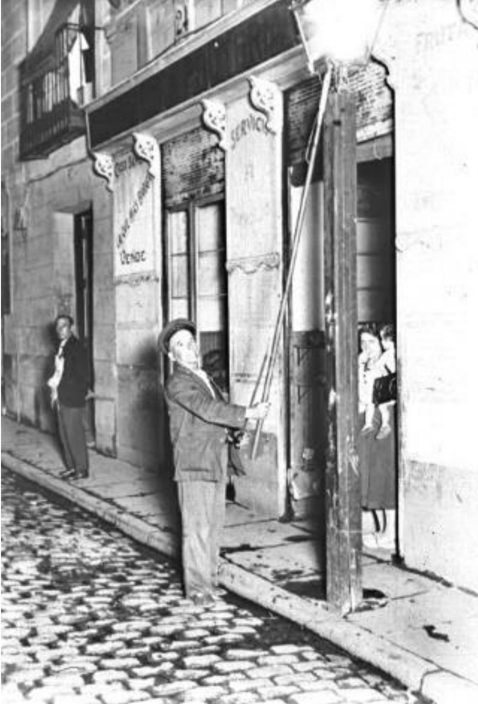
AÑOS 30. FAROLERO.

Cuando no existía iluminación eléctrica, el farolero era la persona encargada de encender los faroles de una población y mantenerlos en buen estado.