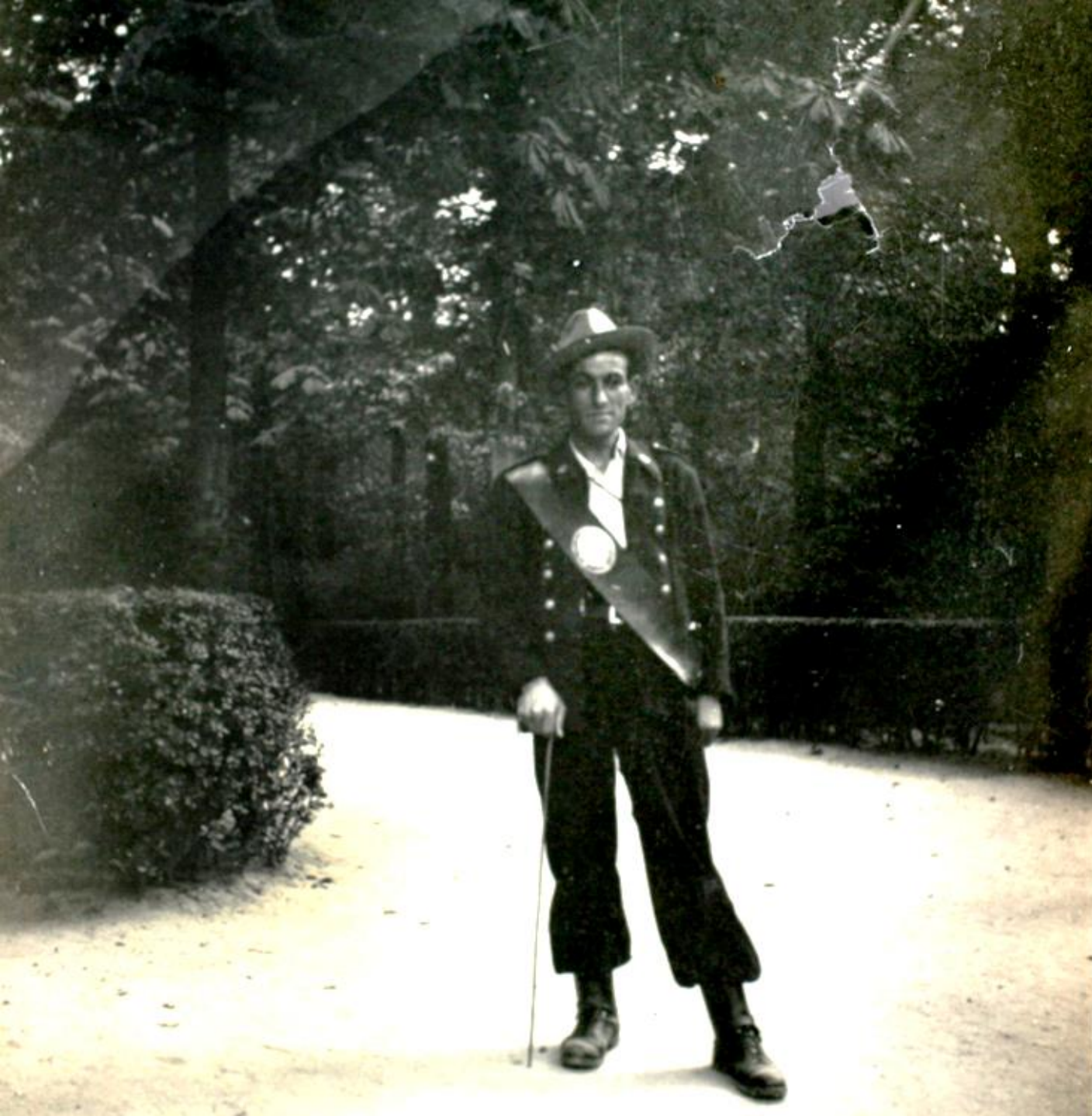
1950. RETRATO DEL GUARDA DEL PARQUE DEL RETIRO.