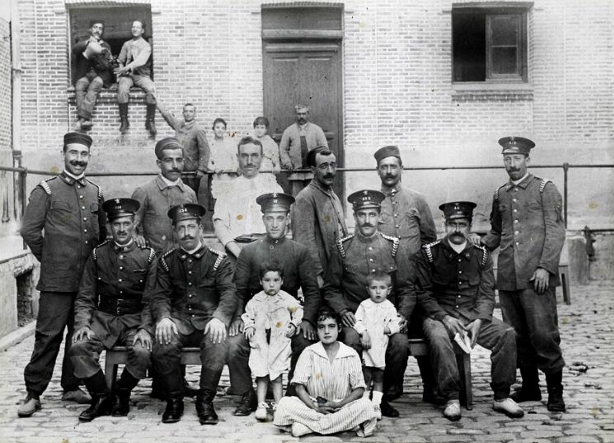
1920. PARQUE DE BOMBEROS Nº 1. SANTA ENGRACIA.