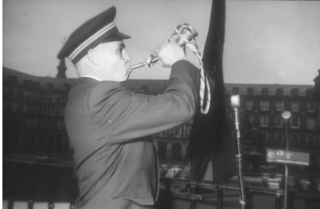
1961. CONCURSO DE PREGONEROS EN LA PLAZA MAYOR, PARA NOMBRAR PREGONERO MAYOR DE LA PROVINCIA.

El pregonero era antiguamente en España y los virreinos hispanos, el oficial público que en alta voz daba difusión a los pregones, para hacer público y notorio todo lo que se quería hacer saber a la población.