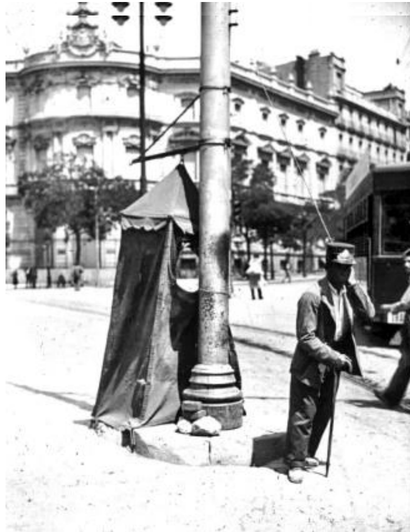
1933. GUARDAGUJAS DEL TRANVÍA.

El guardagujas (o guardavías ) es la persona que en los puntos de empalme de los tranvías tiene a su cargo mover las agujas cuando ha de efectuarse un cambio de vía. Los guardagujas están a las órdenes del jefe de estación en lo que concierne a la maniobra de las agujas y señales.