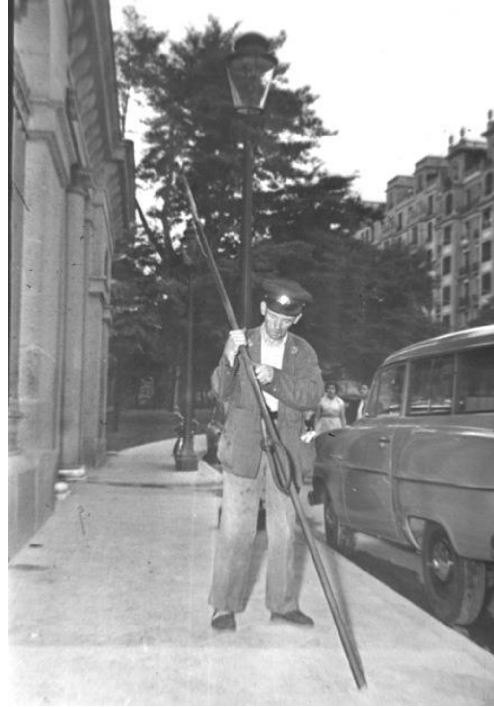
1955. FAROLERO CON CAÑA DE LAS FAROLAS DE GAS.

Cuando no existía iluminación eléctrica, el farolero era la persona encargada de encender los faroles de una población y mantenerlos en buen estado.