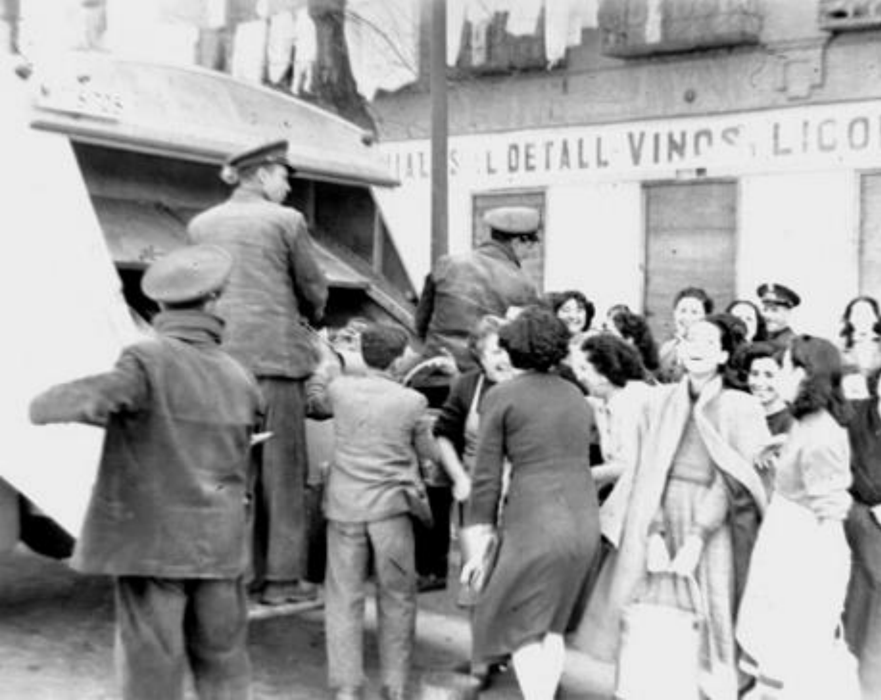
1955. NUEVO SISTEMA DE RECOGIDA DE BASURAS CON CAMIONES DEL AYUNTAMIENTO.