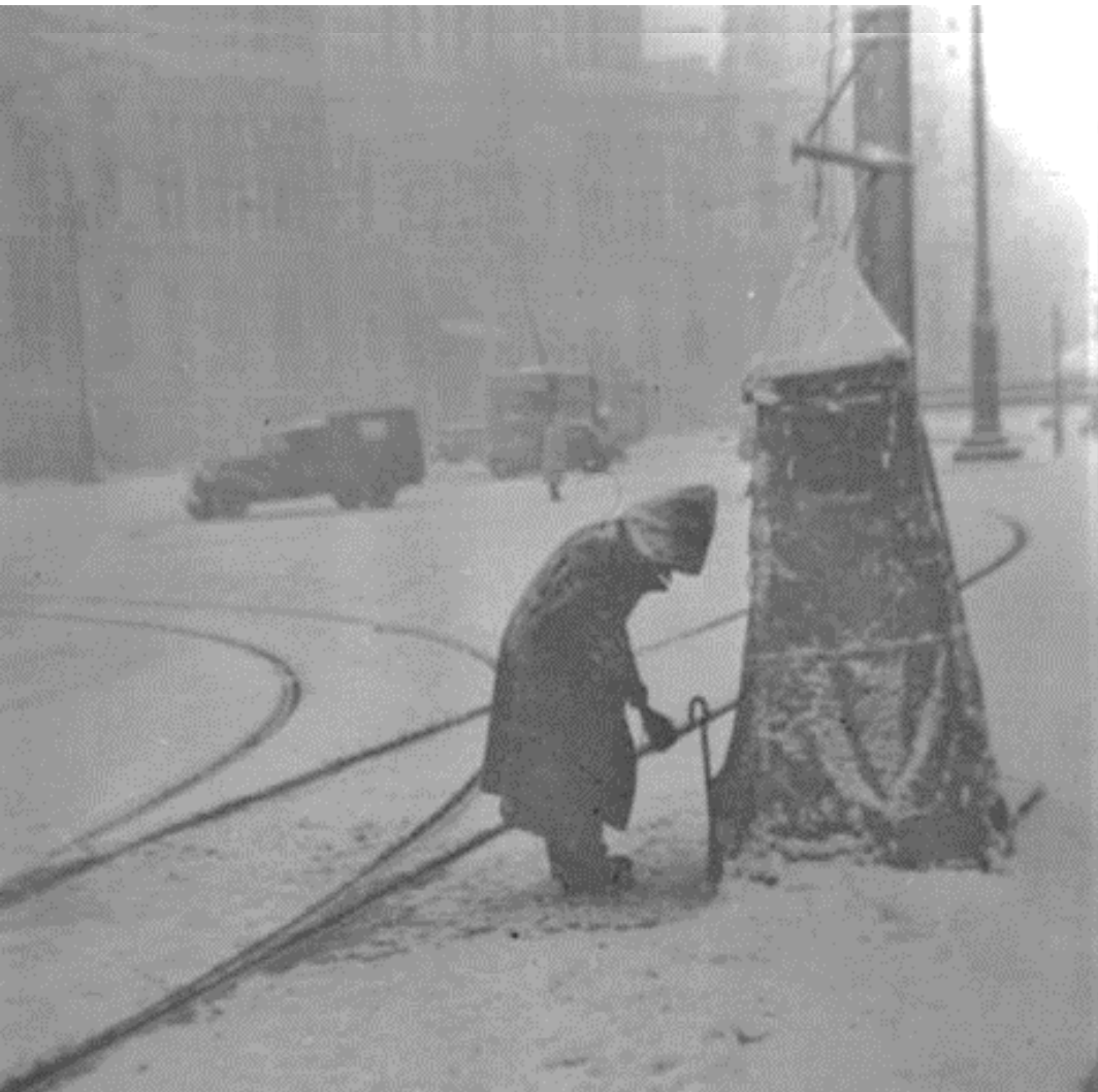
1945. GUARDAGUJAS DEL TRANVÍA.