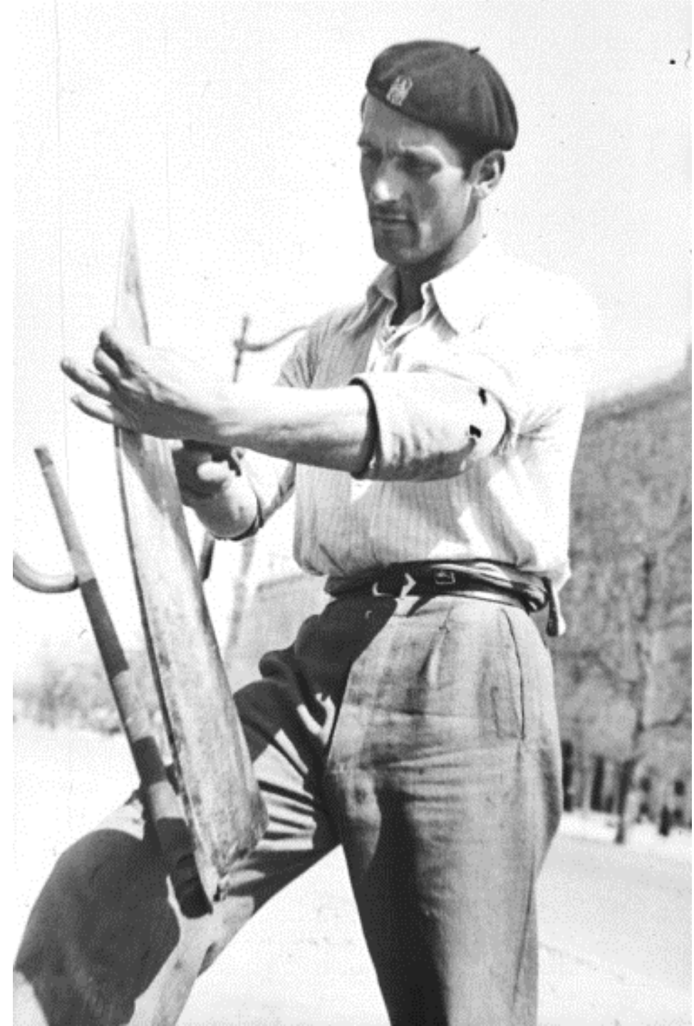
1942. SEGADOR CON GUADAÑA EN EL PASEO DEL PRADO.