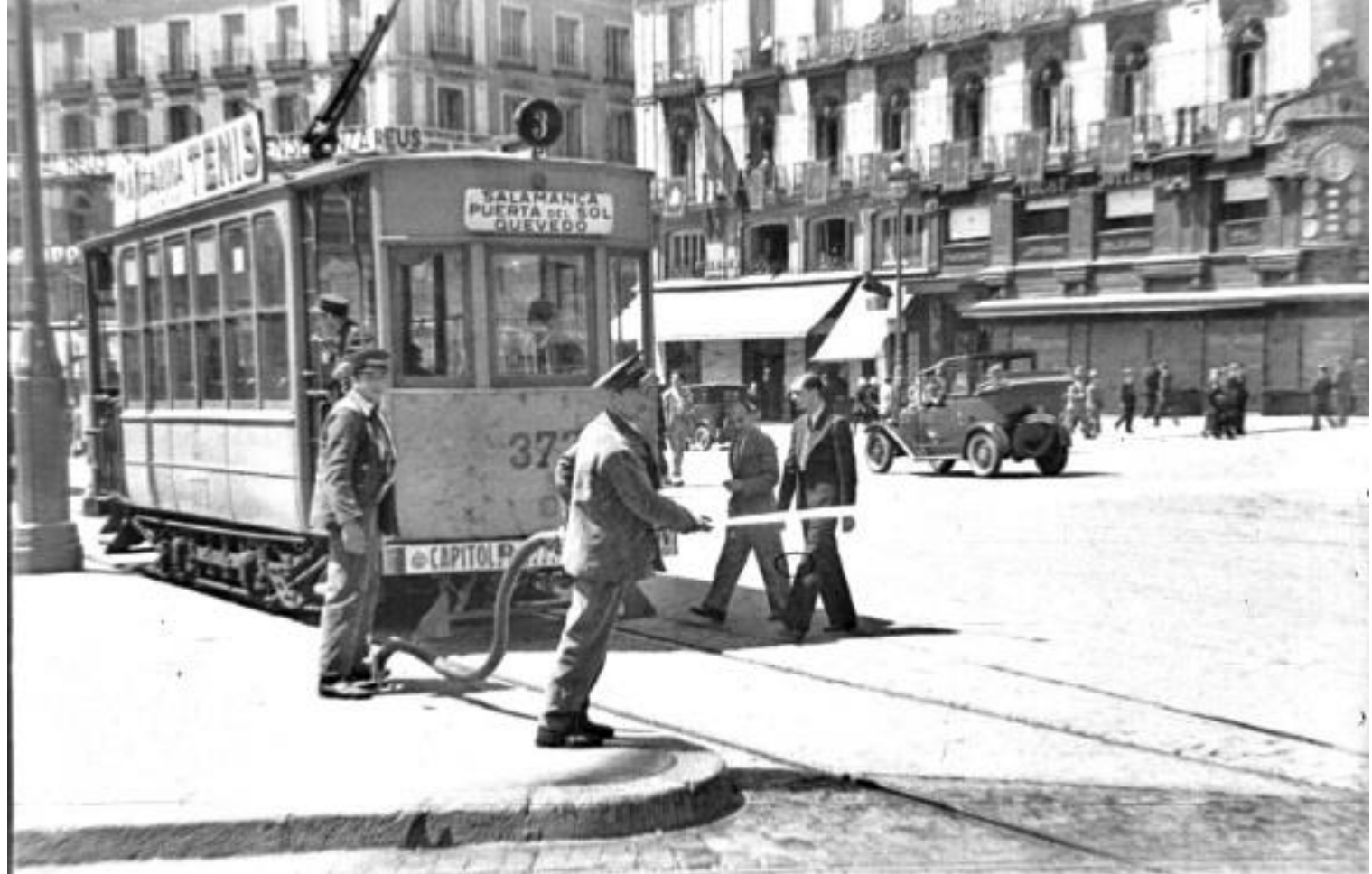
AÑOS 40. BARRENDOS REGANDO EN LA PUERTA DEL SOL.