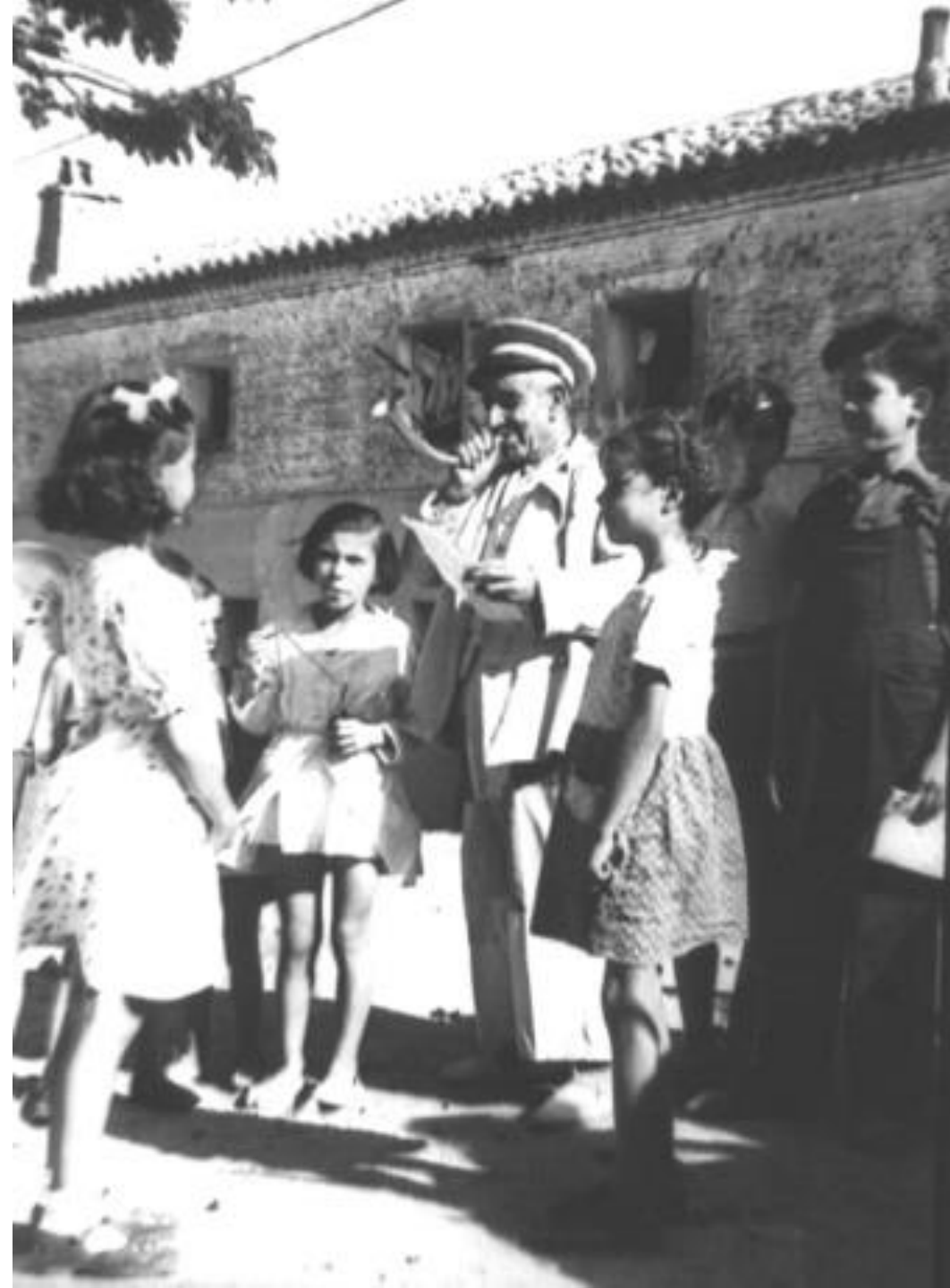
1944. EL PREGONERO. FONDO FOTOGRAFICO MARTÍN SANTOS YUBERO. ARCM.