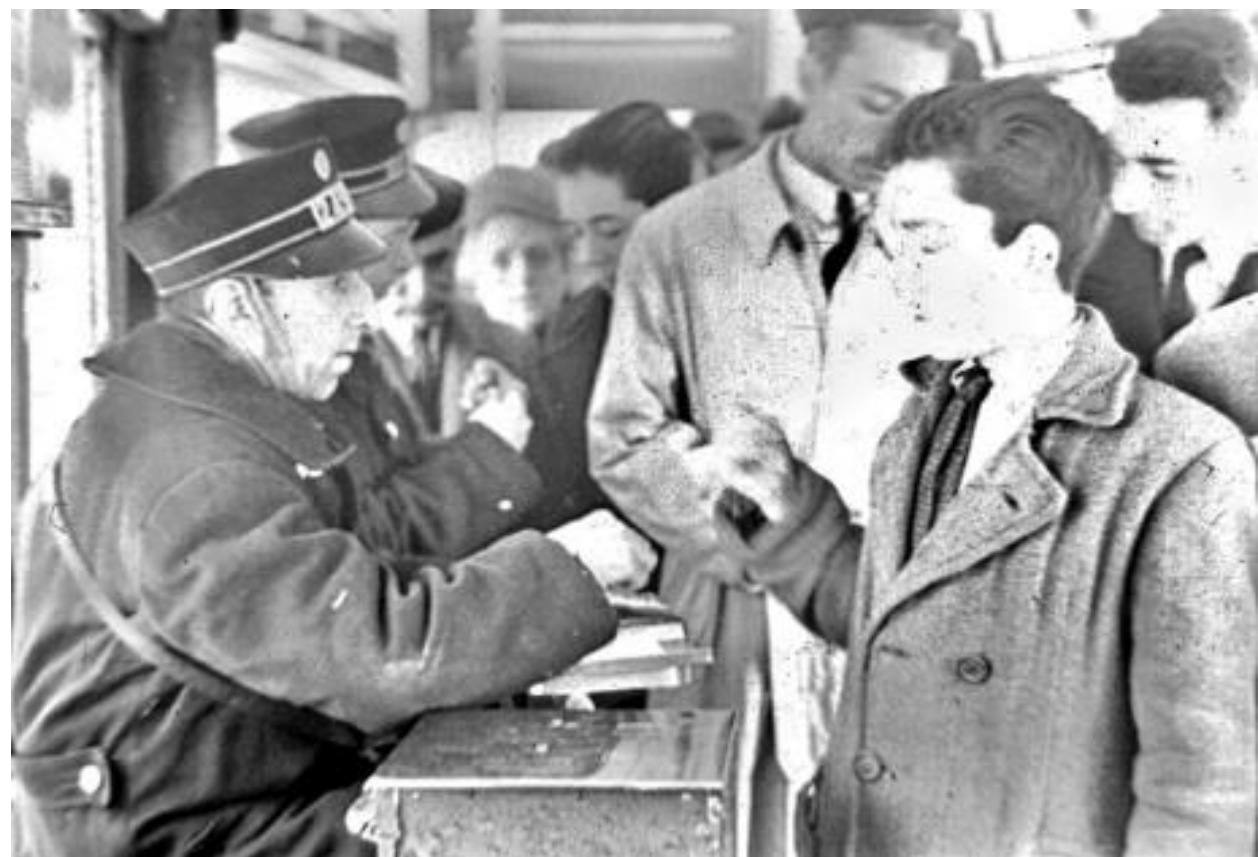
1947. COBRANDO SENTADO EN LOS TRANVÍAS NUEVOS.