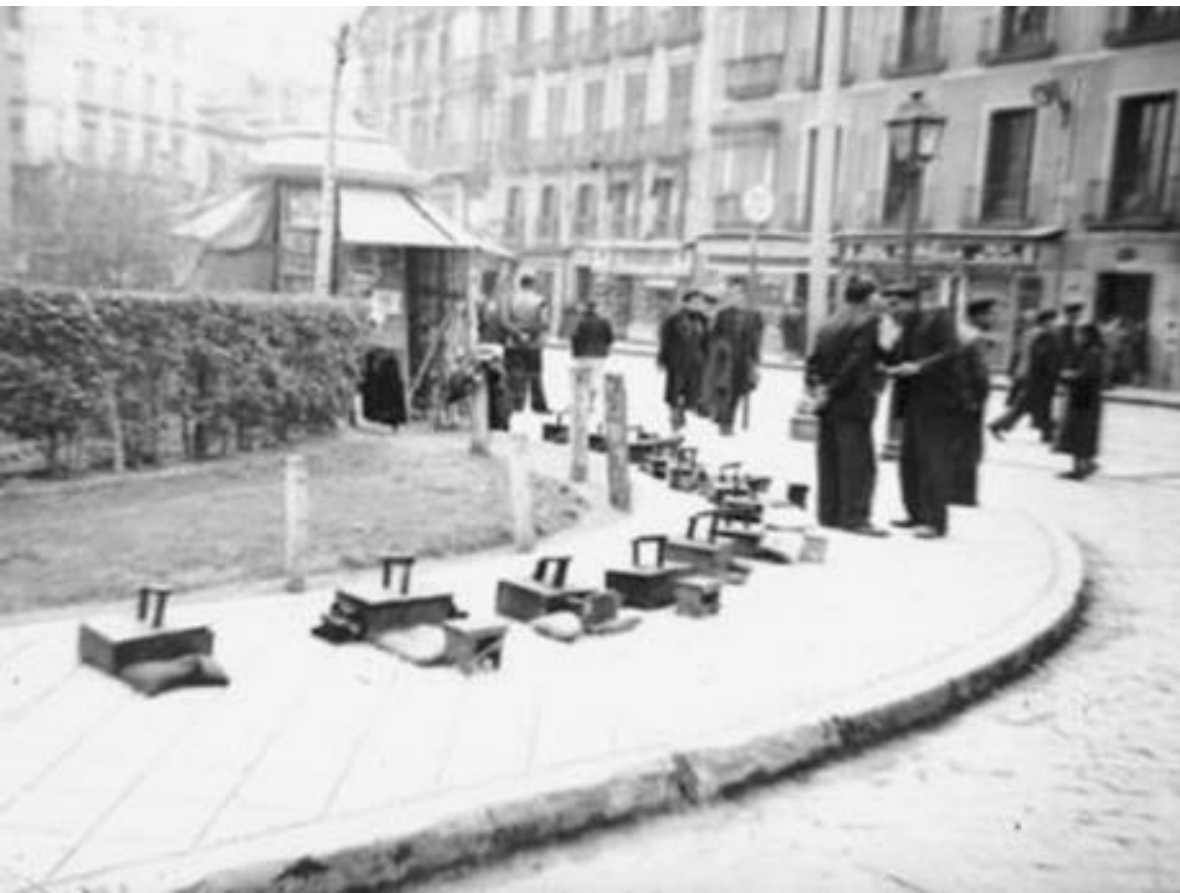
1944. LIMPIABOTAS EN HUELGA FORZOSA.