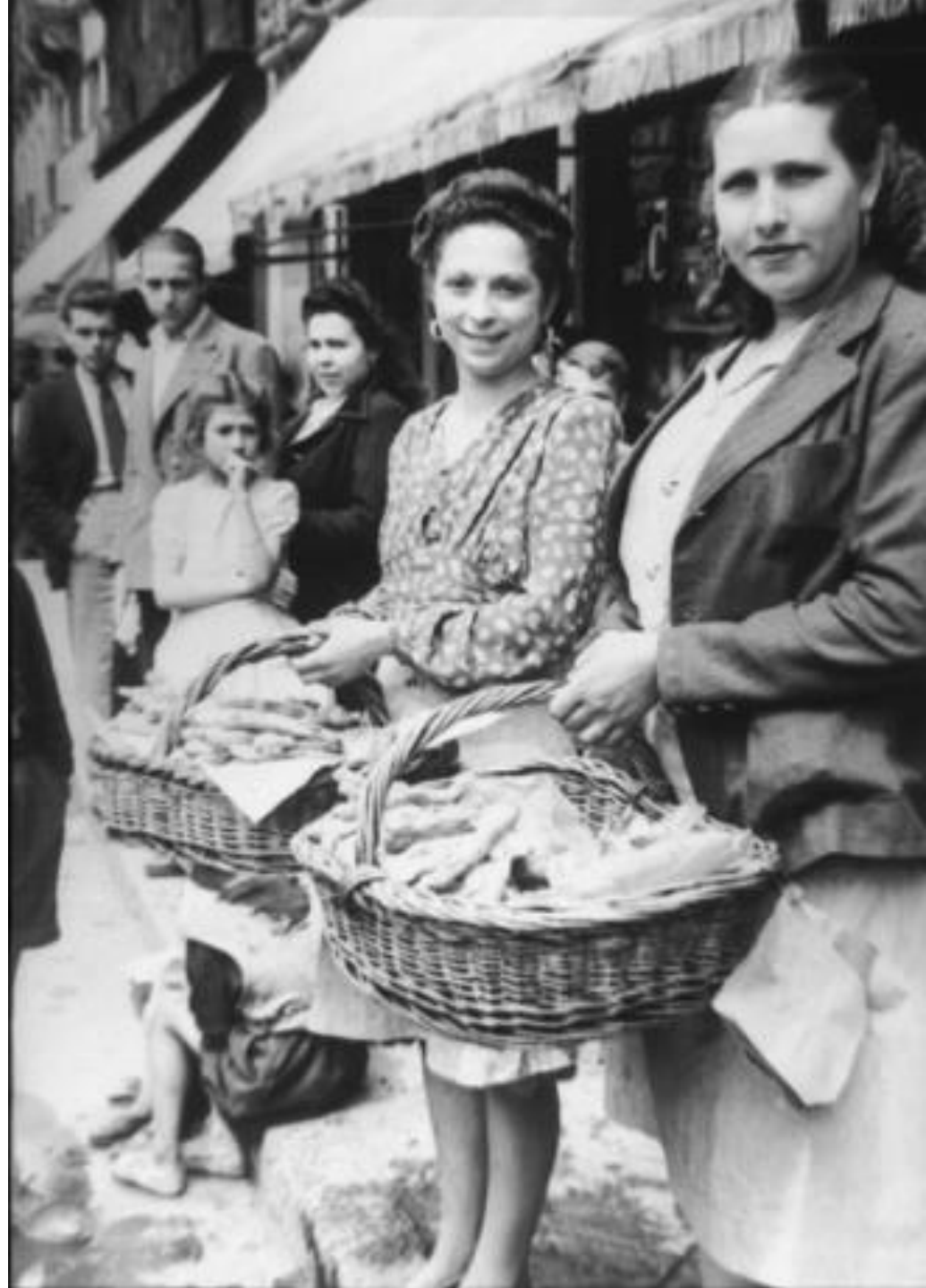
1944. VENDEDORAS DE “CHIRIBIGUIS” (BUÑUELOS).