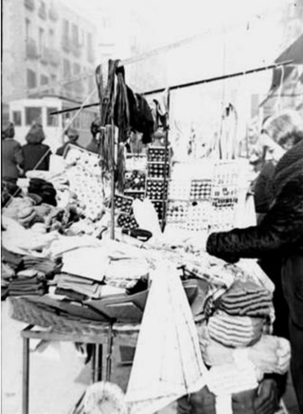
1944. PUESTOS CALLEJEROS EN LA CALLE TOLEDO.