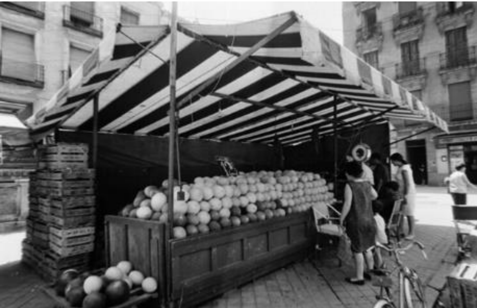
1966. PUESTO DE MELONES.