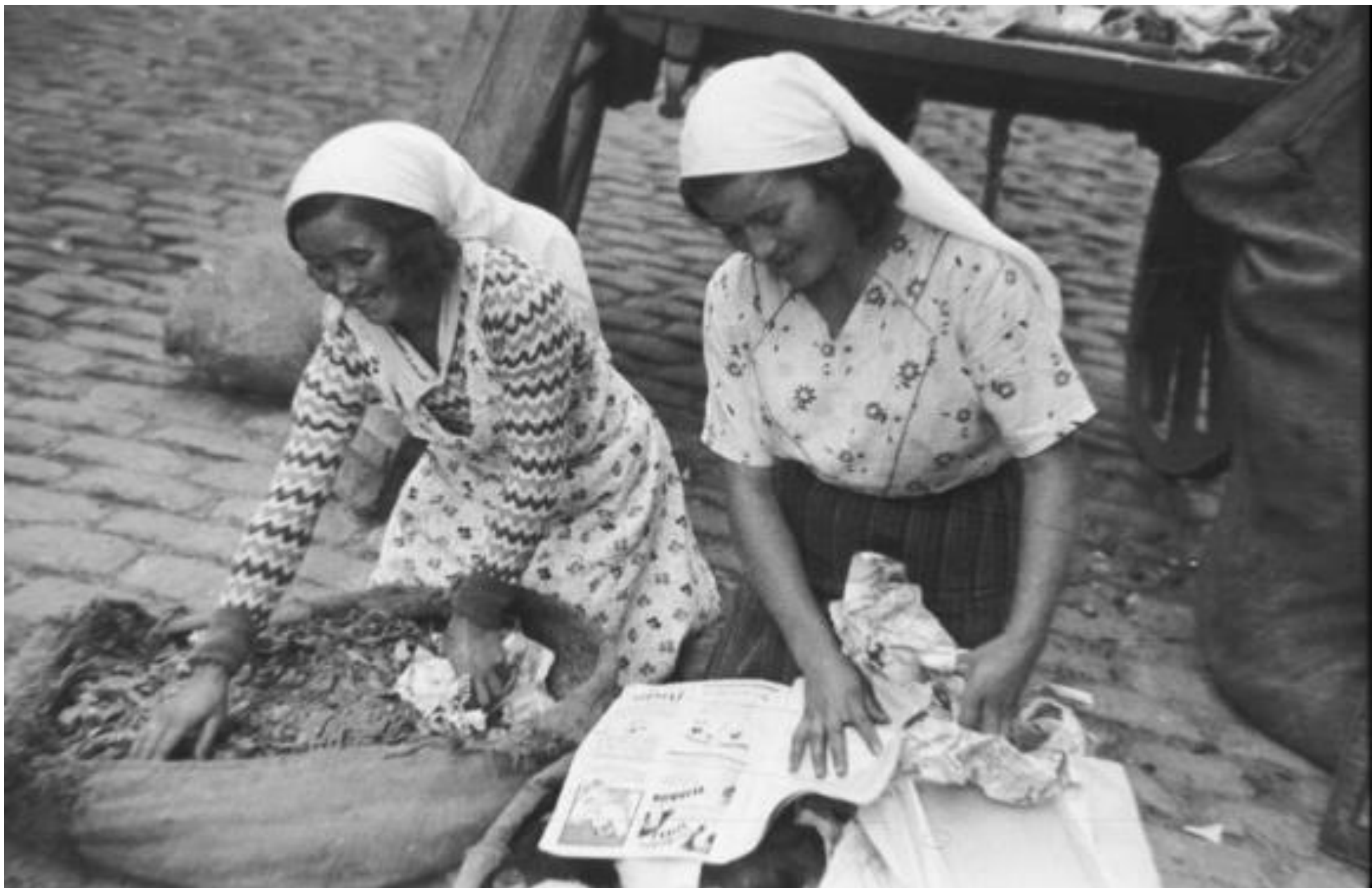
1951. TRAPERAS.