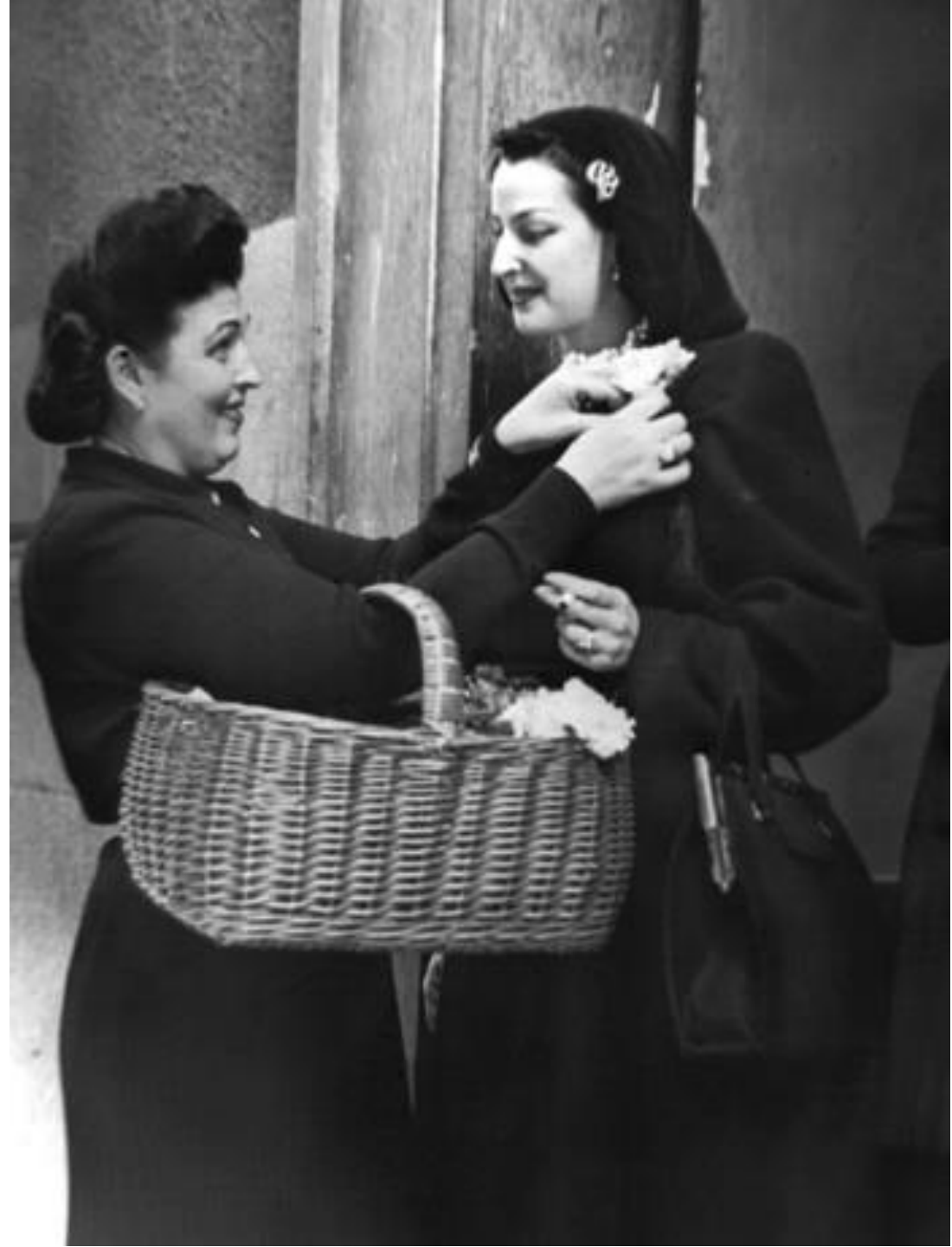
1945. FLORISTA POR LA CALLE DE ALCALÁ.