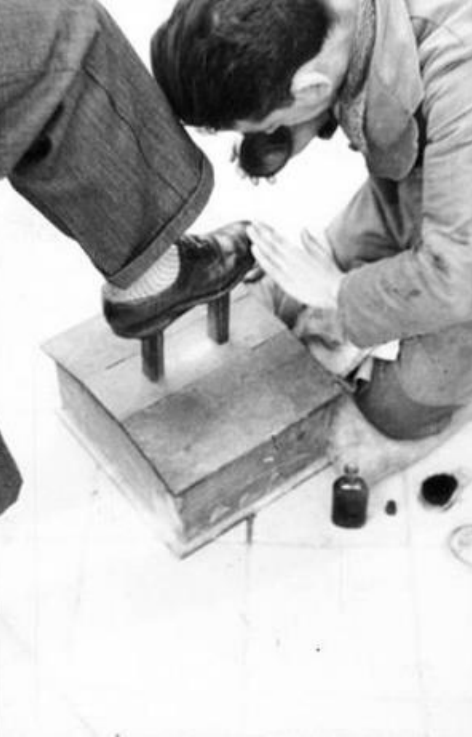
1940. LIMPIABOTAS.