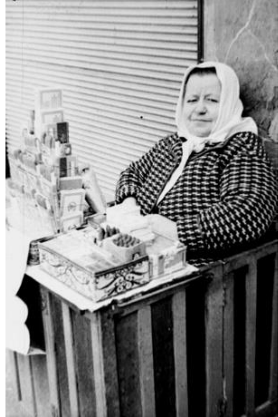
1935. VENDEDORA DE TABACOS.