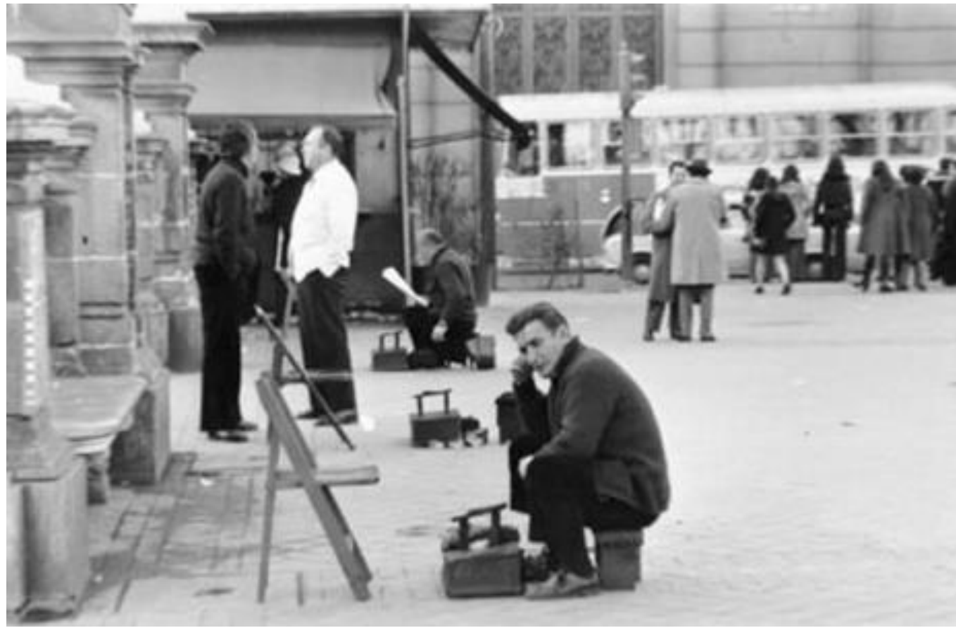
1974. LIMPIABOTAS ESPERANDO CLIENTES EN CIBELES.