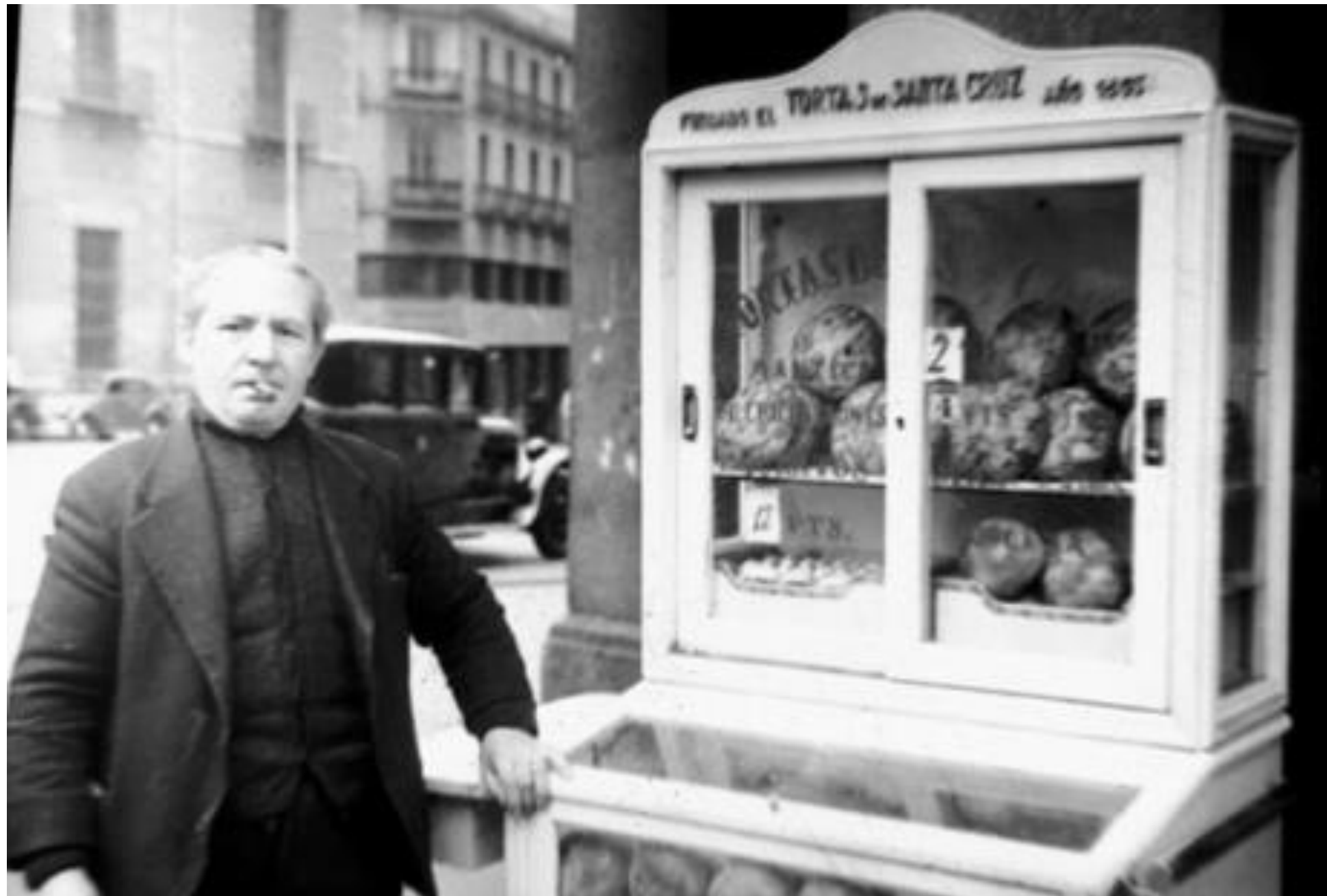
1947. VENDEDOR DE TORTAS EN LA PLAZA DE SANTA CRUZ.