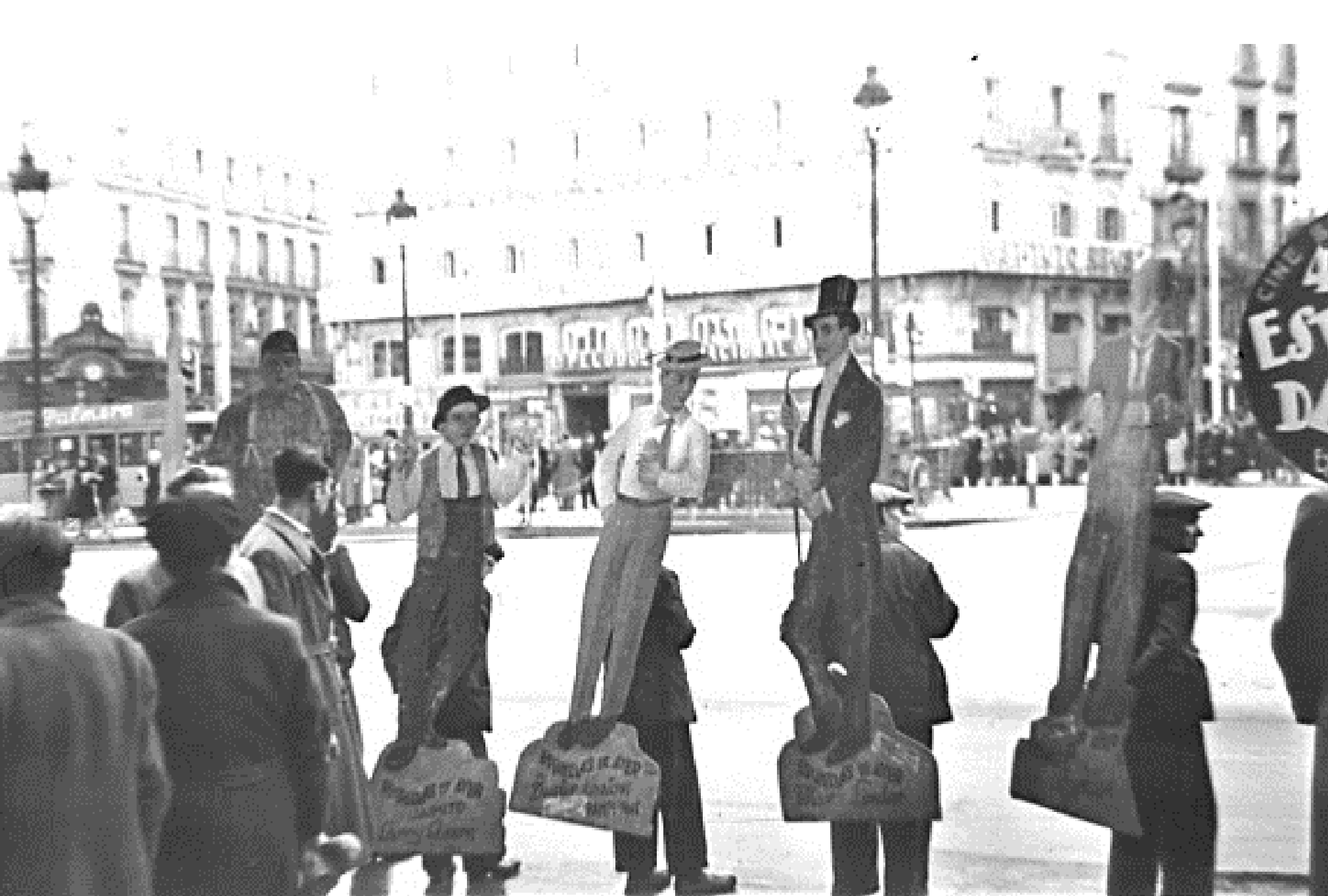
1943. HOMBRES ANUNCIO.