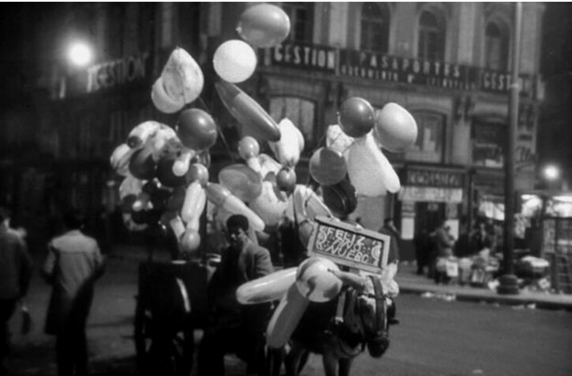
1959. CARRO CON GLOBOS EN LA PUERTA DEL SOL LA NOCHE DE FIN DE AÑO.