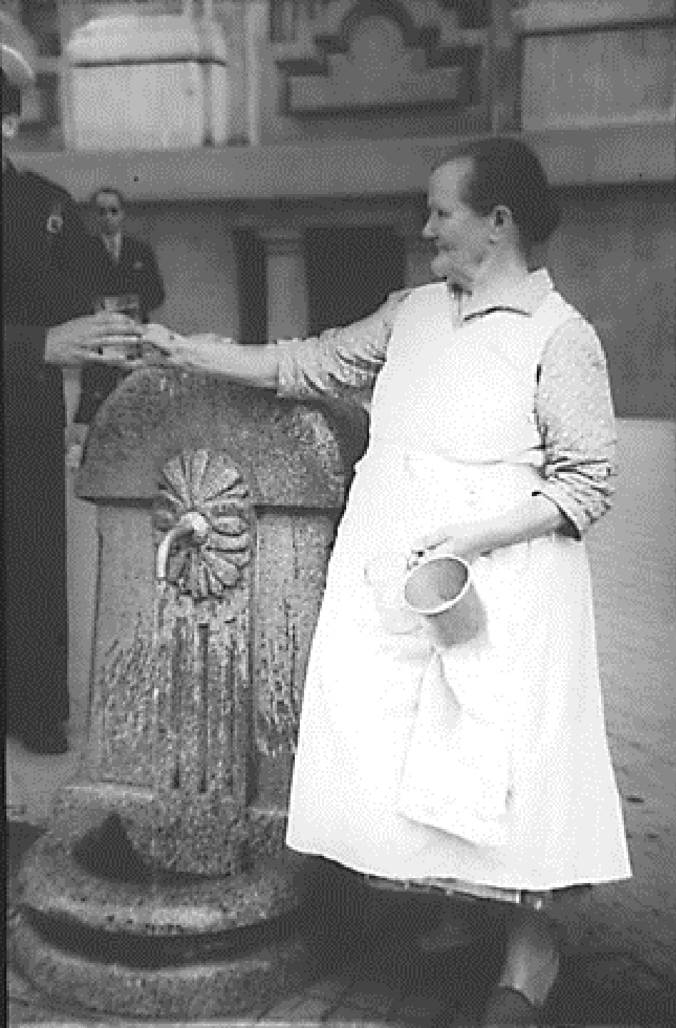
1945 Y 1948. LA AGUADORA DE LA CALLE DE ALCALÁ.