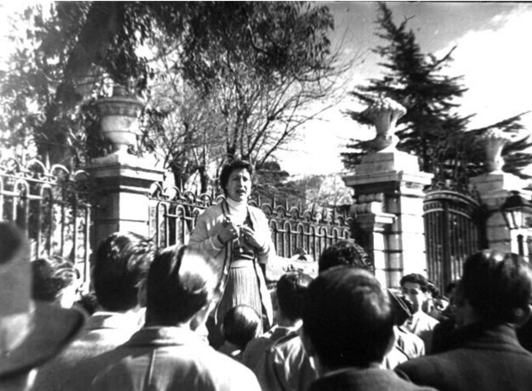
1955. CHARLATANA EN EL PORTILLO DE EMBAJADORES.

Los charlatanes eran personas que se dedicaban a la venta ambulante y que anunciaban a voces y a bombo y platillo sus productos y habilidades.