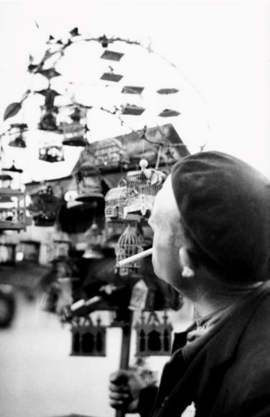
1941. VENDEDOR DE GRILLOS.