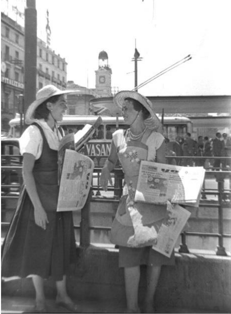
1955. VENDEDORAS DE PERIÓDICOS.