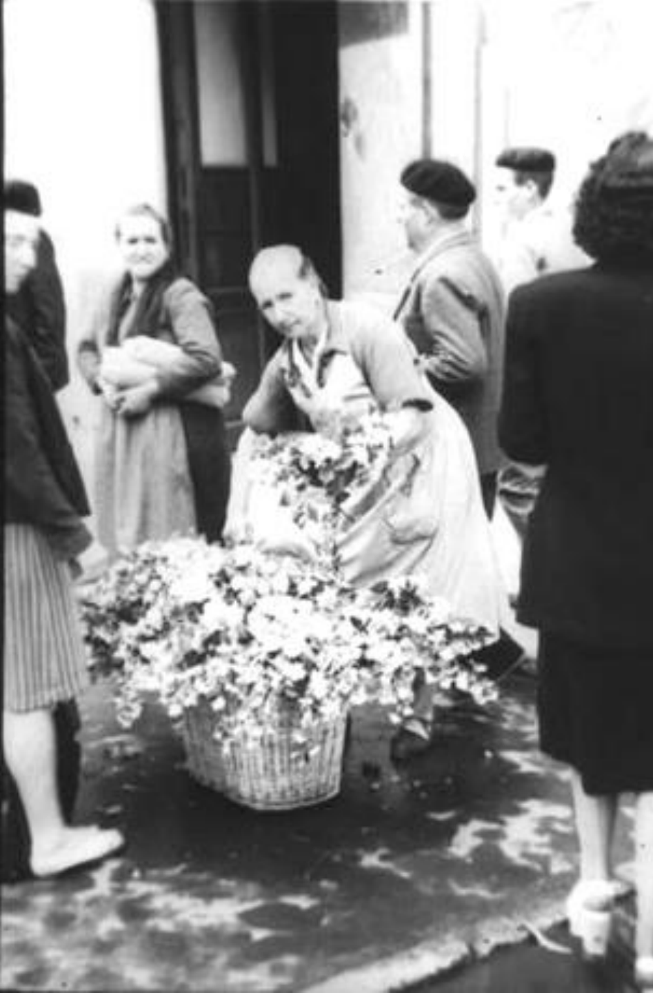
1944. VENDEDORA DE FLORES.