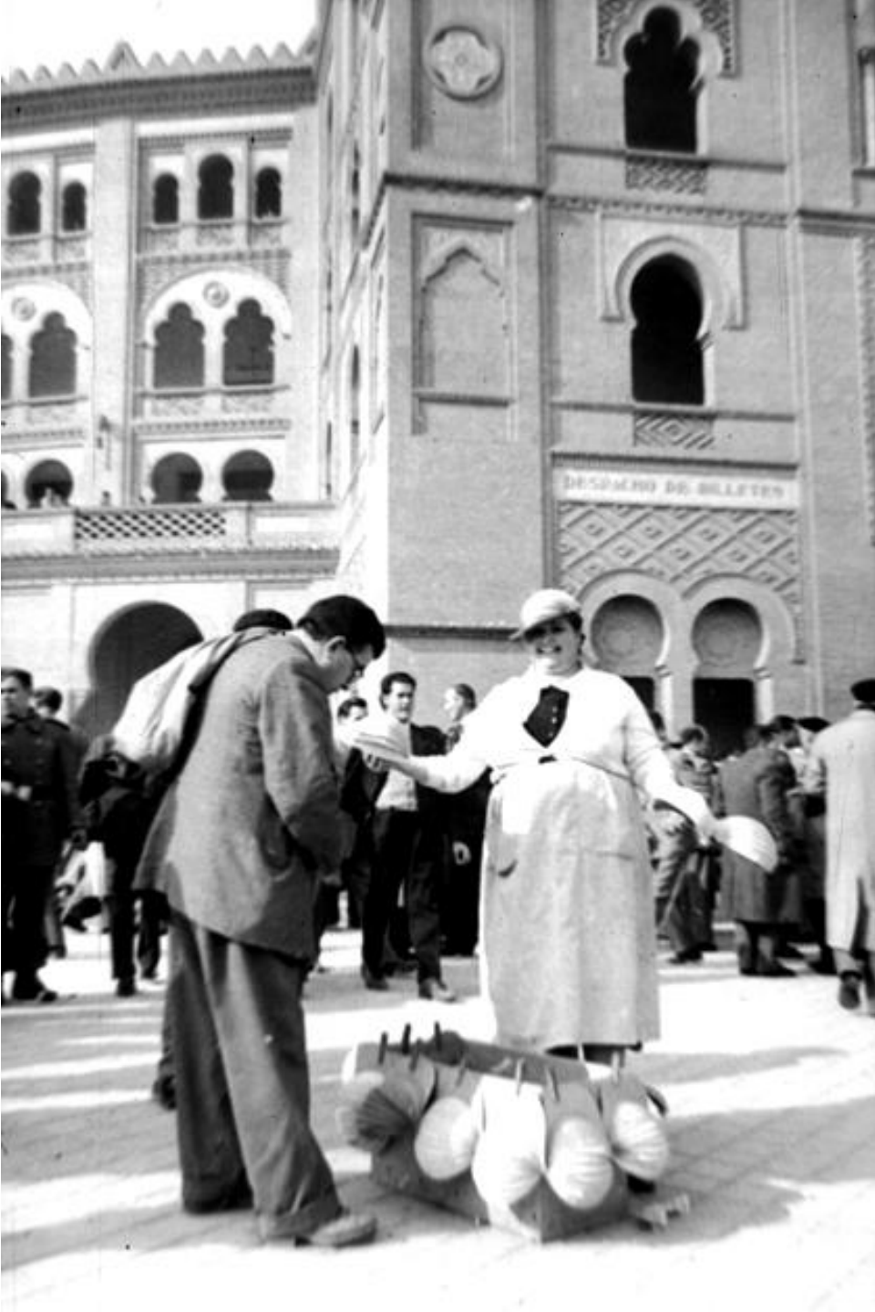
1956. VENDEDORA DE QUITASOLES EN LA PUERTA DE LA PLAZA DE TOROS DE 'LAS VENTAS'.