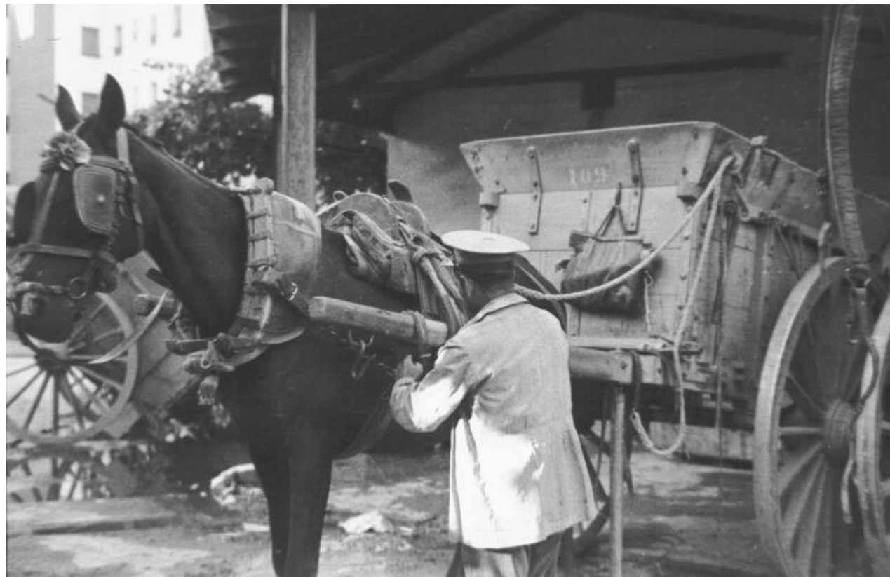
1935. EL TRAPERO CON SU CARRO.