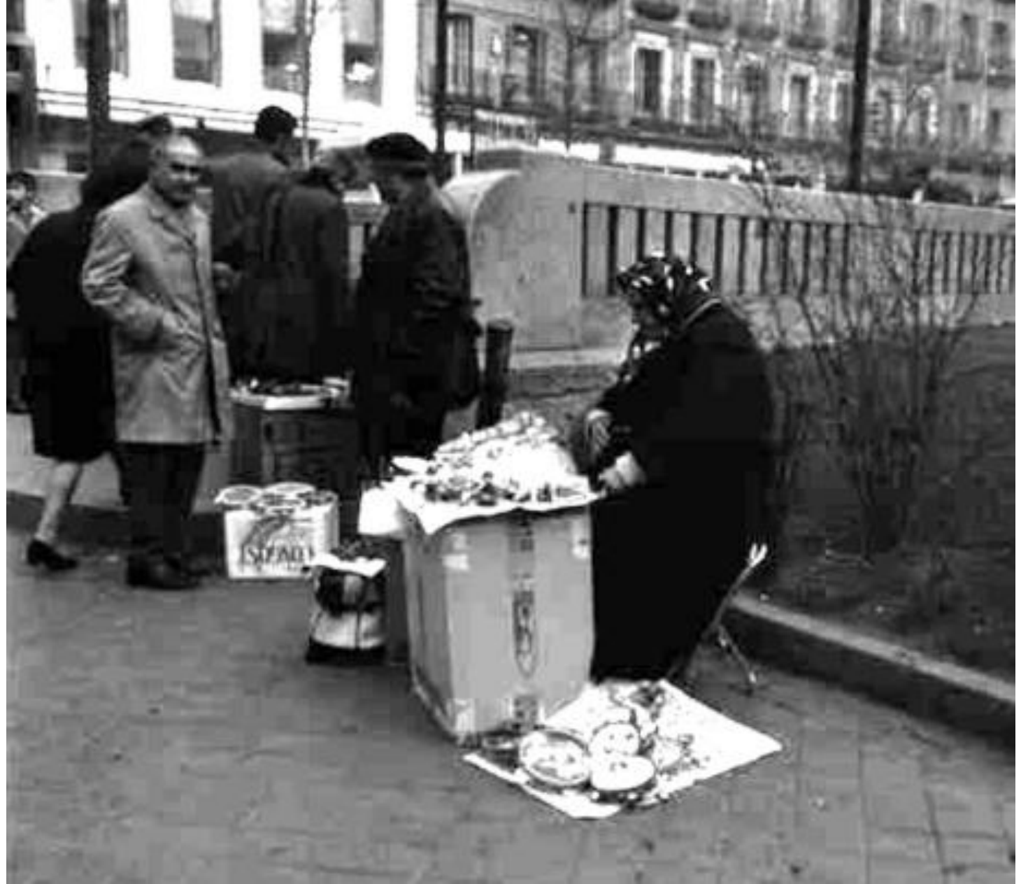
1969. VENDEDORA DE CHUCHERÍAS.