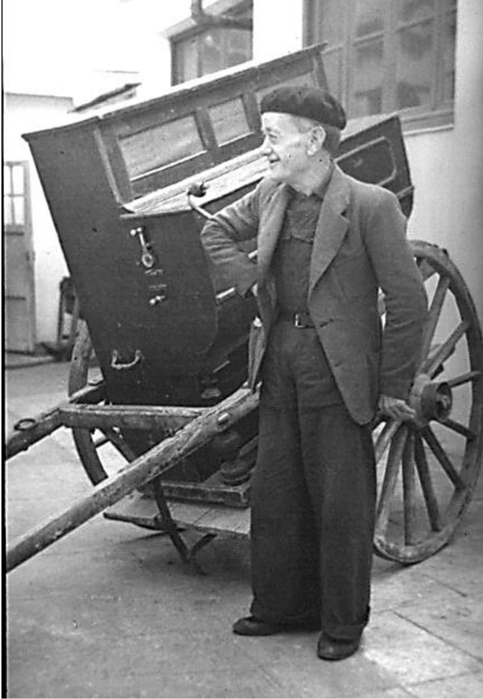
1943. TOCANDO EL ORGANILLO CON EL CODO.