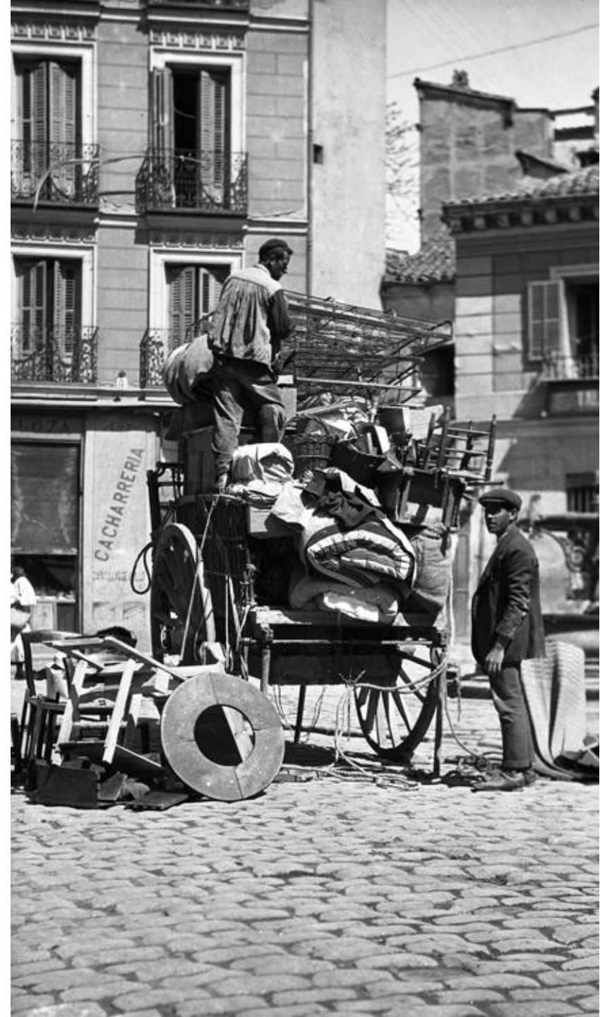
1922. CACHARREROS CARGANDO UN CARRO. COLECCIÓN MADRILEÑOS. ARCM.