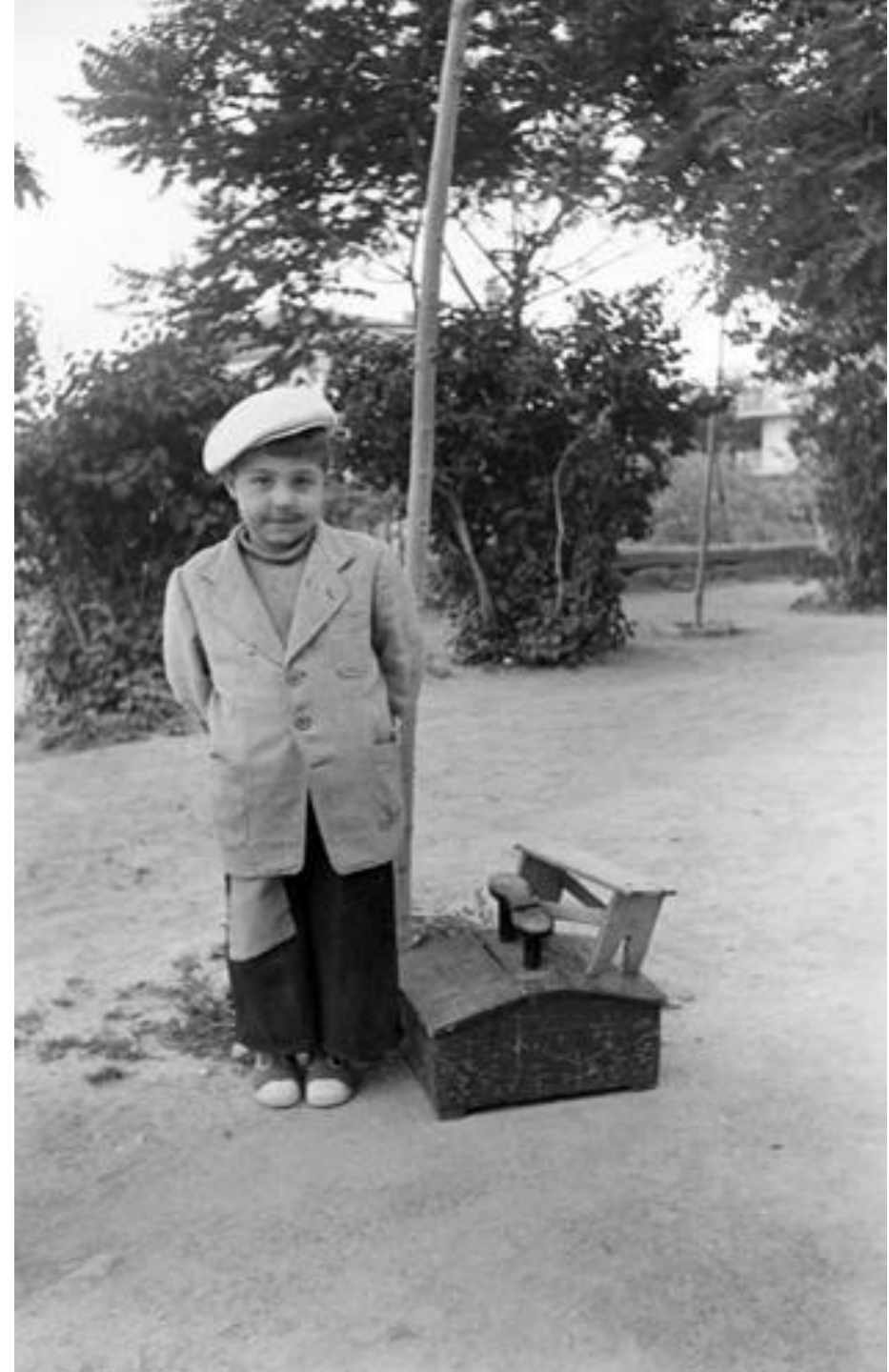
1950. PEQUEÑO LIMPIABOTAS. COLECCIÓN MADRILEÑOS. ARCM.