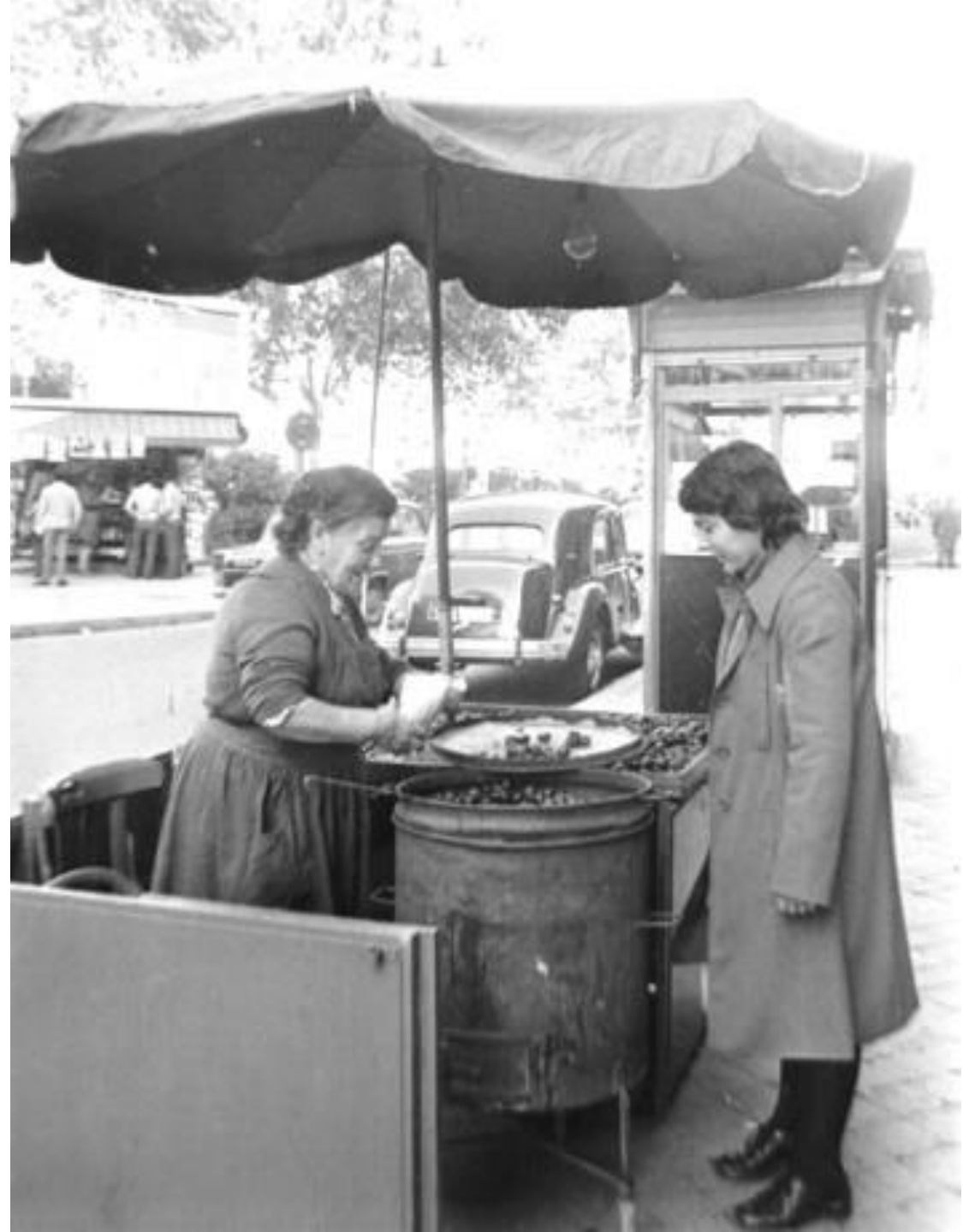
1972. "LA CARI", CASTAÑERA.