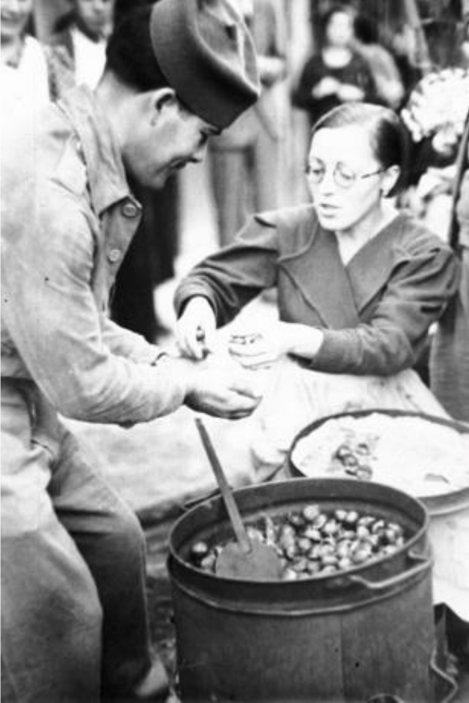
1939. VENDEDOR DE PATATAS ASADAS Y DE CASTAÑAS.