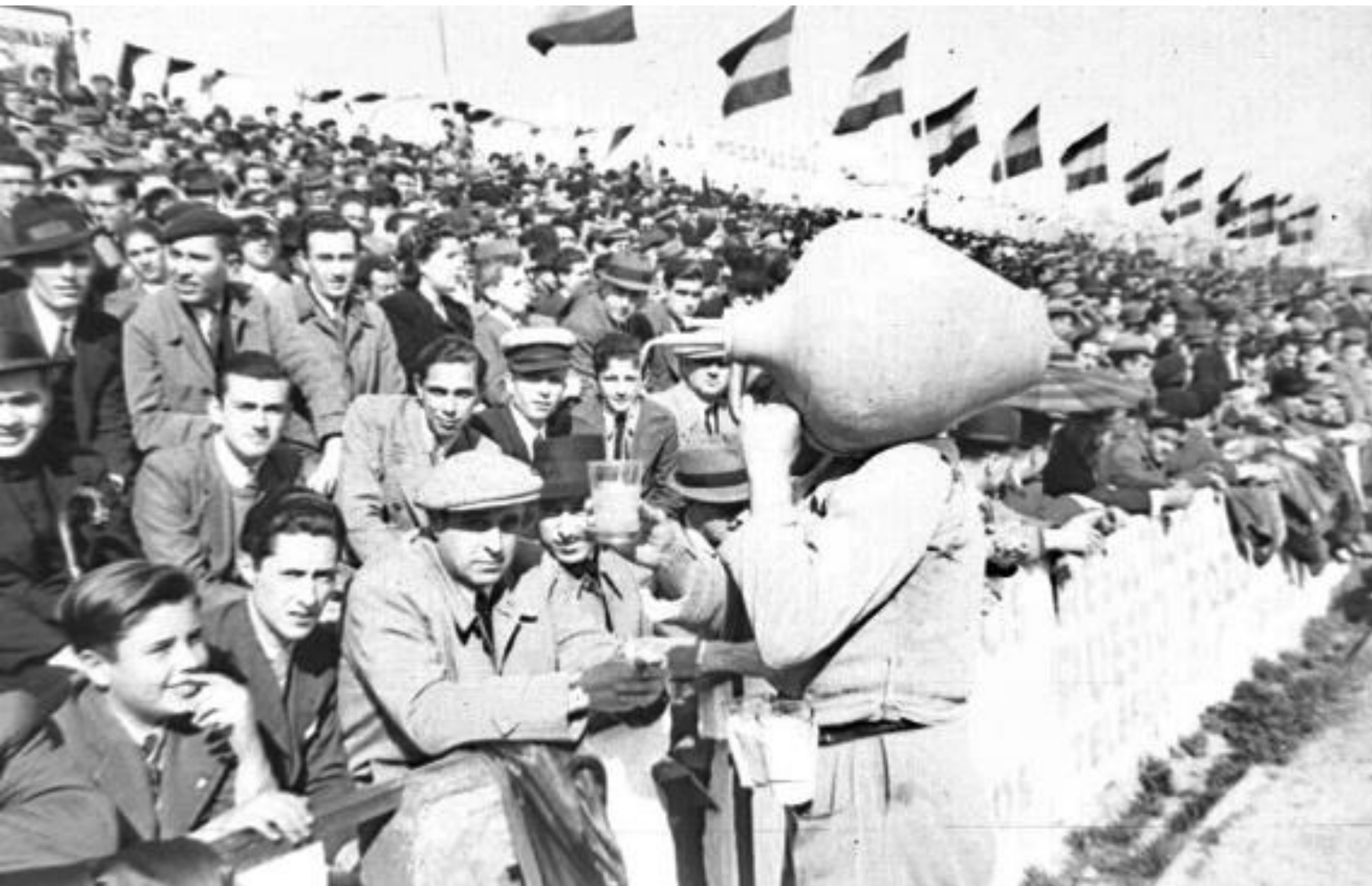
1942. AGUADOR EN UN PARTIDO DE FÚTBOL.