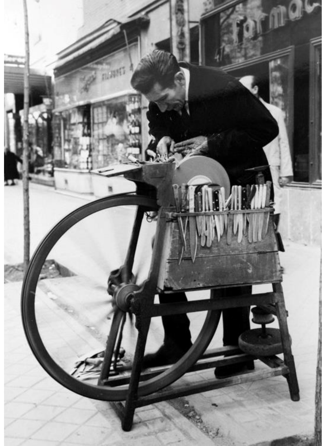
1964. EL AFILADOR DEL BARRIO DE SALAMANCA (MADRID).

El afilador o amolador es un comerciante ambulante, que ofrece sus servicios de afilar cuchillos, tijeras, navajas y otros instrumentos de corte.