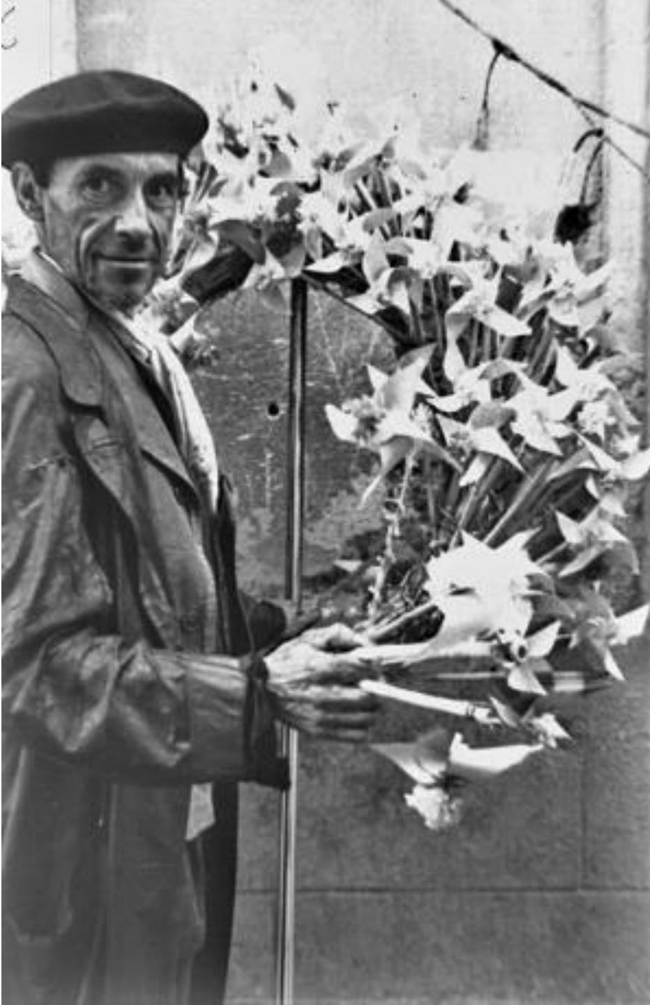
1941. VENDEDOR DE MOLINILLOS DE PAPEL.