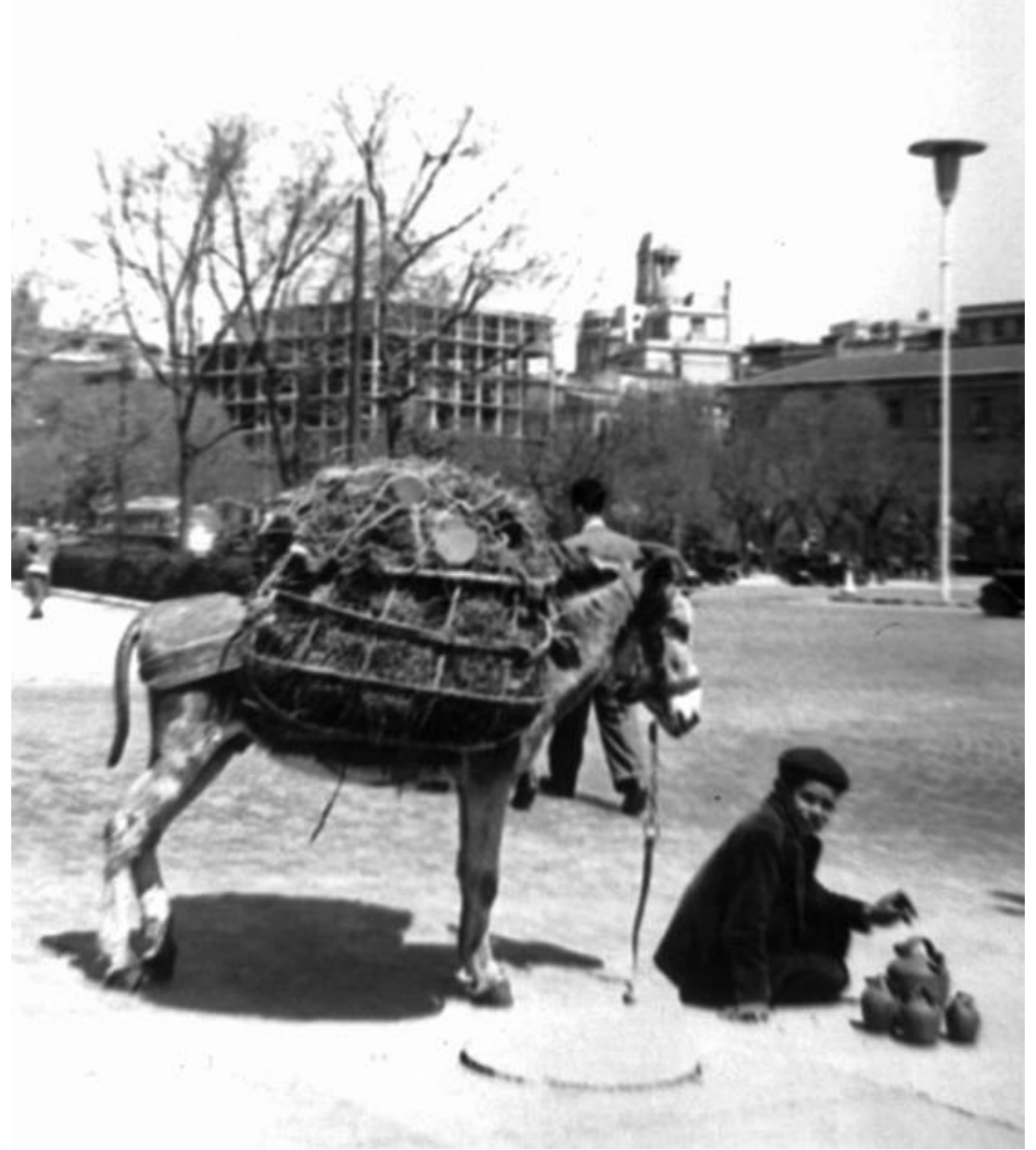
1954. VENDEDOR DE BOTIJOS.