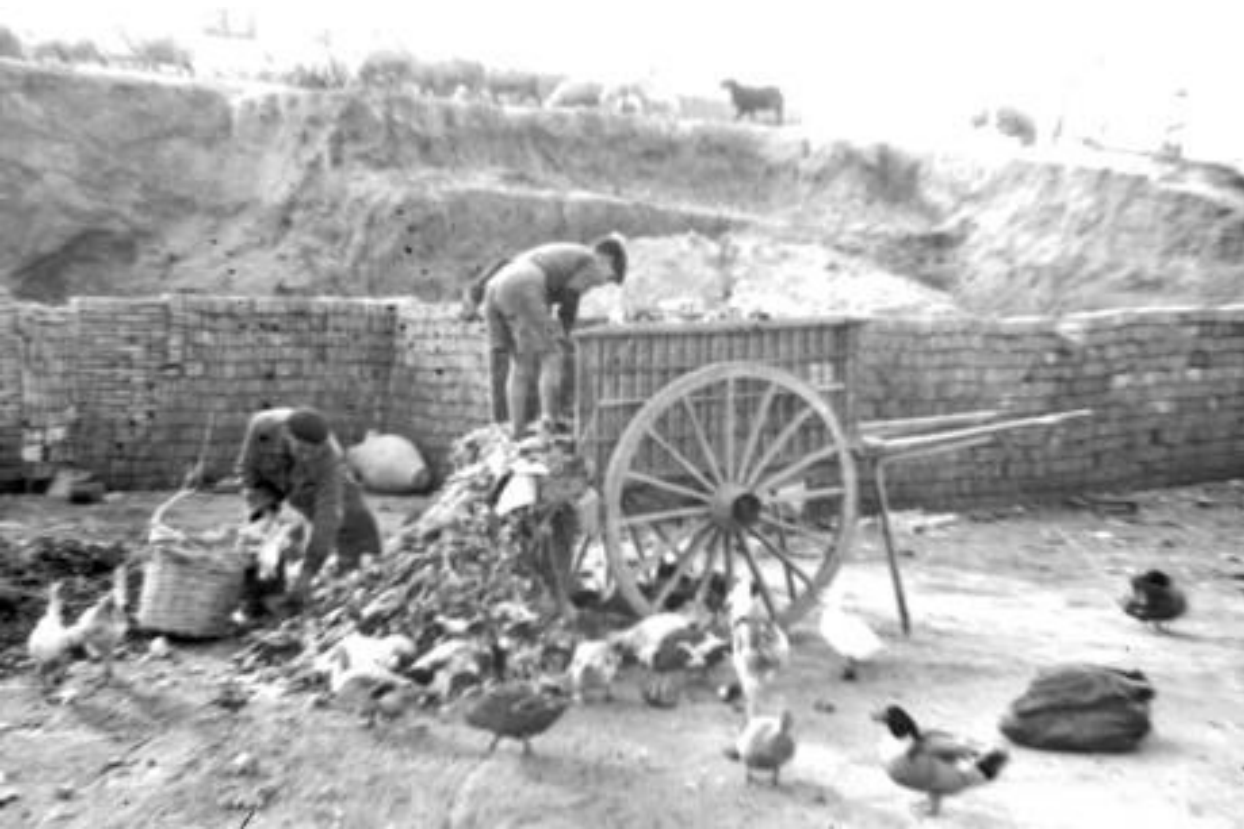
1951. EL TRAPERO Y SU HIJO CLASIFICANDO LA BASURA.