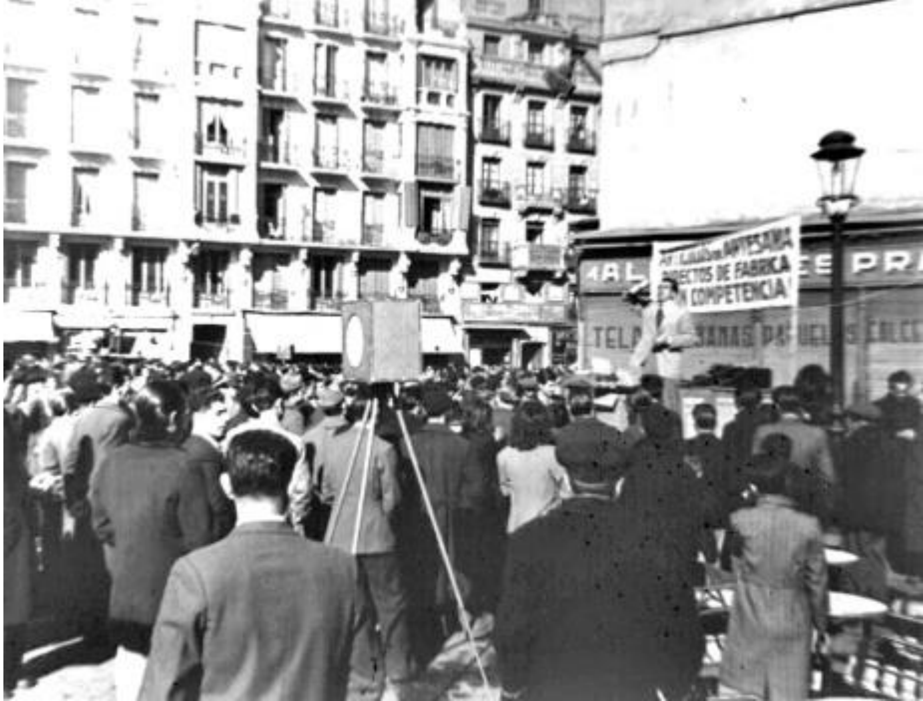
1946. CHARLATÁN CALLEJERO.