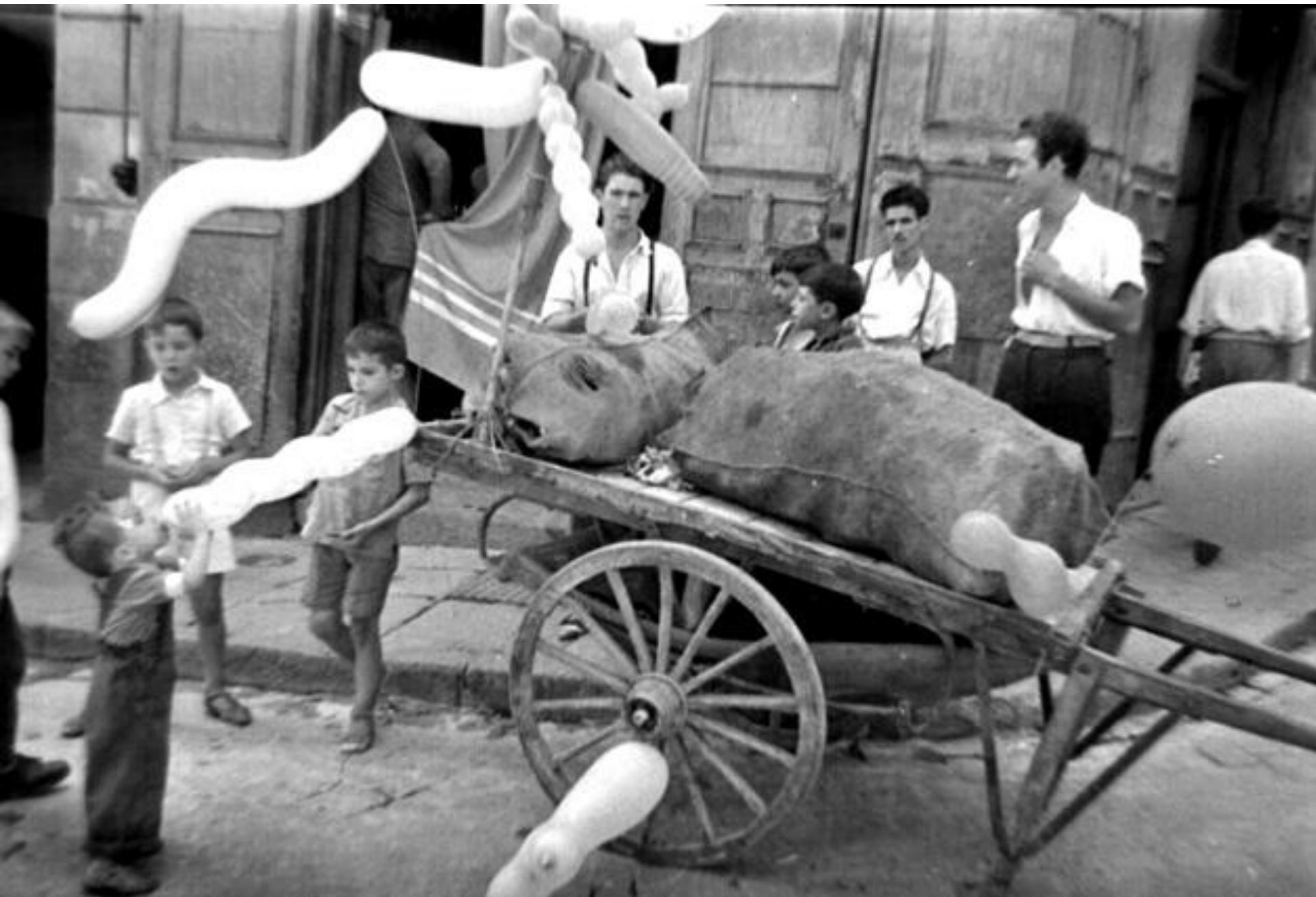
1955. CARRITO QUE CAMBIA GLOBOS POR BOTELLAS.