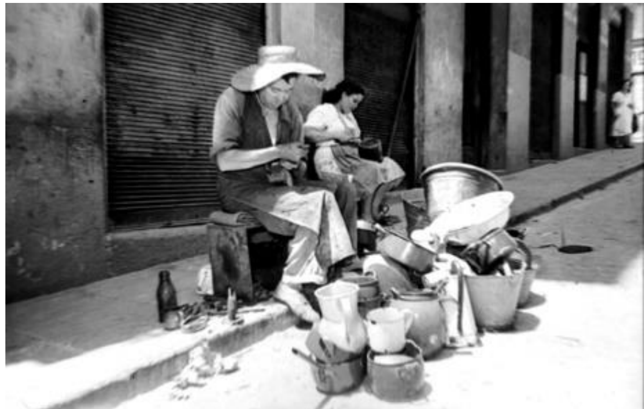
1952. LAÑADOR ESTABLECIDO EN LA CALLE.

El lañador es un artesano, generalmente ambulante, que repara pucheros y otros utensilios de loza o porcelana por medio de lañas y grapas.