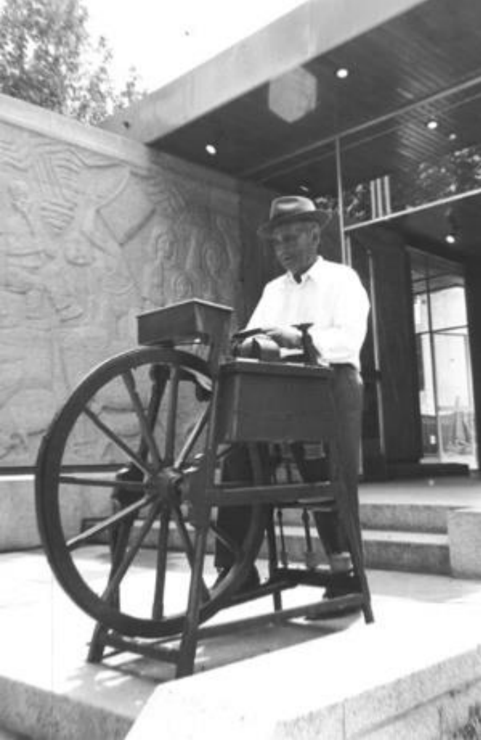
1970. UN AFILADOR, EN EL PABELLÓN DE ORENSE, EN LA FERIA DEL CAMPO.

El afilador o amolador es un comerciante ambulante, que ofrece sus servicios de afilar cuchillos, tijeras, navajas y otros instrumentos de corte.