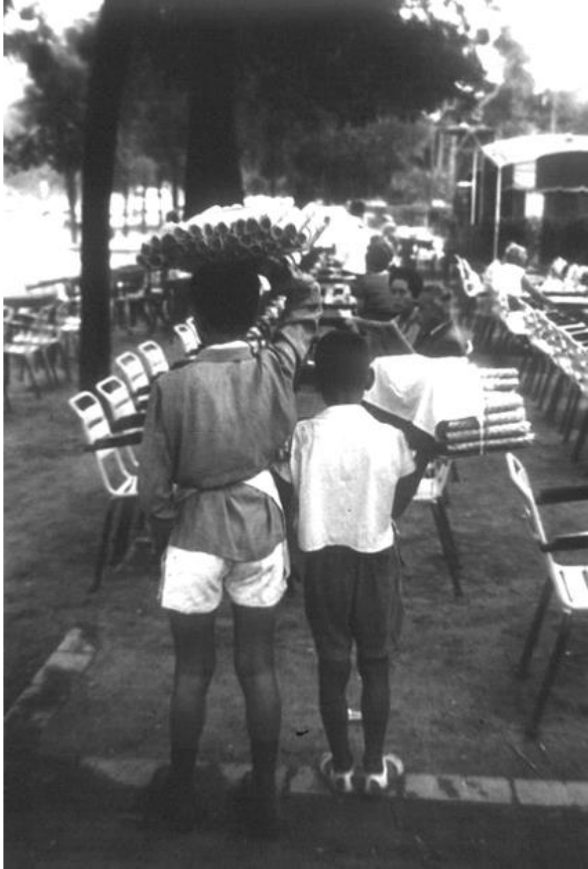
1961. NIÑOS VENDIENDO BARQUILLOS.