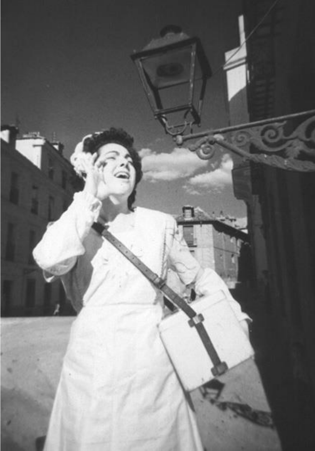
1948. VENDEDORA AMBULANTE DE BOMBÓN HELADO.