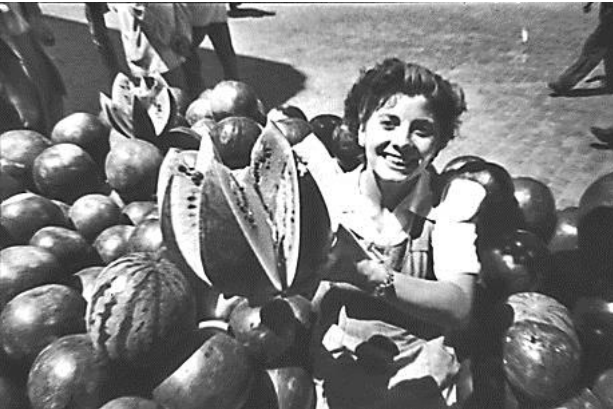
1951. VENDEDORA DE SANDÍAS.