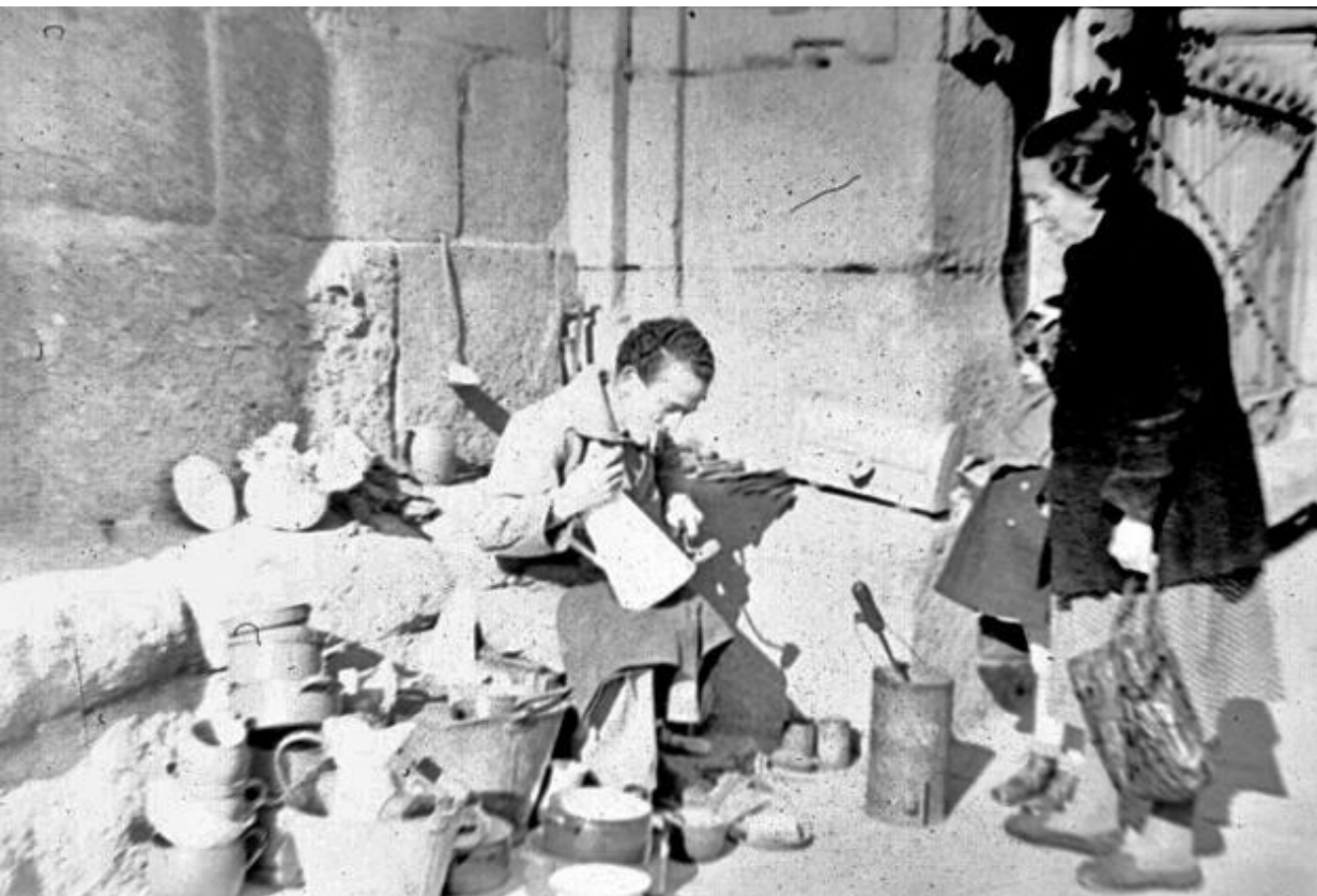
1945. LAÑADOR EN LA CALLE RODEADO DE CACHARROS.