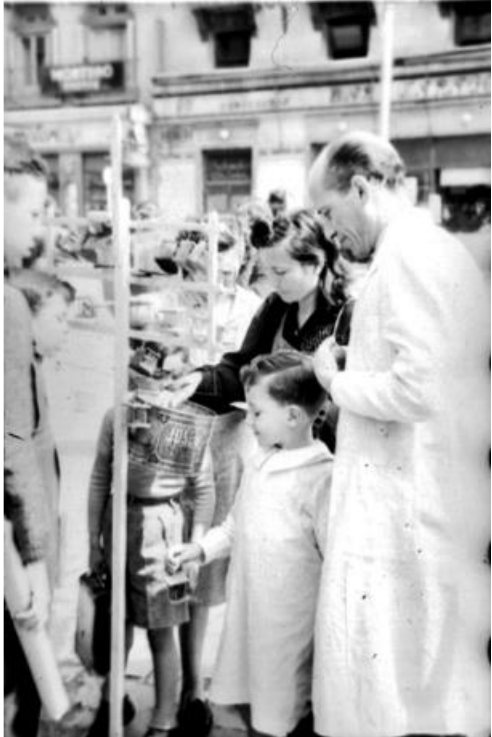
1944. VENDEDOR DE GRILLOS.