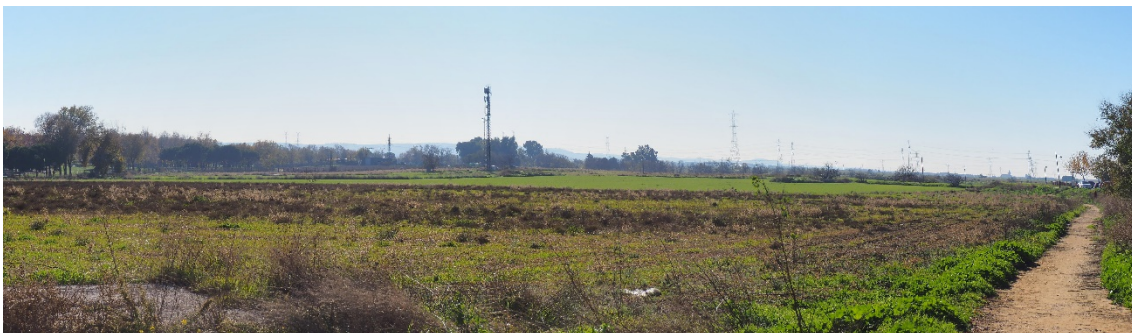
Foto 14. Zona de llegada al tramo subterráneo, con el parque a la izquierda