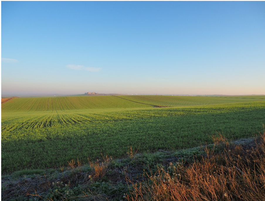
Foto 3. Desde el mismo punto, vista hacia el norte, por donde discurre el trazado, con Yuncillos al fondo.