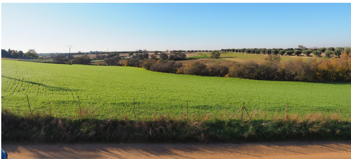
Foto 8. Entre el V-13 (apoyo 47) y V-14 (apoyo 49), en Illescas, vista hacia el sur con el mosaico de cultivos, cauces con vegetación de ribera y olivares