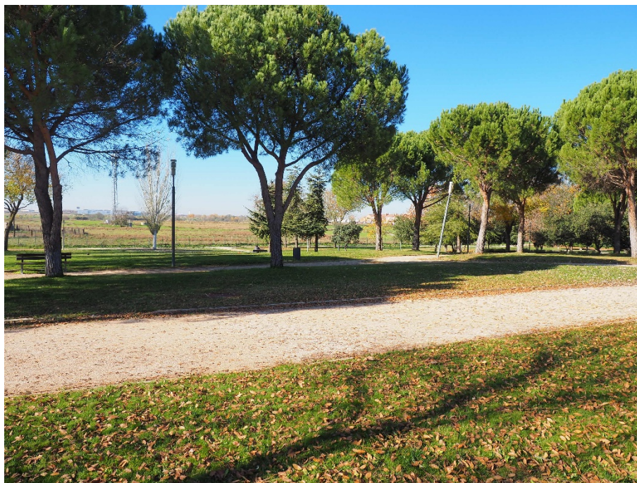
Foto 15. Zona de cruce del tramo soterrado por el parque