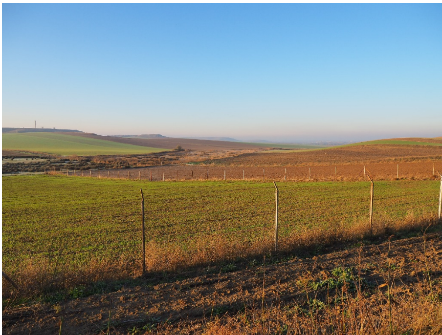
Foto 4. Desde el V-06 (apoyo 11) hacia el sur, por donde discurre la LAT