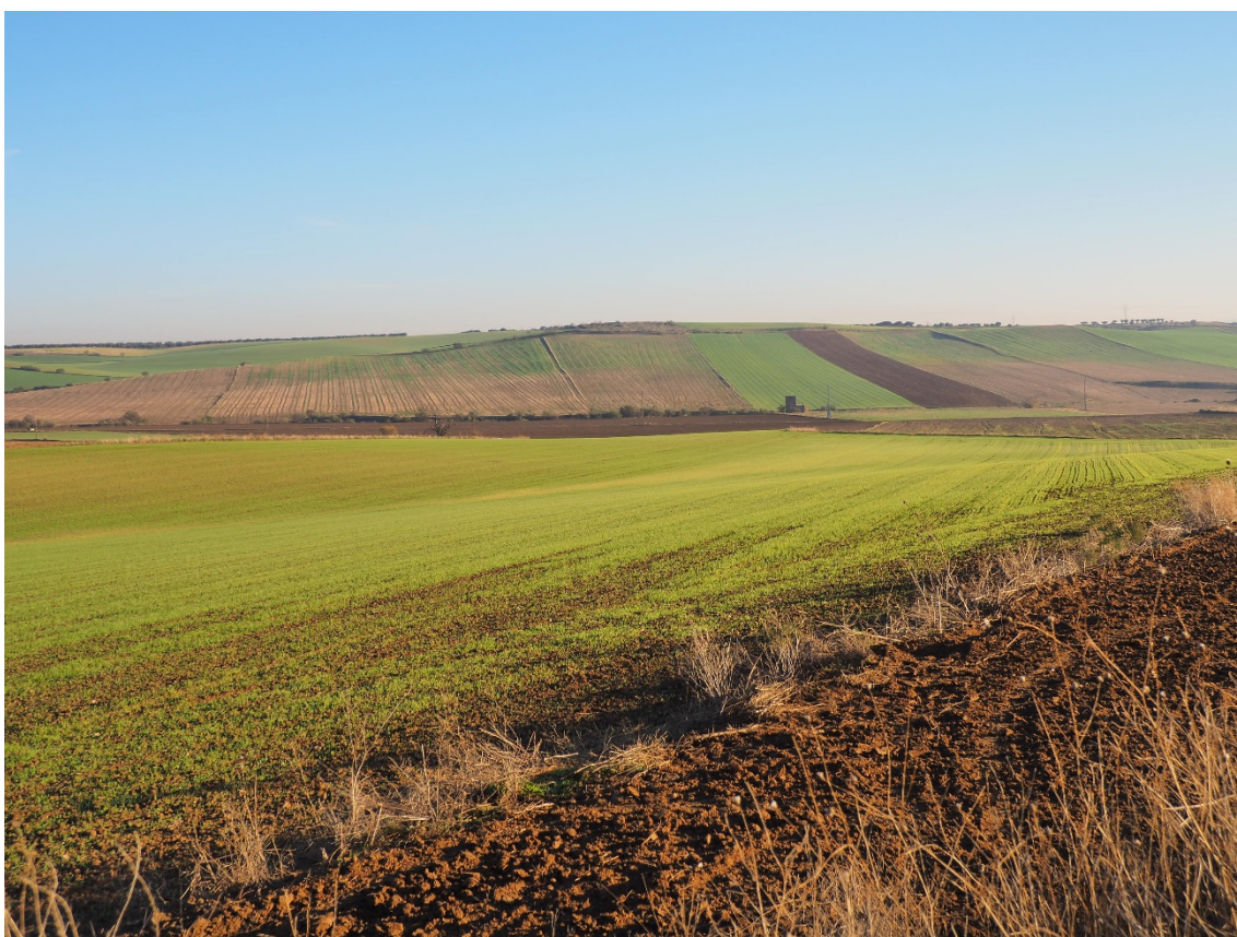
Foto 6. Desde la TO-2324 hacia el norte en dirección al V-09 (apoyo 28)