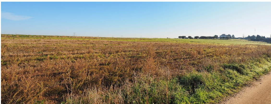
Foto 7. A la altura del V-10 (apoyo 35) en dirección norte, en Cedillo del Condado