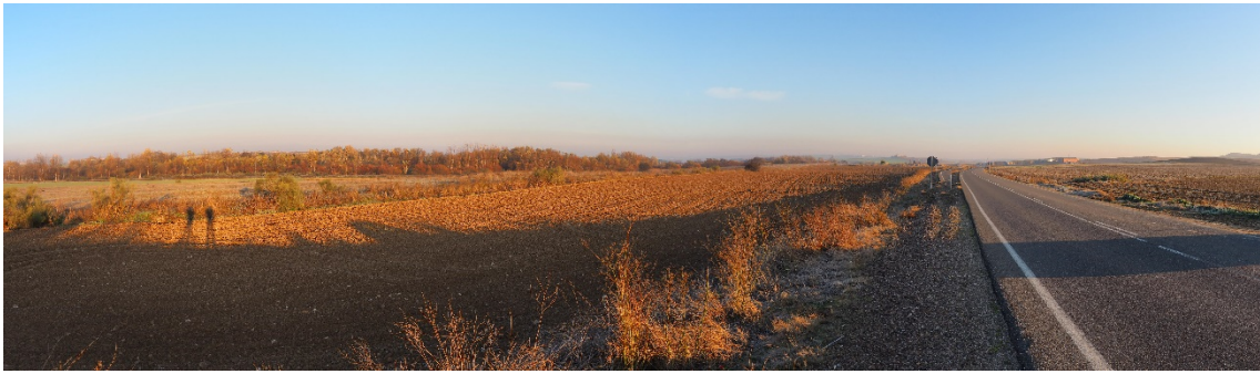
Foto1. Zona de inicio de la LAT junto a la SET Berrocales