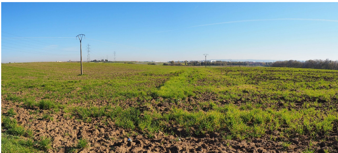
Foto 10. Entre el V-18 (apoyo 64) y V-19 (apoyo 66), en la zona de paralelismo con la LAT existente. Al fondo la zona de la A-42