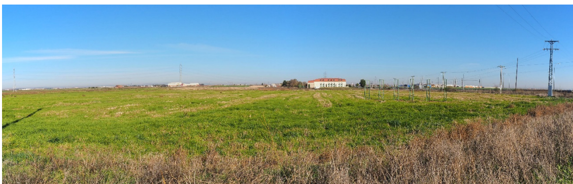
Foto 11. Zona de cruce de la A-42 entre el V-20 (apoyo 67) y V-21 (apoyo 68)