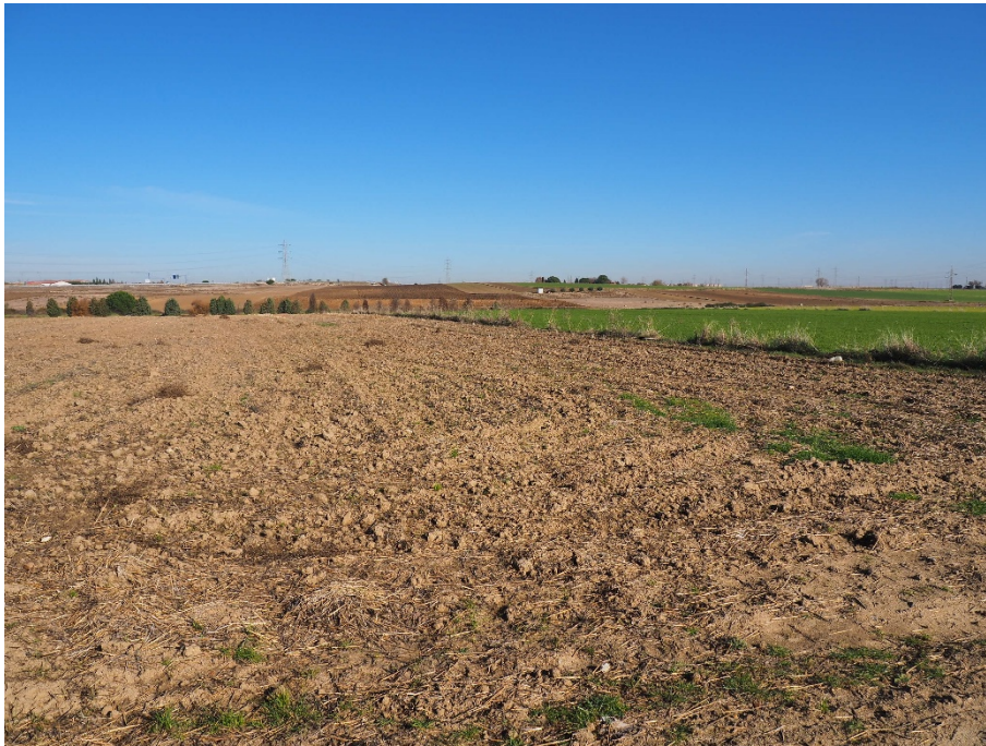
Foto 13. Zona final de trazado entre el V-22 (apoyo 69) y V-23 (apoyo 70) con Parla al fondo