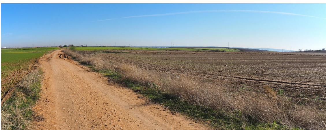
Foto 12. Junto al V-21 (apoyo 68) en la zona de la IBA de Torrejón de Velasco. Foto hacia el este