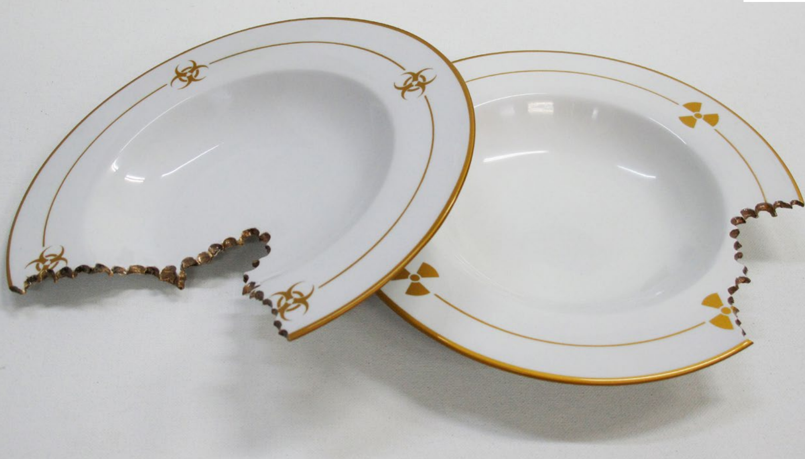
Utensilios del Homo Sostenibilis, 2012. Bronce lacado.