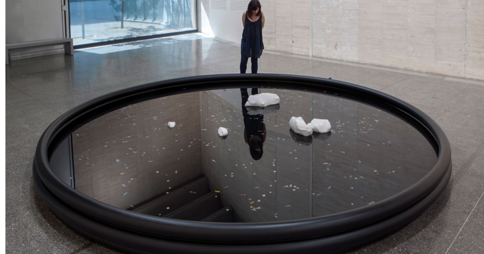
Fosa , 2016. Piscina de PVC y esculturas contenedor de residuos plásticos lacadas.

Desde la consciencia de un momento histórico con muchos cambios por vivir, con un sistema productivo profundamente afectado por la transformación energética y tecnológica, la exposición apela a la reflexión personal sobre las responsabilidades y las posibilidades de afrontar un nuevo régimen climático.