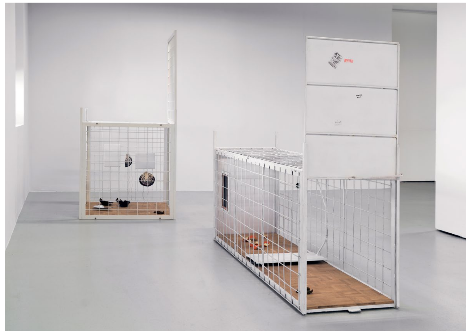
Trampa I y Trampa II . Pertenecientes a la serie Habitats , 2015. Jaulas de hierro lacado al horno, madera de roble, lienzos, objetos fundidos en bronce y pintados al óleo. Colección privada JNSL ( Trampa I ).

Trampa del bienestar (2021) consiste en una nasa de pesca a escala humana, donde las estructuras metálicas son puertas de acceso con formas que recorren la historia del vano arquitectónico, desde el cuadrado al círculo pasando por el arco de medio punto. Con solo un embudo de no retorno, el espacio interior se convierte en un lugar-contenedor simultáneamente hábitat, señuelo y trampa.