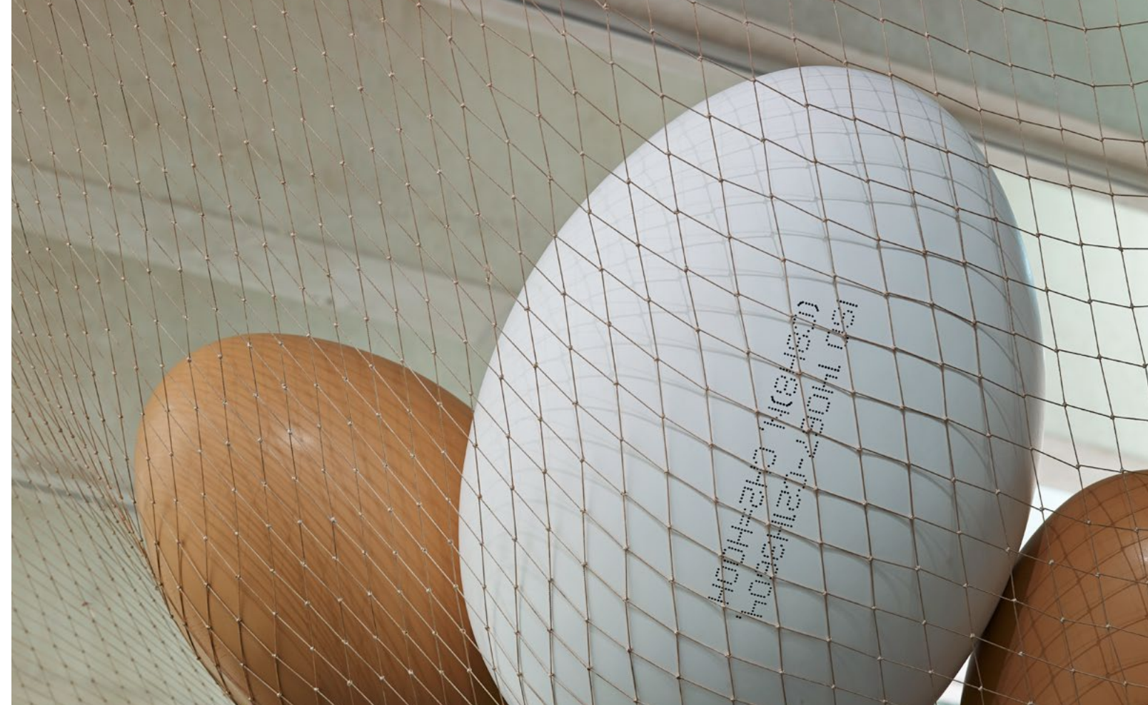
Huevos de basura III , 2016 (detalle). Resina acrílica pintada, relleno de envoltorios plásticos.

Los procesos artísticos de Bene Bergado parten siempre de su contexto cercano y de las experiencias personales que se filtran a la obra de un modo involuntario. La artista considera que en sus obras participan tanto materiales físicos como inmateriales. En la elección de materiales tiene en cuenta no solo sus cualidades físicas, también sus resonancias históricas y culturales. Confiada en una relación mágica con los objetos, desde sus primeras obras, mantiene una nutritiva tensión entre la imaginación y la realidad que se traslada a los largos procesos de elaboración de las piezas. Para la artista la forma es contenido y el contenido es forma.