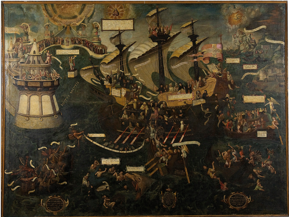
Cuadro “La barca de la salvación”. Está en el estudio de la casa.