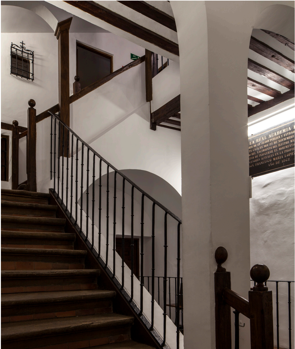
Escalera de la casa a la planta segunda.