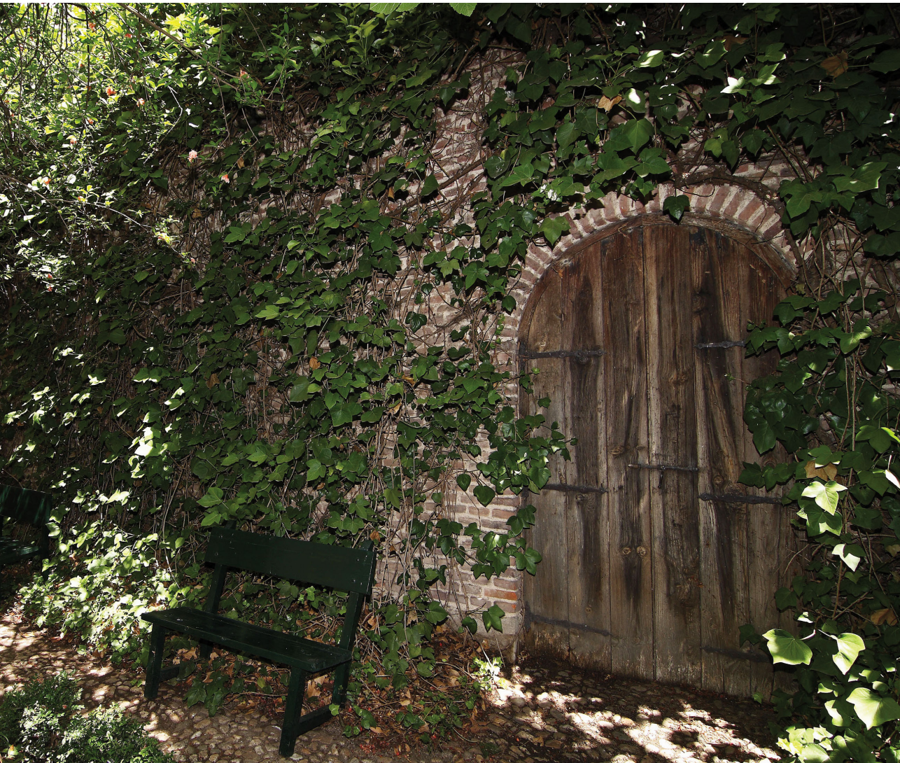
Jardín de la Casa Museo de Lope de Vega