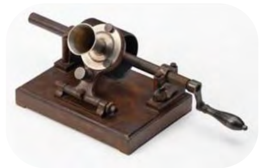
Tinfoil. Ca. 1890

Cuando tenía 30 años, Edison construyó una fábrica de inventos en un pueblo cerca de Nueva York. Esta fábrica tenía los mejores laboratorios para inventar máquinas en aquel momento.