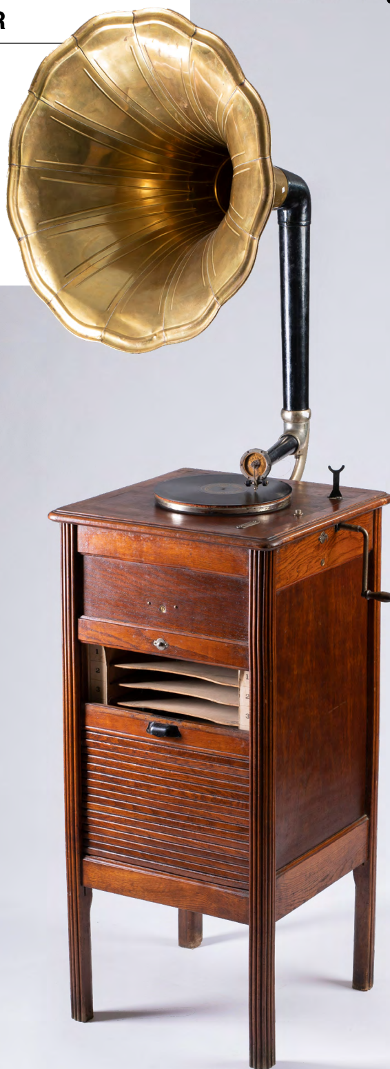
Le Concert Automatique. Francia, Ca. 1910