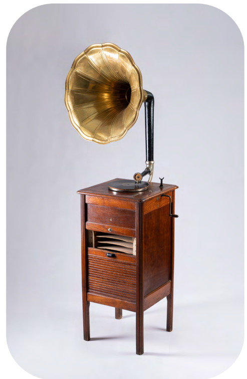
Le Concert Automatique. Francia, Ca. 1910

Este aparato se colocaba en salas de baile. Era tan alto para que todos pudieran escuchar bien el sonido que reproducía. En la parte de delante hay una persiana. En ese lugar, guardaban los discos con las canciones disponibles. Para hacerlo funcionar había que echar una moneda y accionar la manivela con la que se daba cuerda.