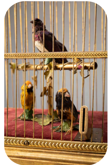
Autómata Jaula de Pájaros. Ca. 1910