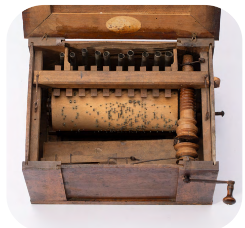
Serinette. Husson-Jacotel. Francia Ca. 1885

Este instrumento musical se llama serinette . → Tiene una manivela para que funcione.