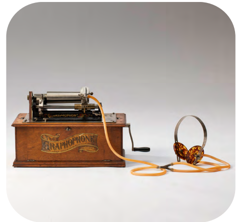
Bell Graphophone. Ca. 1897

Los hermanos Bell y Tainter desarrollaron una máquina con una aguja flotante y un cilindro de cera. Esta máquina se llamó grafófono → y era muy barata y tenía buena calidad de sonido.