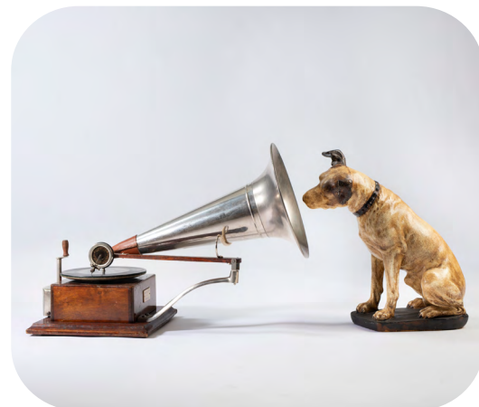
Gramófono Berliner y Nipper. Ca. 1897