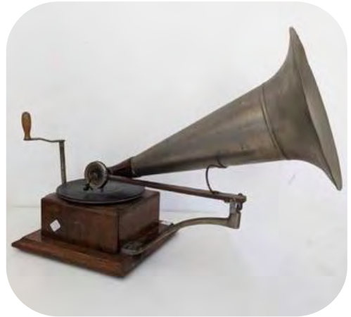
Gramófono Berliner. Ca. 1897

Durante años, los grafófonos y los gramófonos compitieron en el mercado. Edison creó su propio reproductor de música con otro tipo de aguja pero era muy caro.