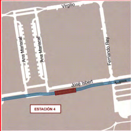
Ciudad de la imagen / Calle José Isbert -Kinépolis- (Pozuelo de Alarcón)