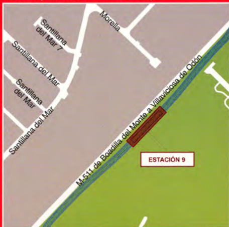
Carretera Villaviciosa de Odón / Recinto Ferial (Boadilla del Monte)