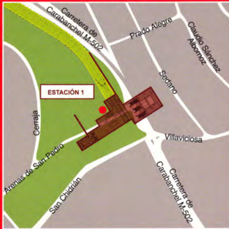
Colonia Jardín - Línea 10 y Metro Ligeró a Pozuelo de Alarcón