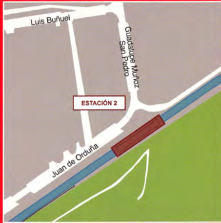
Ciudad de la Imagen / Calle de Juan de Orduña (Pozuelo de Alarcón)