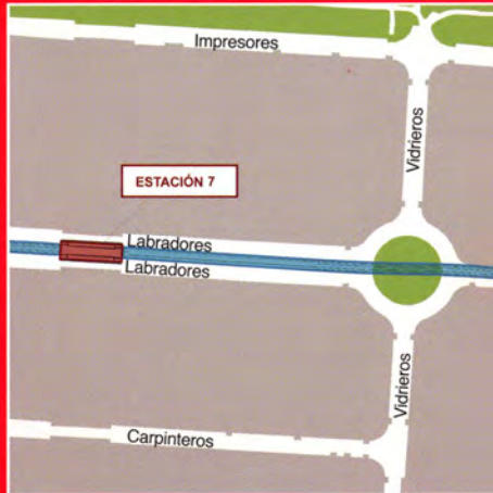
Polígono Prado del Espino/ Calle Labradores (Boadilla del Monte)