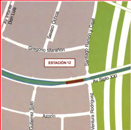
Av del Siglo XXI (Boadilla del Monte)