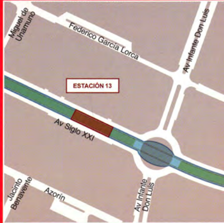
Av del Siglo XXI / Av Infante Don Luis (Boadilla del Monte)