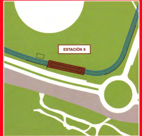
Ciudad financiera BSCH / Instalaciones de la ONCE (Boadilla del Monte)