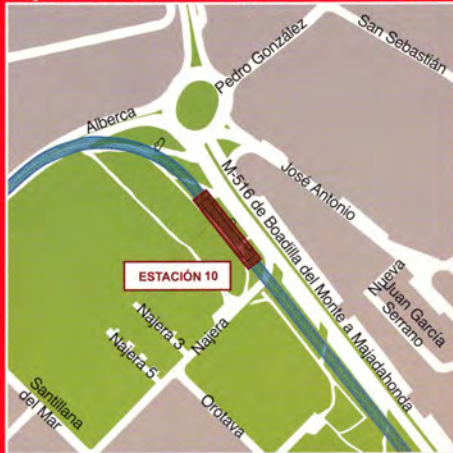
Carretera de Boadilla del Monte - Majadahonda / Esquina calle Alberca - Ayuntamiento - (Boadilla del Monte)