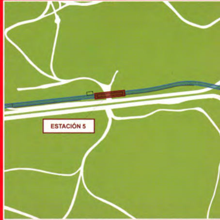
Carretera M-511 -zona cuarteles- (Pozuelo de Alarcón)