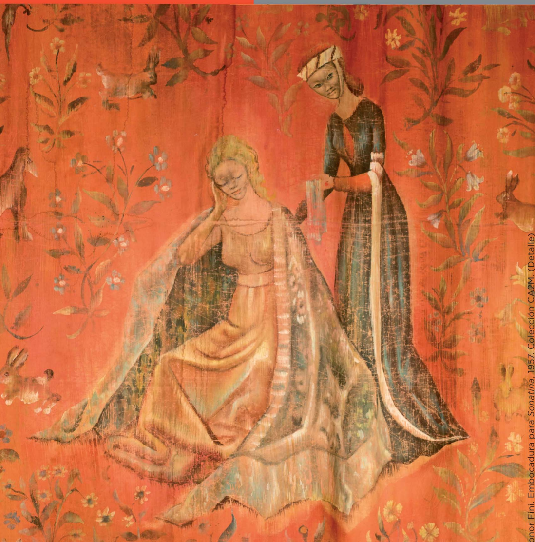
onor Fini. Embocadura para Sonatina, 1957. Colección CA2M. (Detalle)

CULTURA COMUNIDAD DE MADRID #expo_Lationoamérica