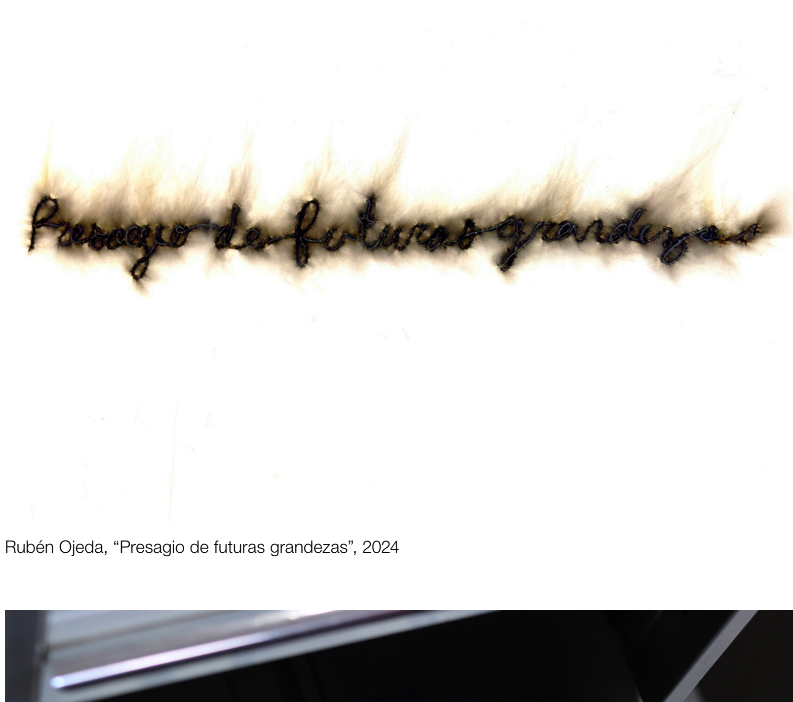
Rubén Ojeda, "Presagio de futuras grandezas", 2024