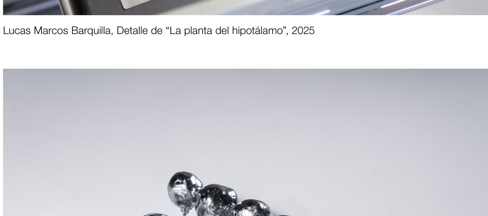
Julieta Hsiung, Detalle de "Moonskin", 2024