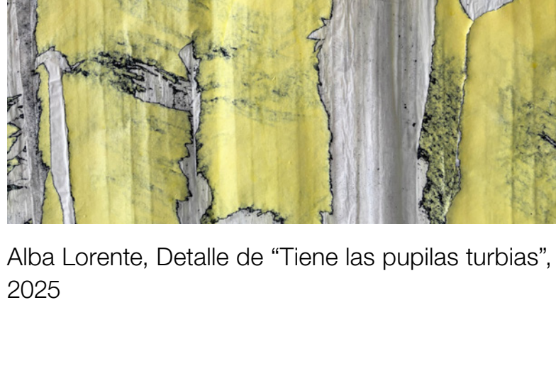
Alba Lorente, Detalle de "Tiene las pupilas turbias", 2025

Pensemos con ellos las prácticas artísticas actuales como un hacer cíclico. Estas obras se han hecho ahora. Se están haciendo incluso. Incluso se están volviendo a hacer, porque las prácticas artísticas van mucho de eso: suponen siempre una relación inestable de dependencia con otros cuerpos, materiales, voces, documentos. Igual que las palabras, el lenguaje artístico es algo común, cargado de historias, que nos llega lleno de experiencias. Volvemos a hacer todo el rato. Todo el rato volvemos a hacer en diálogo con otras, humanas y no humanas, vivas y muertas.