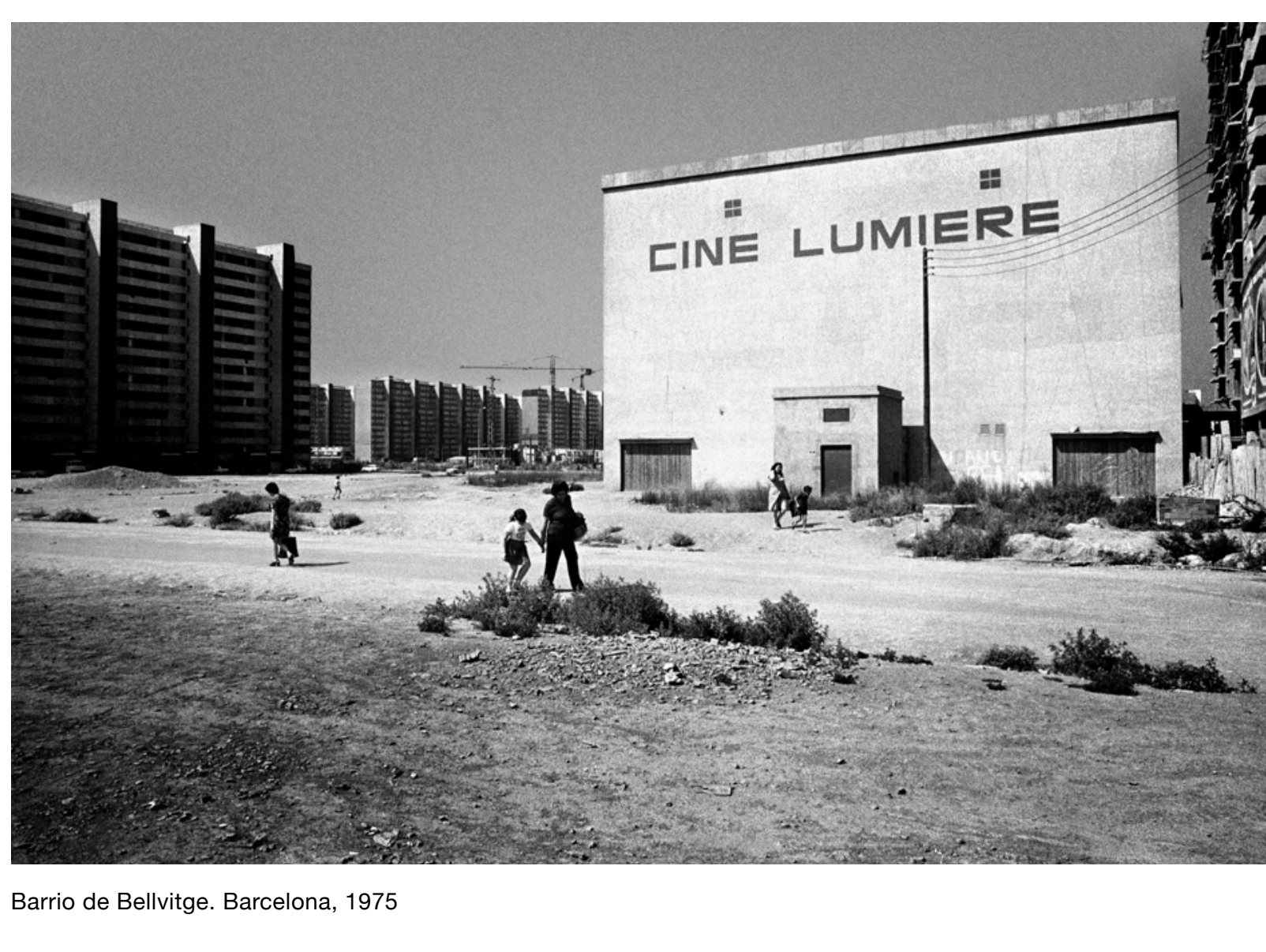
Barrio de Bellvitge. Barcelona, 1975

Es ahí donde reside la magia. En ocasiones, se concentra en buscar un “punto inquietante” donde la escenificación se apropia del rostro. No olvidemos su magistral retrato a Almodóvar en su tributo a Cabeza borradora .