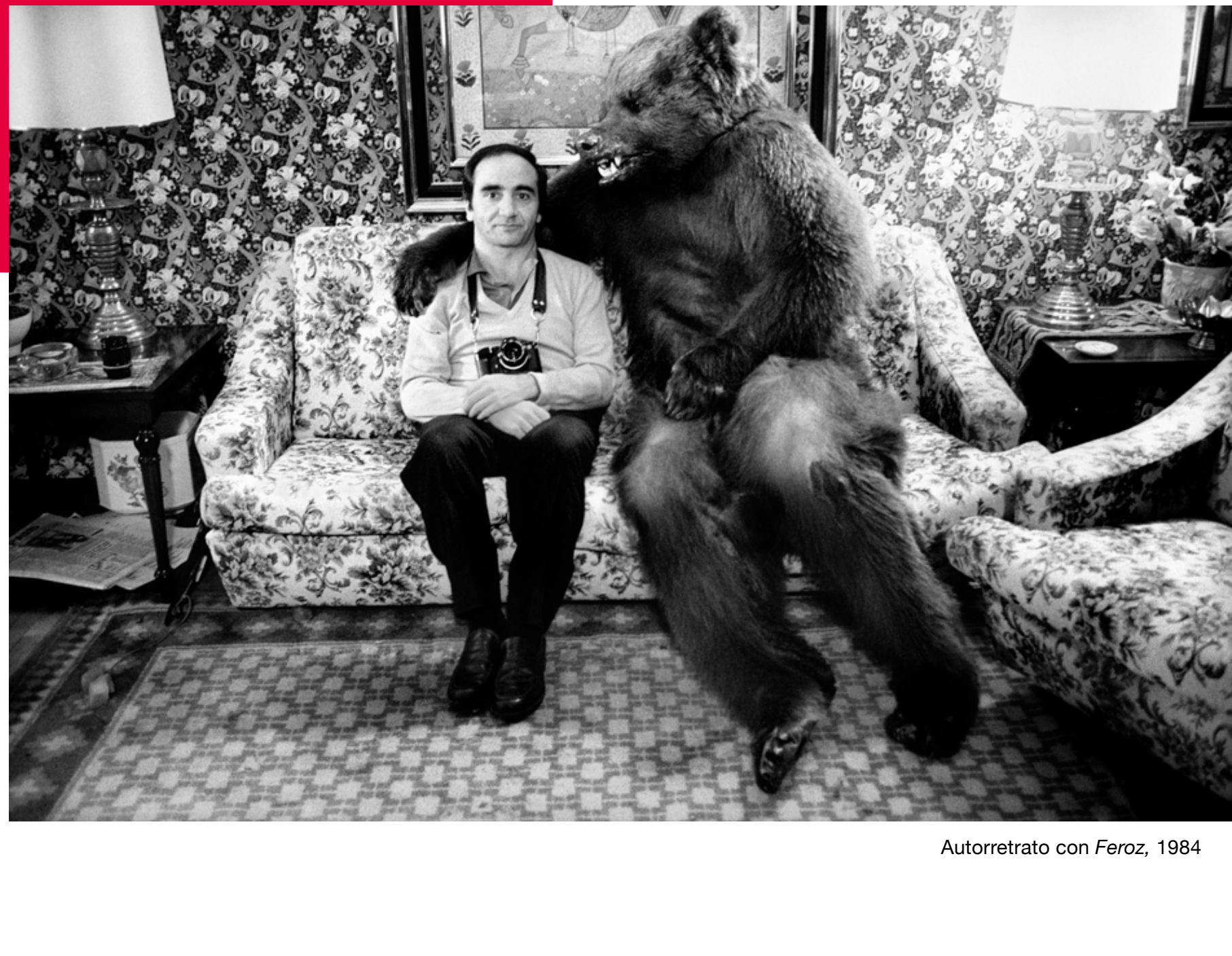
Autorretrato con Feroz, 1984