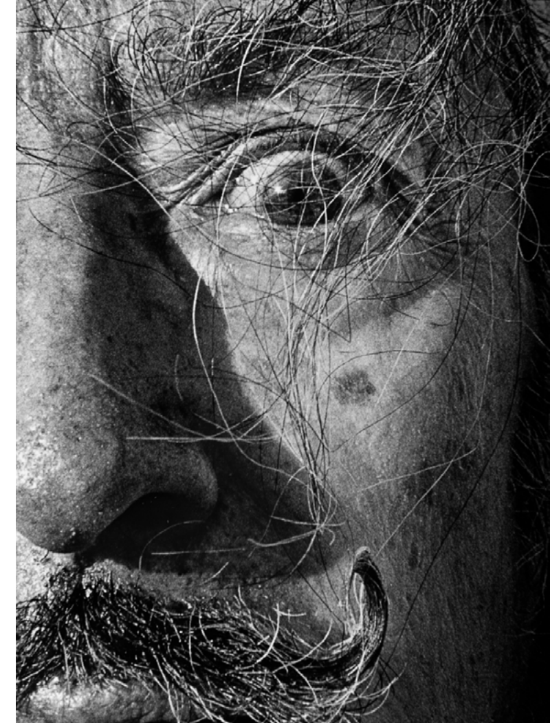
Salvador Dalí, pintor. Portlligat, 1979