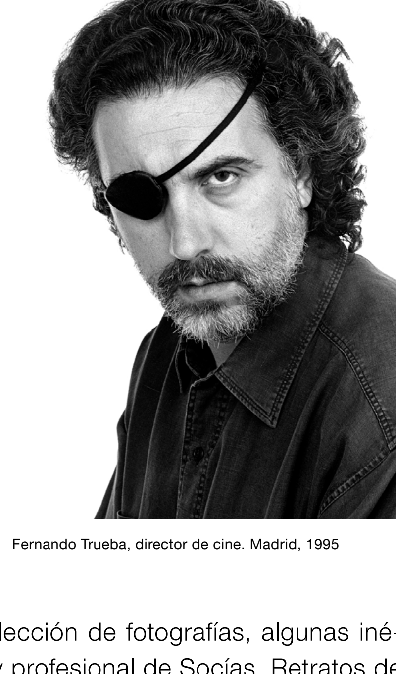
Fernando Trueba, director de cine. Madrid, 1995