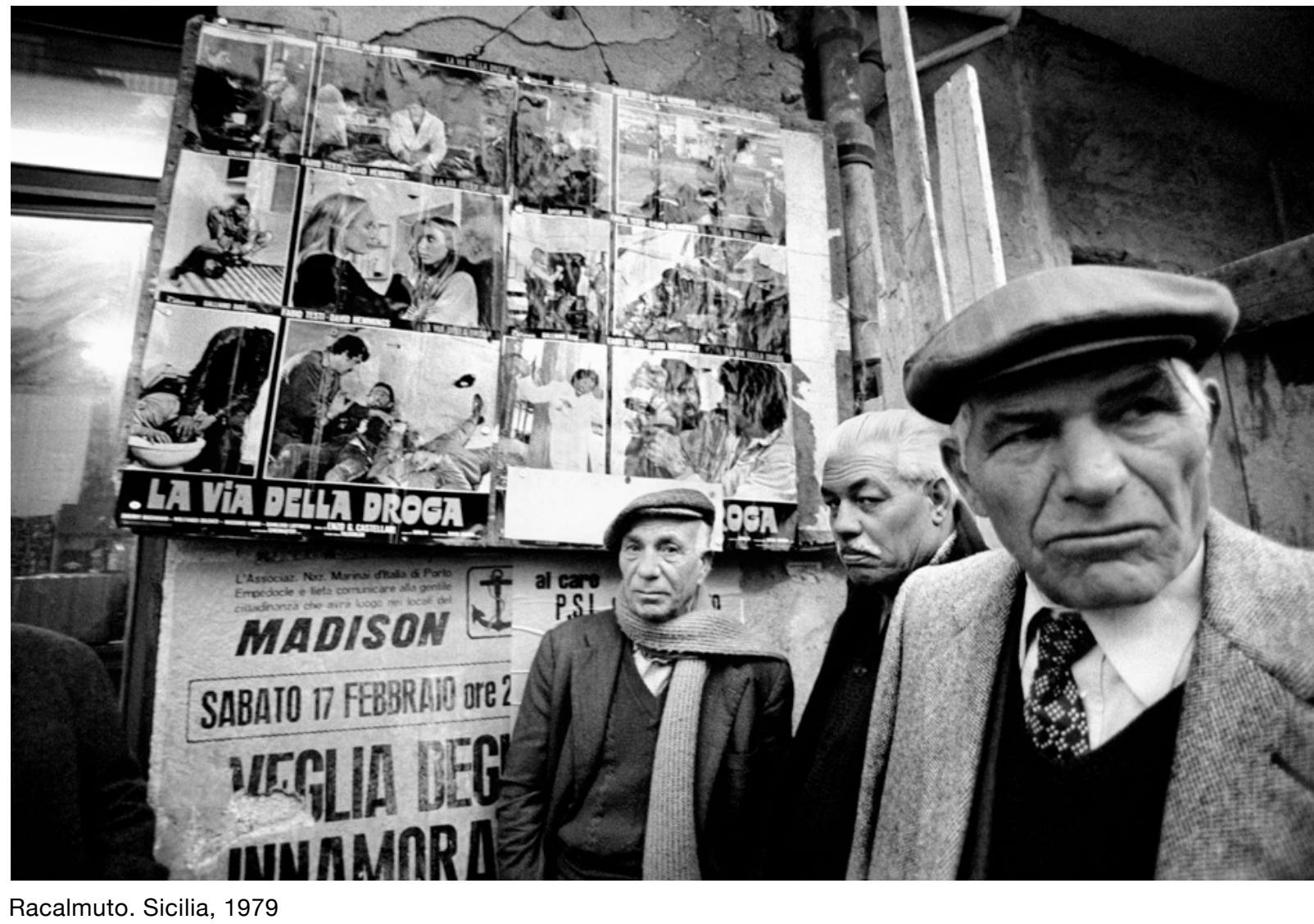
Racalmuto. Sicilia, 1979