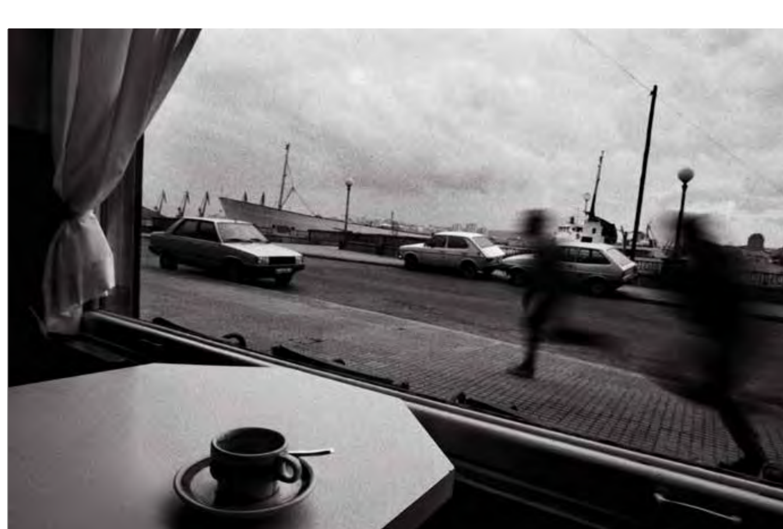
Un «cortao», 1985.

Esta exposición, dedicada al fotógrafo Vari Caramés (Ferrol, 1953), recoge la mayoría de su producción, enfocada a representar el lirismo de lo cotidiano. Una selección de imágenes de diferentes proyectos que comparten unos mismos intereses por parte de Caramés, como son la importancia de lo cotidiano, la búsqueda de la atemporalidad, el despertar de las emociones o el encuentro con lo sorprendente. Unas fotografías emocionales y cercanas que capturan la sencillez de los acontecimientos a través de veladas y sutiles referencias.