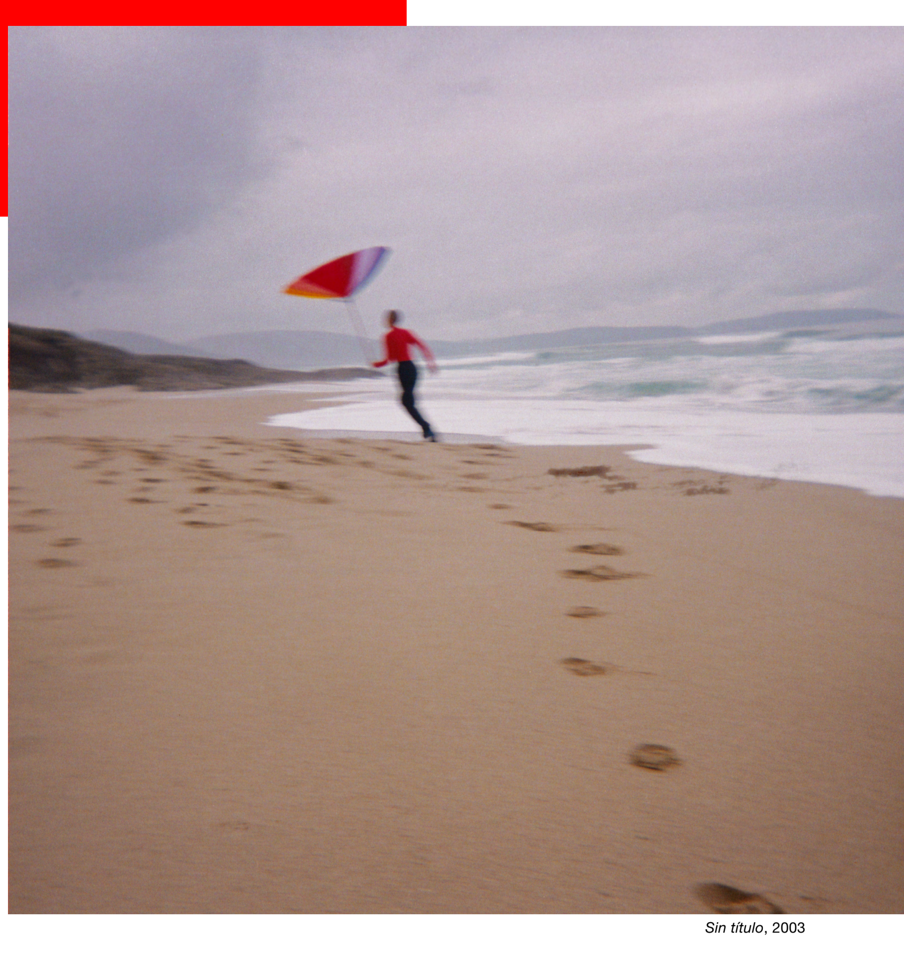
Sin título, 2003