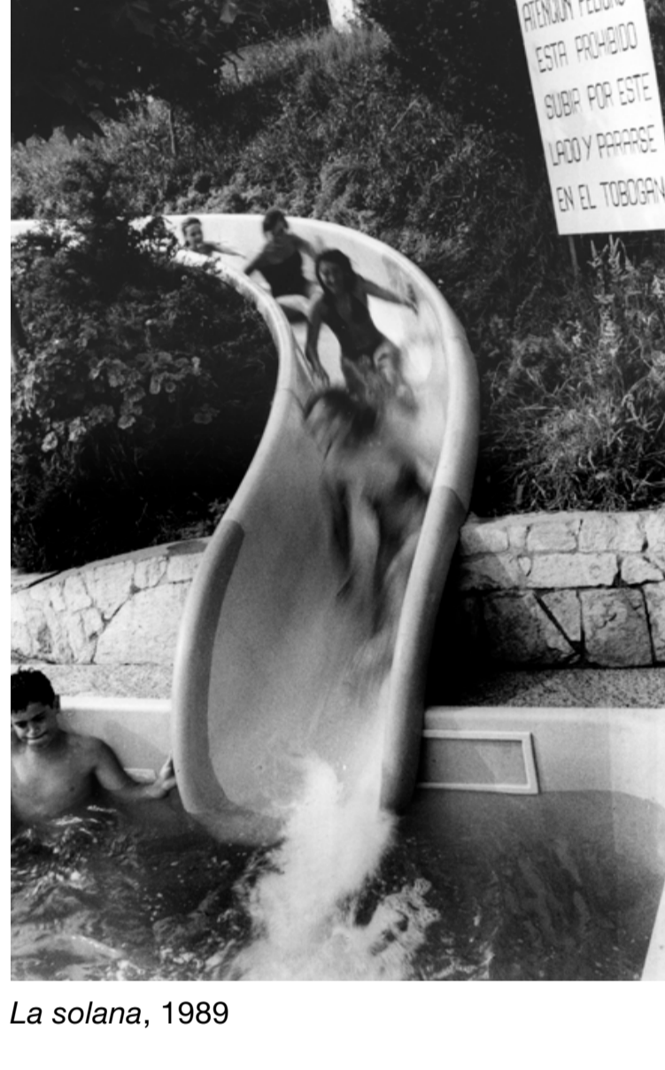
La solana, 1989