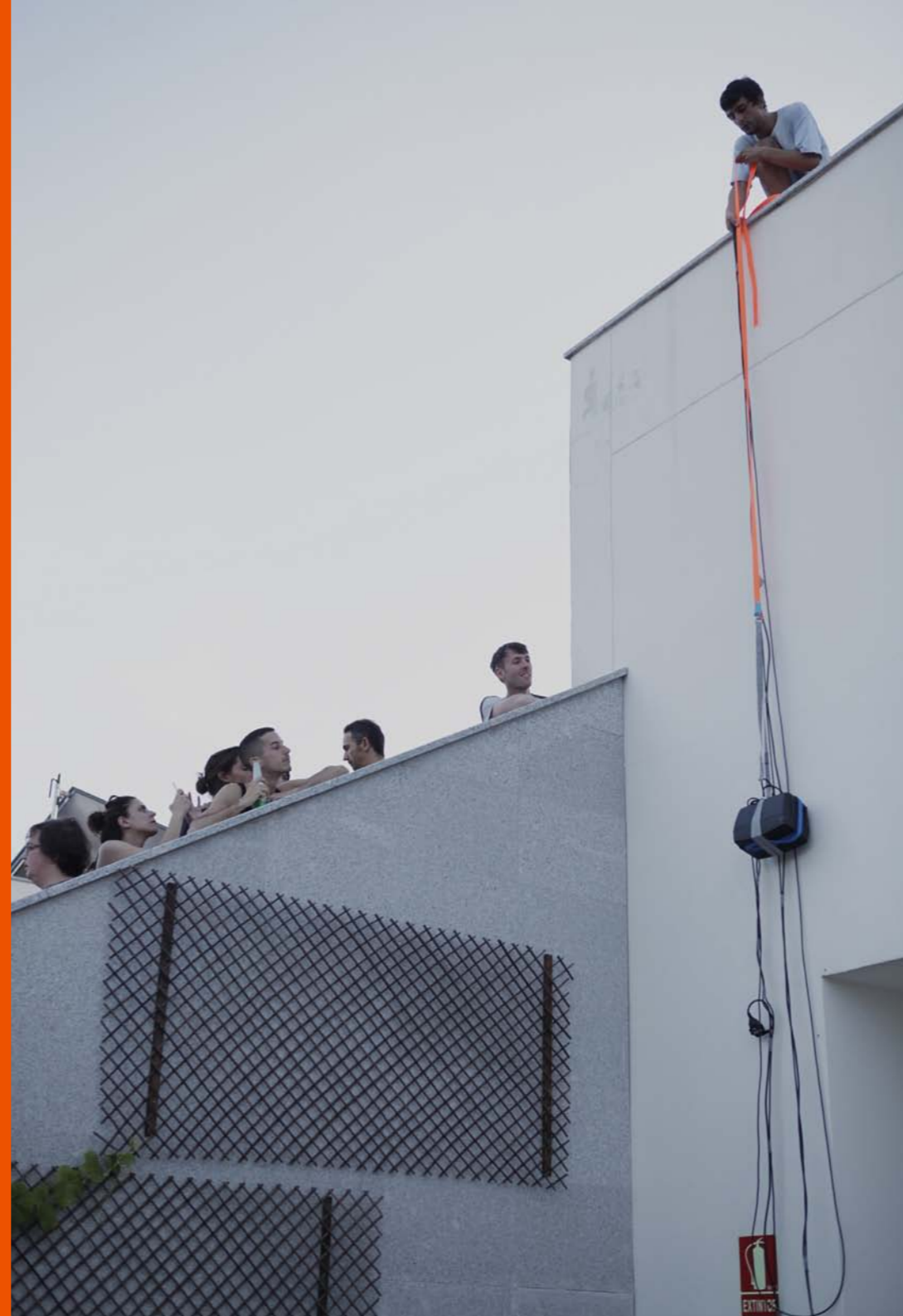
D.L.: M-35101-2016 B.O.C.M.

Centro de Arte Dos de Mayo Comunidad de Madrid