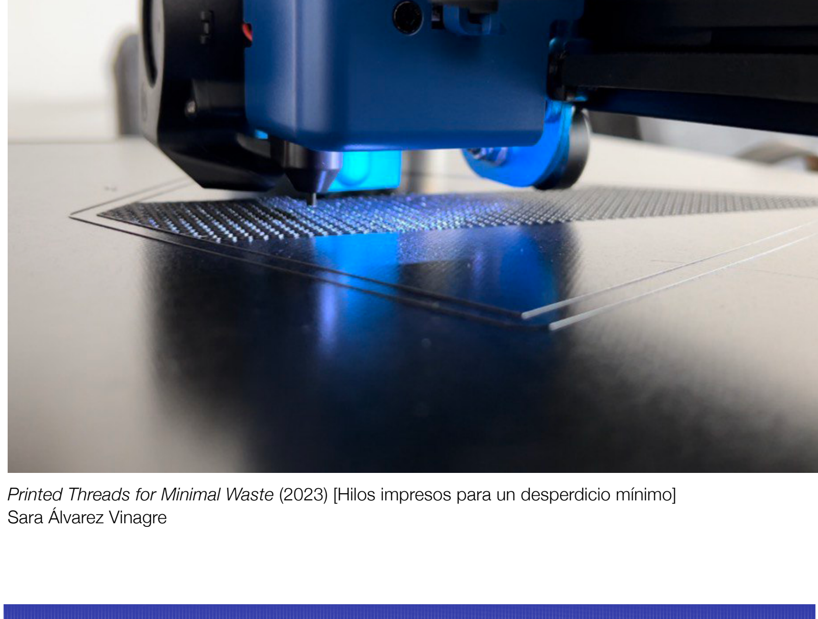
Printed Threads for Minimal Waste (2023) [Hilos impresos para un desperdicio mínimo] Sara Álvarez Vinagre