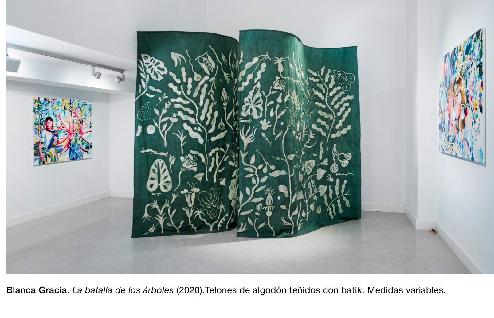
Blanca Gracia. La batalla de los árboles (2020). Telones de algodón teñidos con batik. Medidas variables.

El proyecto surge de la fórmula legislativa Caput gerat lupinum (deja que la suya sea una cabeza de lobo), utilizada en el medievo para designar a aquellos que por haber desobedecido las leyes de la sociedad o cometido algún delito eran condenados a la muerte cívica. Esto significaba que se les equiparaba a los animales y se les llamaba cabeza de lobo . Vivirían expulsados de la sociedad, en la libertad del bosque, expuestos a sus peligros, sin redención ni derechos.