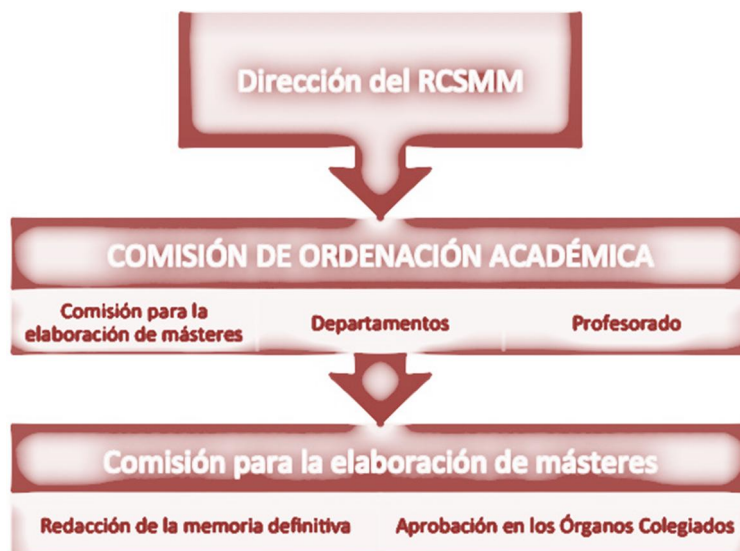
Gráfico 1 Órganos de elaboración y decisión sobre esta petición de máster Fuente Elaboración Real Conservatorio Superior de Música de Madrid

El procedimiento de consulta se resume en las siguientes actuaciones: