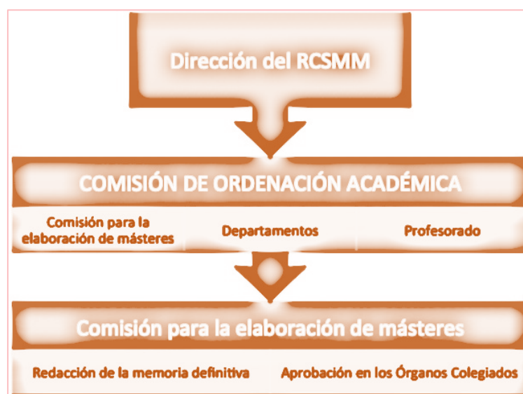
Gráfico 1 Órganos de elaboración y decisión sobre esta petición de máster

El procedimiento de consulta se resume en las siguientes actuaciones: