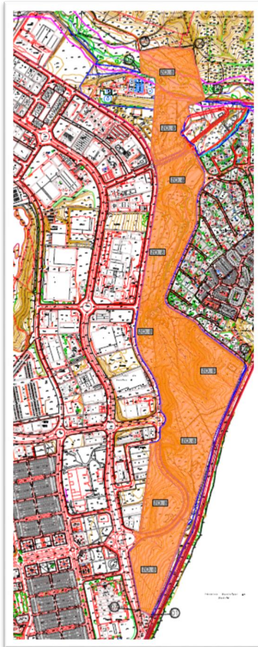
Ámbito del Plan Especial