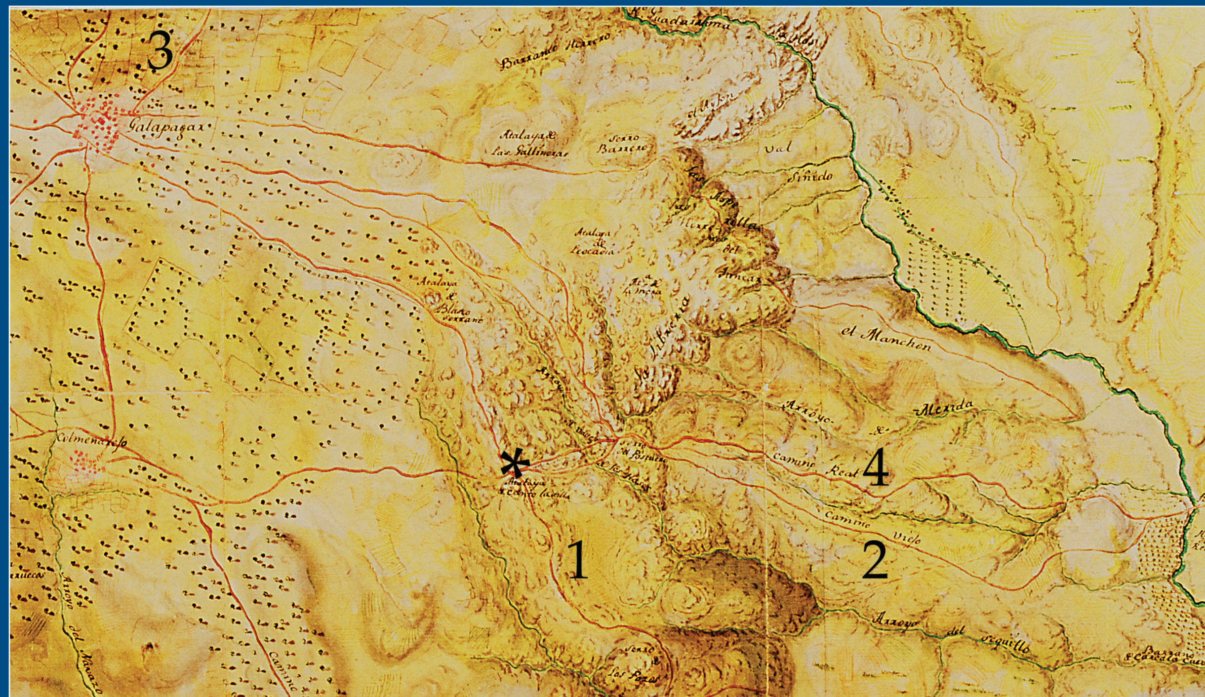
Los caminos de la zona en el Mapa de la Comprensión (1764).