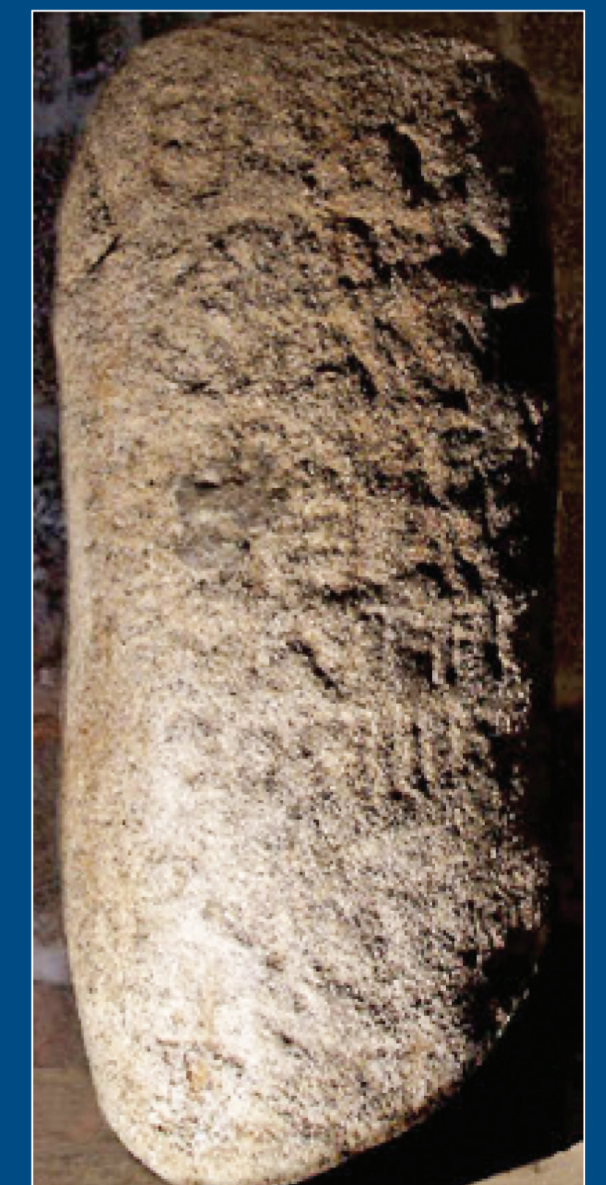
Miliario de Galapagar.