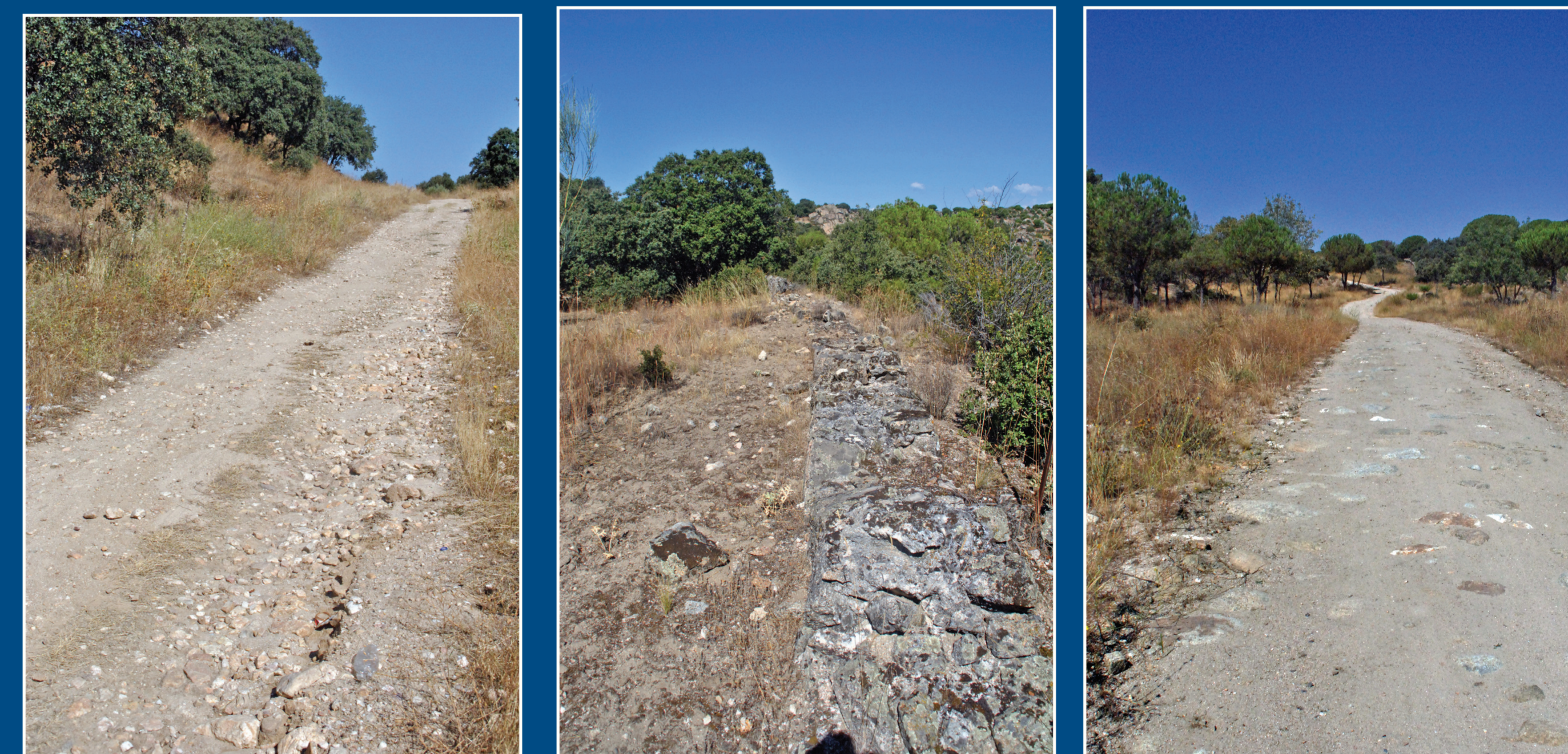
Diversos aspectos del Camino del Paredón.