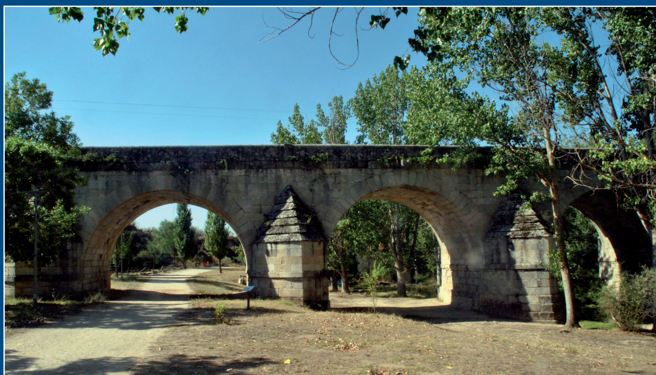
El Puente del Retamar.

Este camino, llamado del Paredón, es el que vamos a seguir hasta el cruce con el camino de Galapagar.