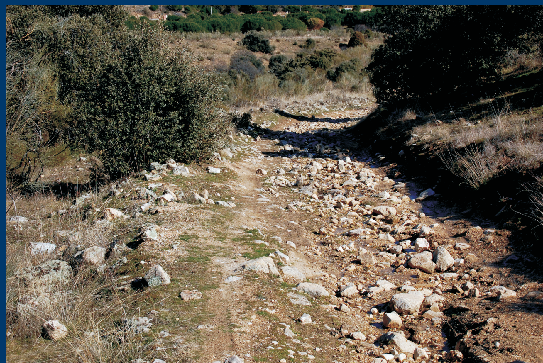
El camino del Pardillo a Colmenarejo

Estamos recorriendo el camino carril de Villanueva del Pardillo a Colmenarejo, uno de los varios caminos antiguos que superan el duro escalón que separa la cuenca sedimentaria del pie de monte de la Sierra del Guadarrama.