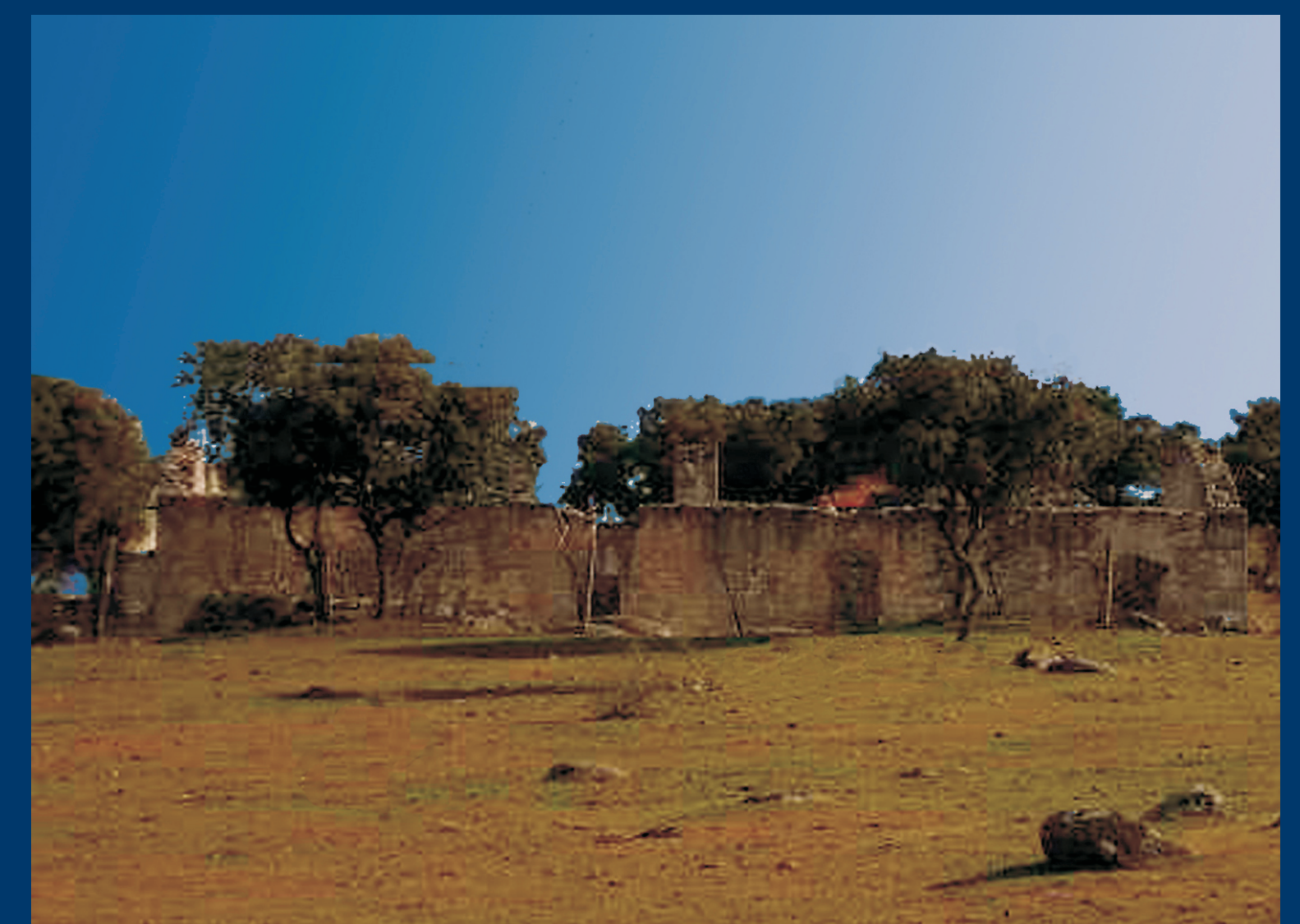
Fundición de la Mina Pilar