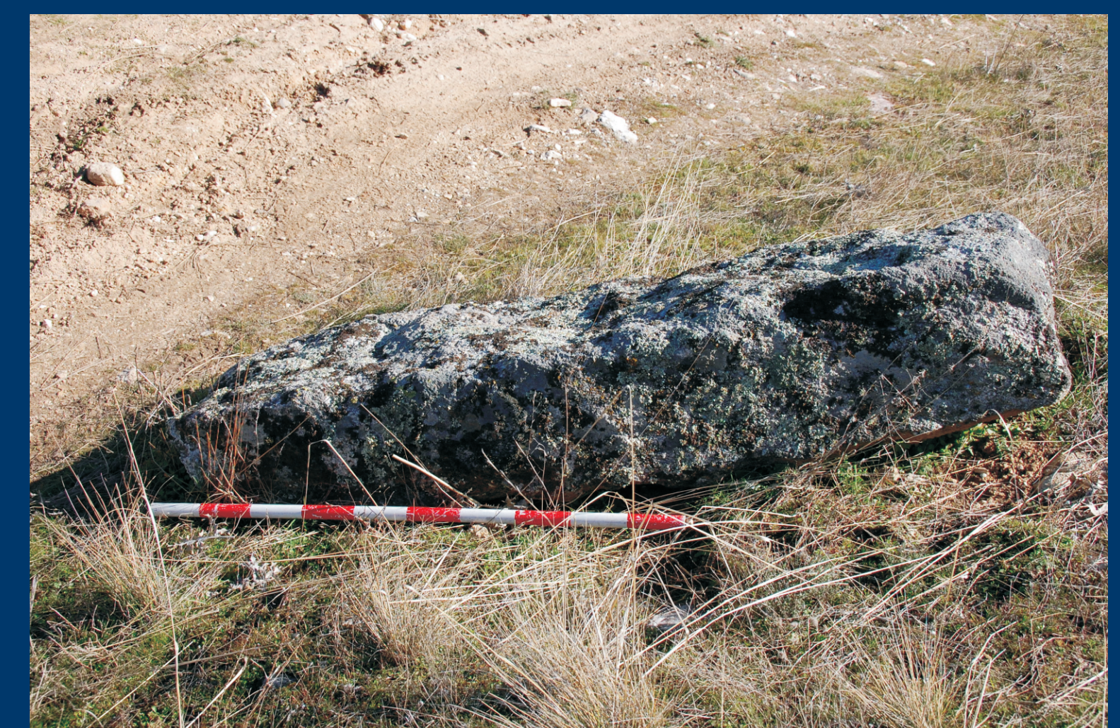
Mojón de término