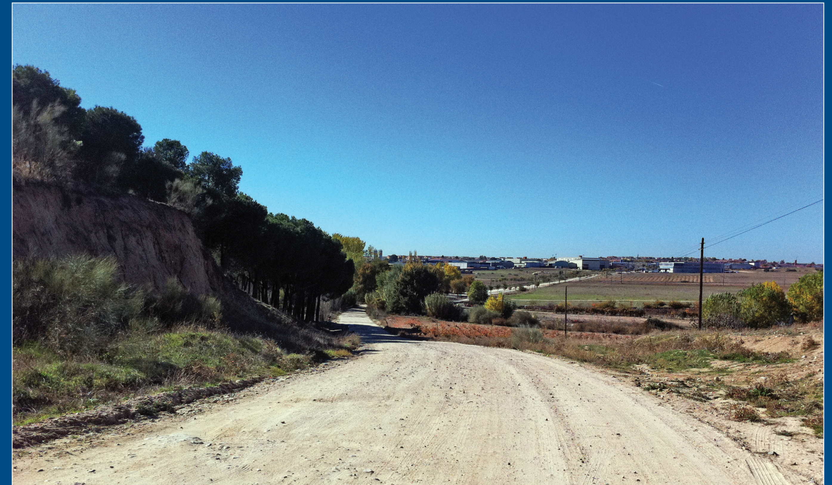
Al fondo El Álamo.

El origen del camino es altomedieval y fue fundamental en la articulación del territorio de la Marca Media islámica, pues unía Talavera con Madrid, y posteriormente en la comunicación de la Corte con Portugal.