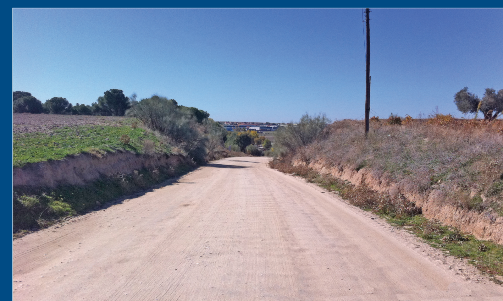
Aspecto actual del camino.