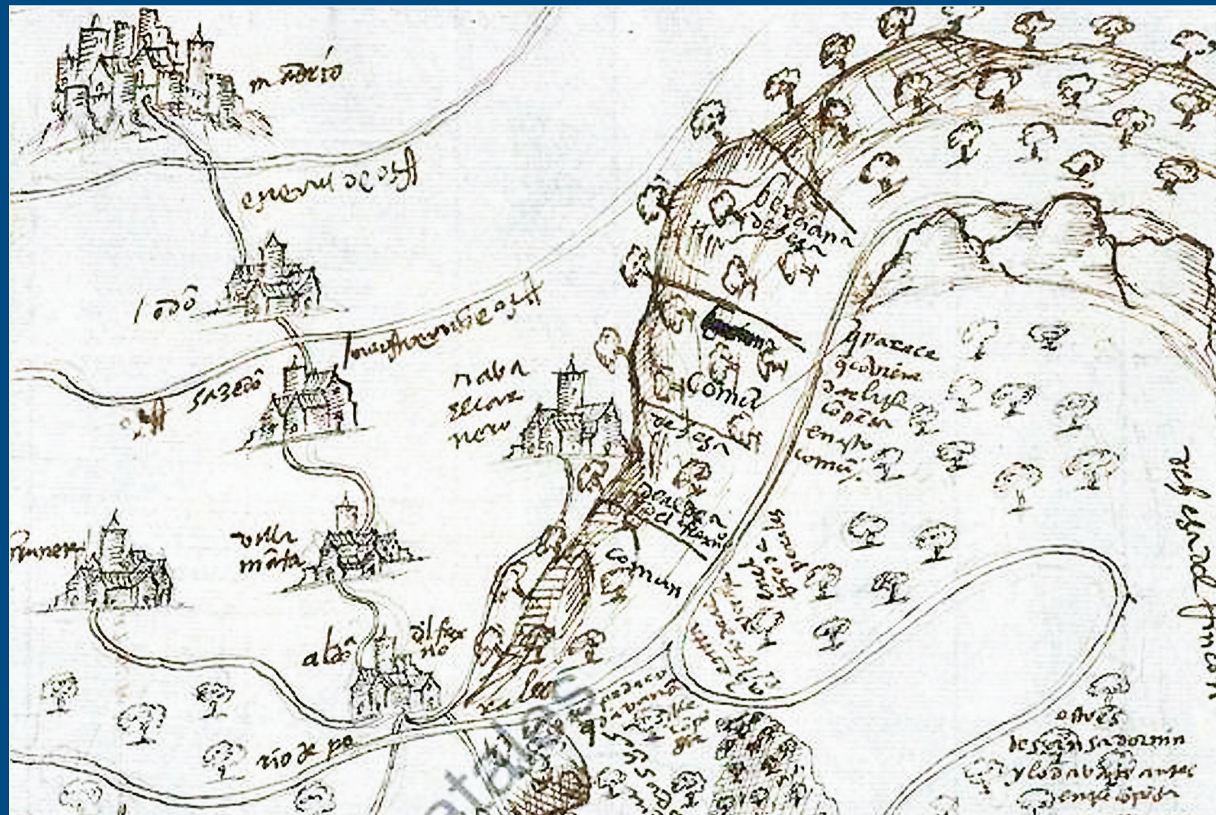
Navalcarnero en un mapa del s XVI.