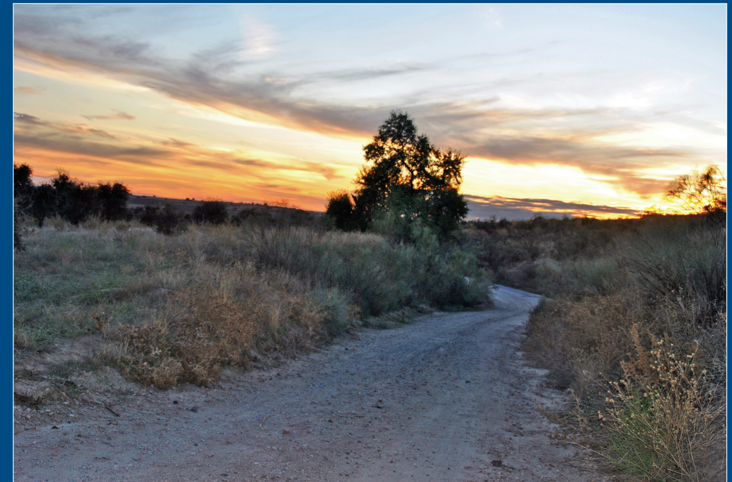
Aspecto actual del camino.

En época medieval transitaba por esta zona un carril llamado del Tirabuey. Era el camino más importante de dirección norte-sur que iba por la orilla derecha del río Guadarrama, aprovechado las cuerdas altas entre este río y el Perales, afluente del Alberche. Lo llamamos Carril de Tirabuey por ser este el nombre que daban en el s. XVI los propios segovianos al camino que utilizaban para ir a la Transierra y a Toledo: