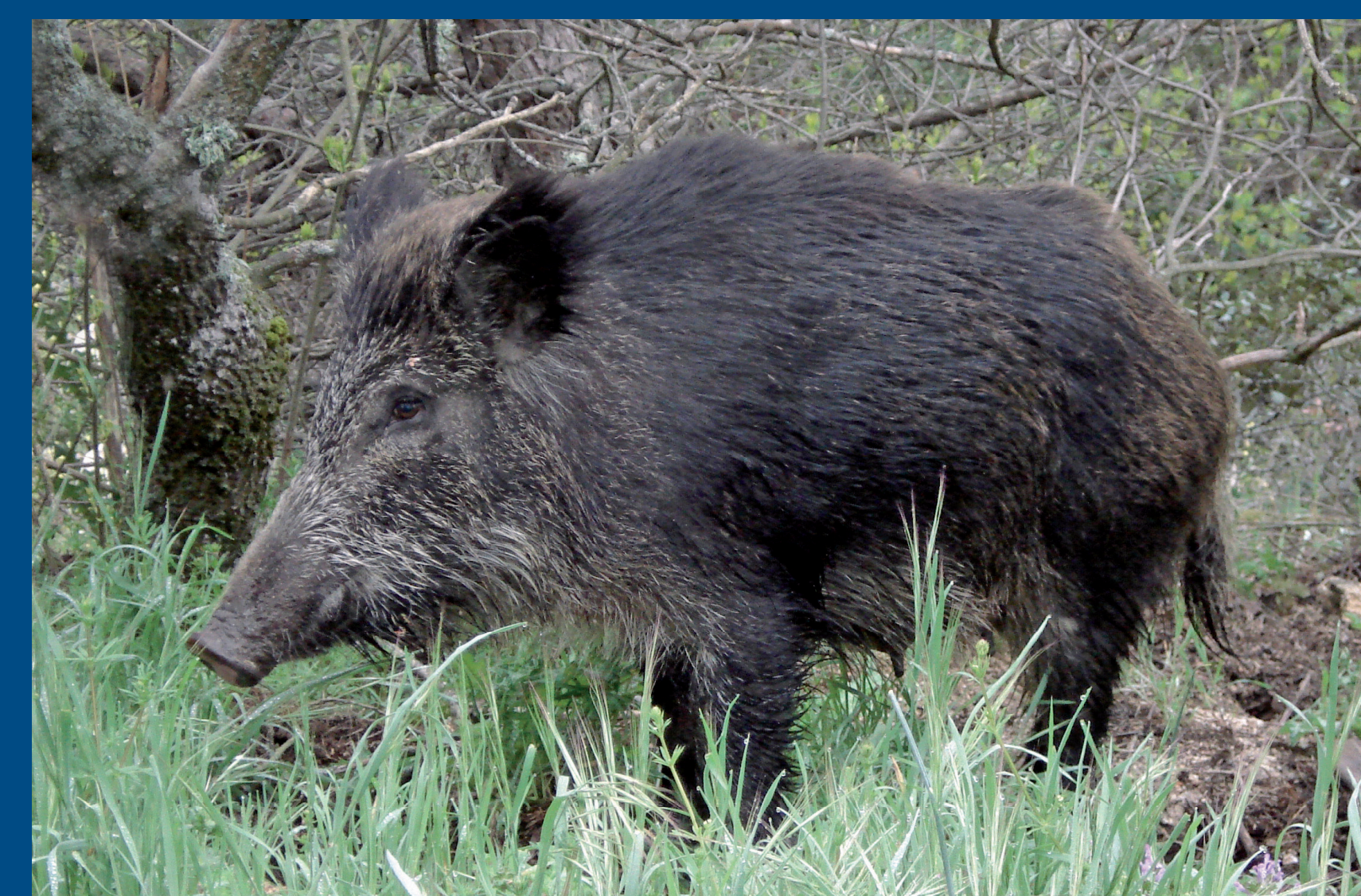
Jabalí ( Sus scrofa )

arbustivo y dejando los pies de encina lo suficientemente separados para poder sembrar hojas de cereal, manteniendo el aprovechamiento de la bellota para alimentar al ganado, muchas veces de cerda. Estos encinares adehesados son característicos de grandes zonas de León, Extremadura, Andalucía o La Mancha.