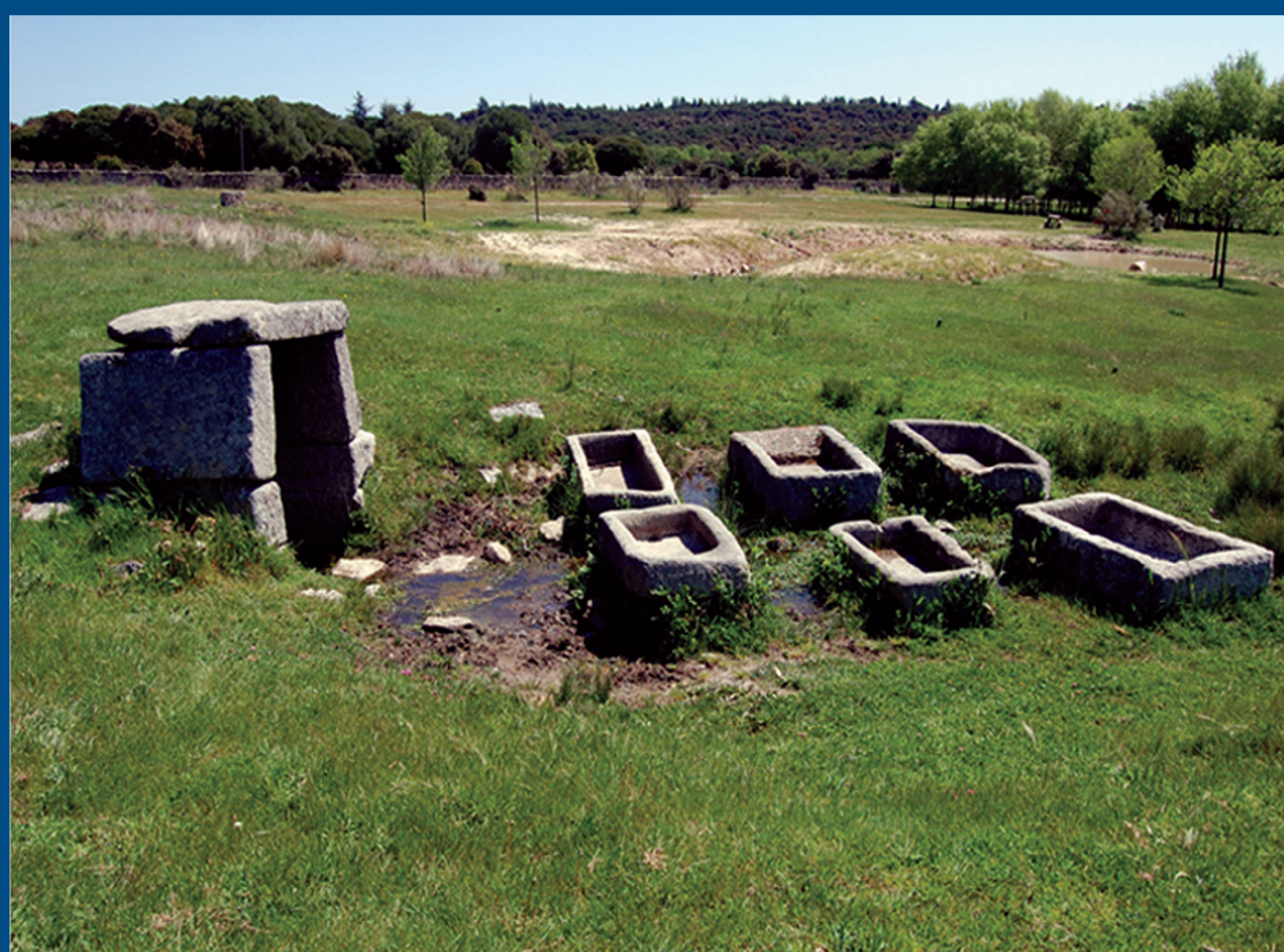
Fuente y lavadero de El Navazo