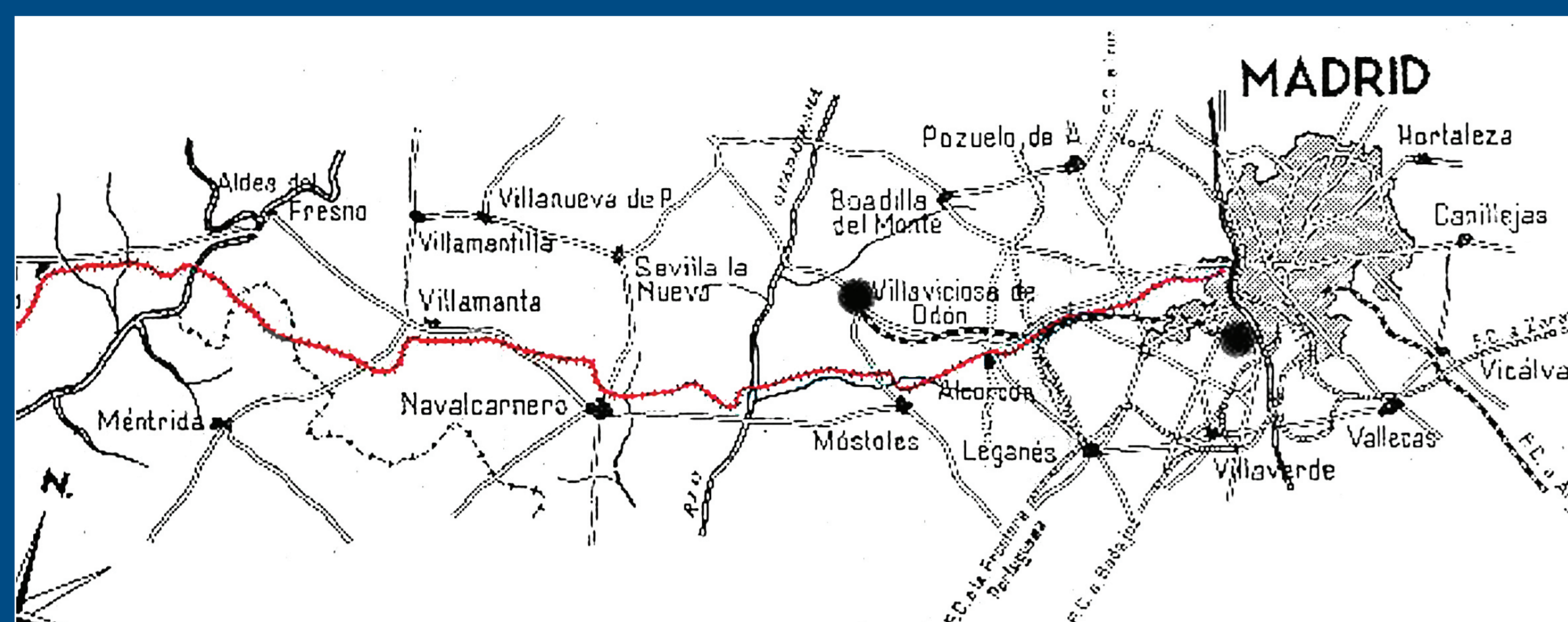
Mapa de la línea Madrid-Villa del Prado-Almorox