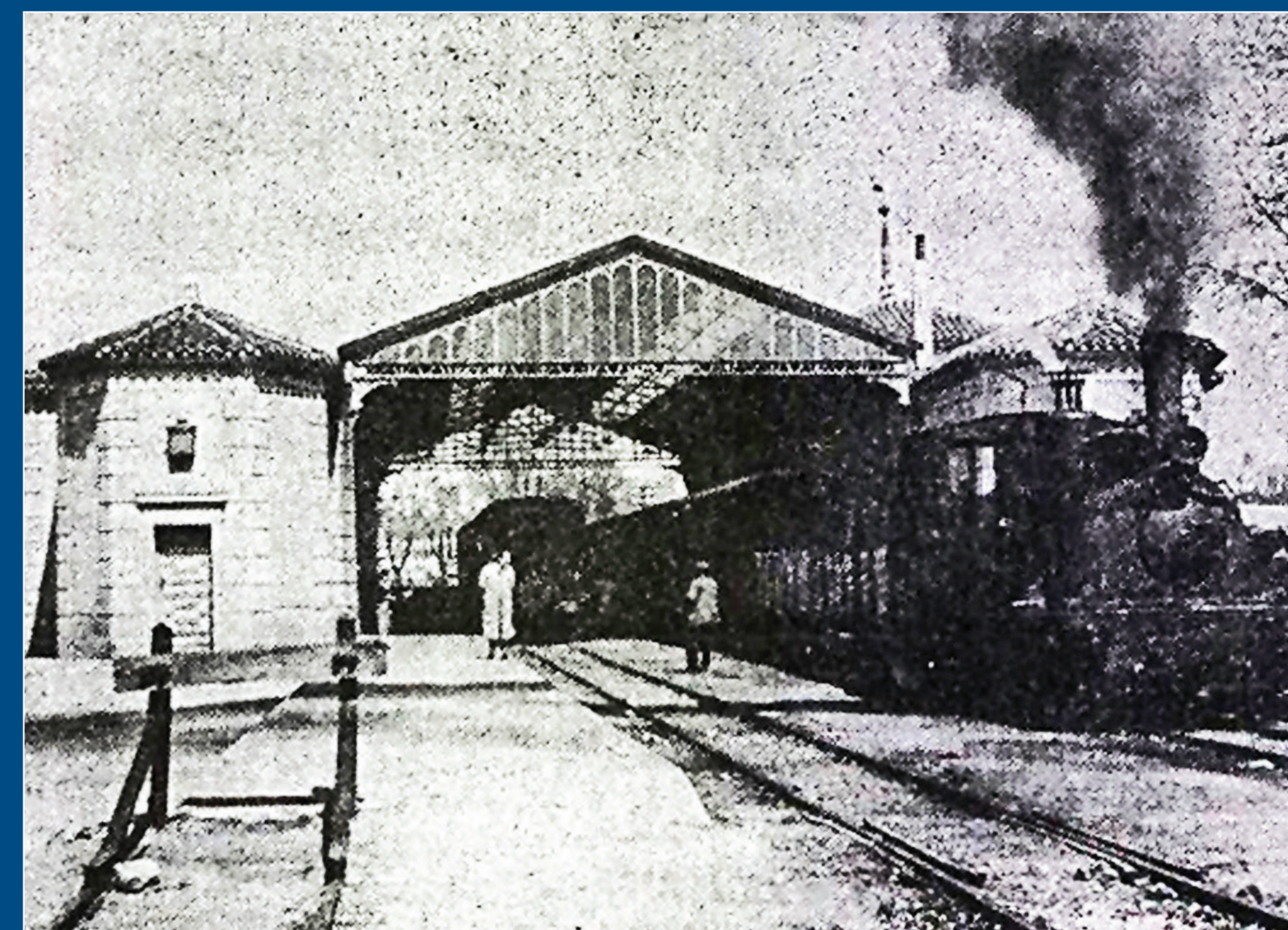
Un tren de vapor saliendo de la estación principal de Goya en Madrid

En 1882 se presentó al Ministerio de Fomento un proyecto de ferrocarril de vía estrecha de Madrid a Villa del Prado, que no fue inaugurado hasta 1891. Constaba de dos tramos, uno de Madrid a Navalcarnero, inaugurado el 15 de julio de 1891 con 32 kilómetros de recorrido, y otro de Navalcarnero a Villa del Prado, que fue abierto el 23 de diciembre del mismo año, con una longitud de 20 kilómetros, sumando en total 62 kilómetros.