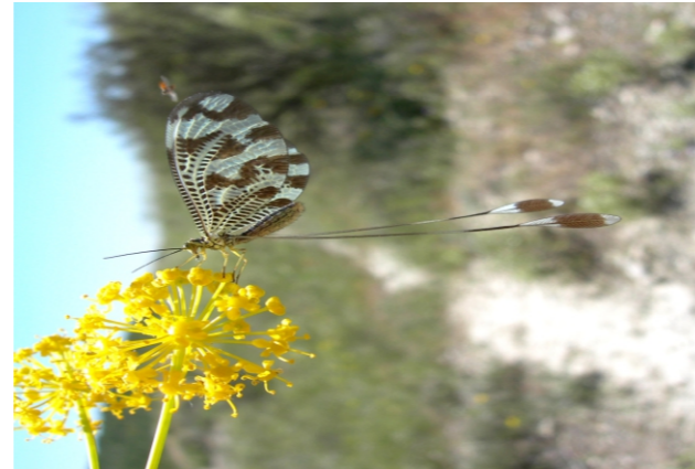
Nemoptera bipennis (Illiger, 1812)