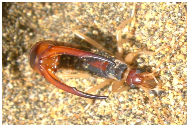
Labidura riparia (Pallas, 1773)