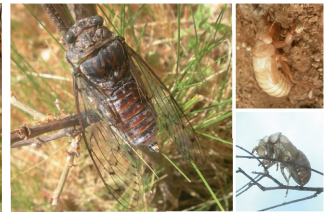
Cicada orni (Linnaeus, 1758)