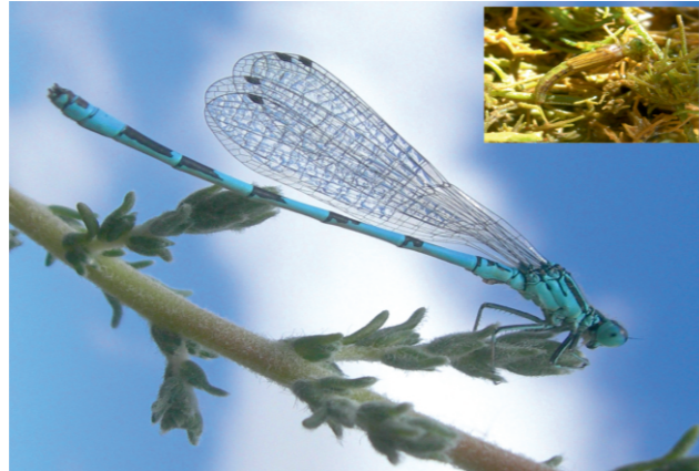
Coenagrion mercuriale (Charpentier, 1840)