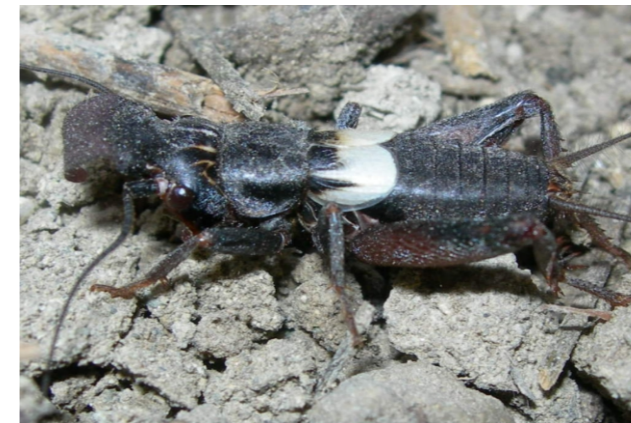
Sciobia lusitanica (Rambur, 1838)