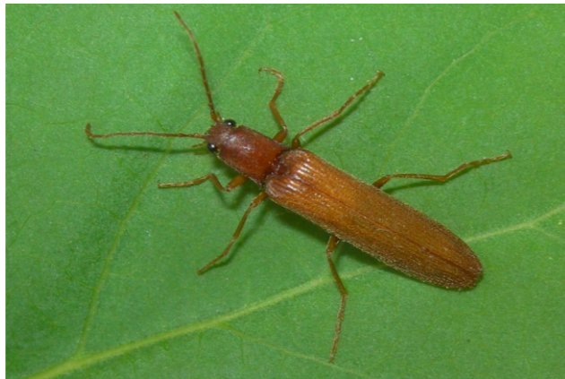
Athous (Neonomopelus) sofiae (Platia, 2010)