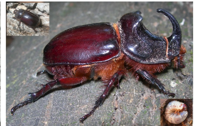
Oryctes nasicornis L. subsp. grypus (Illiger, 1802)