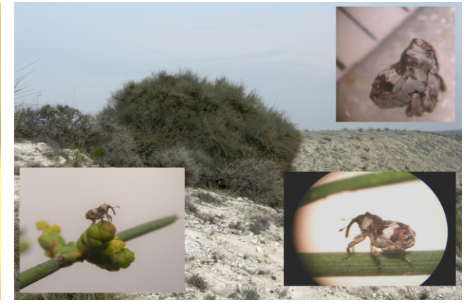
Atlantonyx lopezcoloni (Korotyaev & Alonso-Zarazaga, 2010)