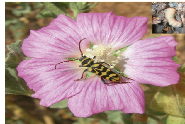
Neoplagonotus marcae (López-Colón, 1997)