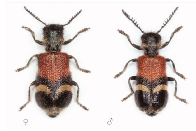
Tillus ibericus (Lbahillo de la Puebla, López-Colón & García-Paris, 2003)