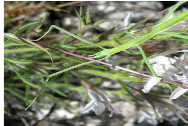
Pijnackeria hispanica (Bolivar, 1878)