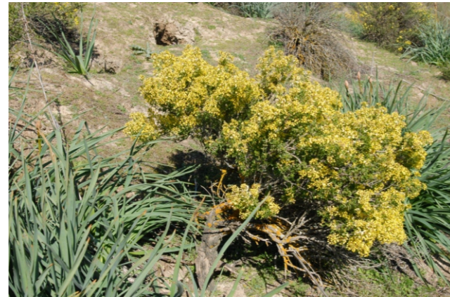
Vella pseudocitrusus L.