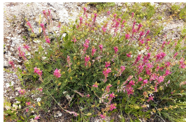
Hedysarum boveanum Bunge ex Basiner