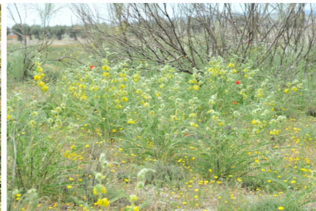
Astragalus alopecuroides L.