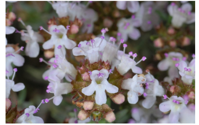
Thymus zygis L.