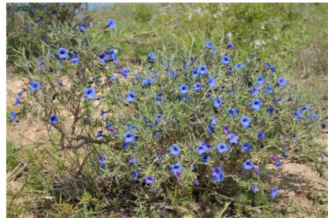
Lithodora fruticosa (L.) Griseb