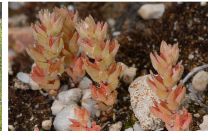
Sedum aetnense Tineo subsp. aranjuezii