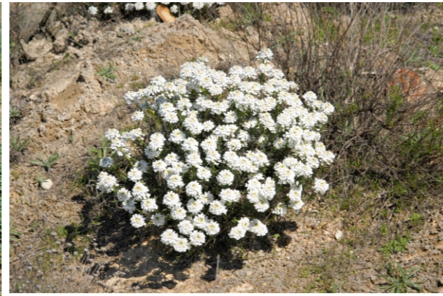
Iberis saxatilis L.