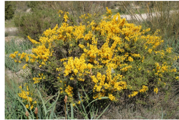
Genista scorpius (L.) DC.