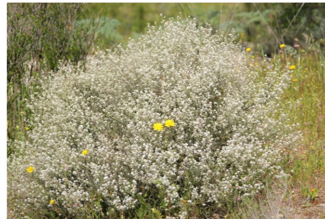
Lepidium subulatum L.