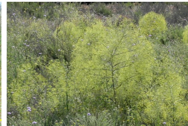
Ferula loscosii (Lange) Willkomm