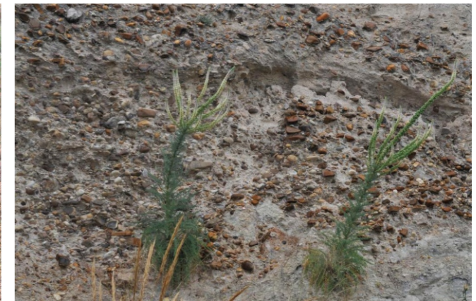
Reseda suffruticosa Loeffl. ex Koelp.