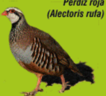
Perdiz roja ( Alectoris rufa )