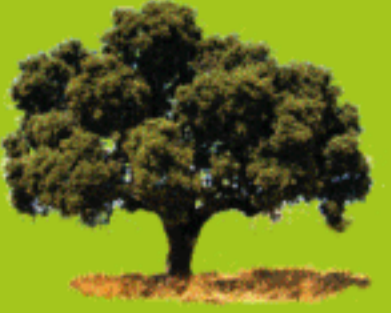
Encina ( Quercus ilex )