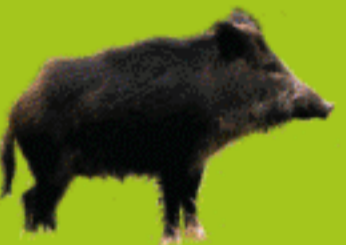
Jabali ( Sus scrofa )