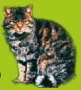
Gato montés ( Felis silvestris )