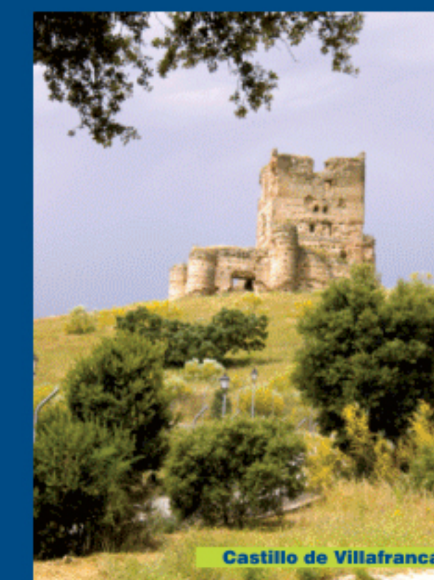
Castillo de Villafranca

Tras cruzar la barrera el camino continúa en dirección oeste, dejando ahora a su derecha el campo de golf «La Dehesa». Avanzaremos 1,7 km desde la barrera hasta salir al casco urbano de Villanueva de la Cañada junto al cementerio. Seguimos por la Avenida de la Universidad, que pasa a convertirse en la calle del Cristo, y al final de esta, por la corta calle Comadre, entramos en la Plaza de España, final de nuestra ruta.