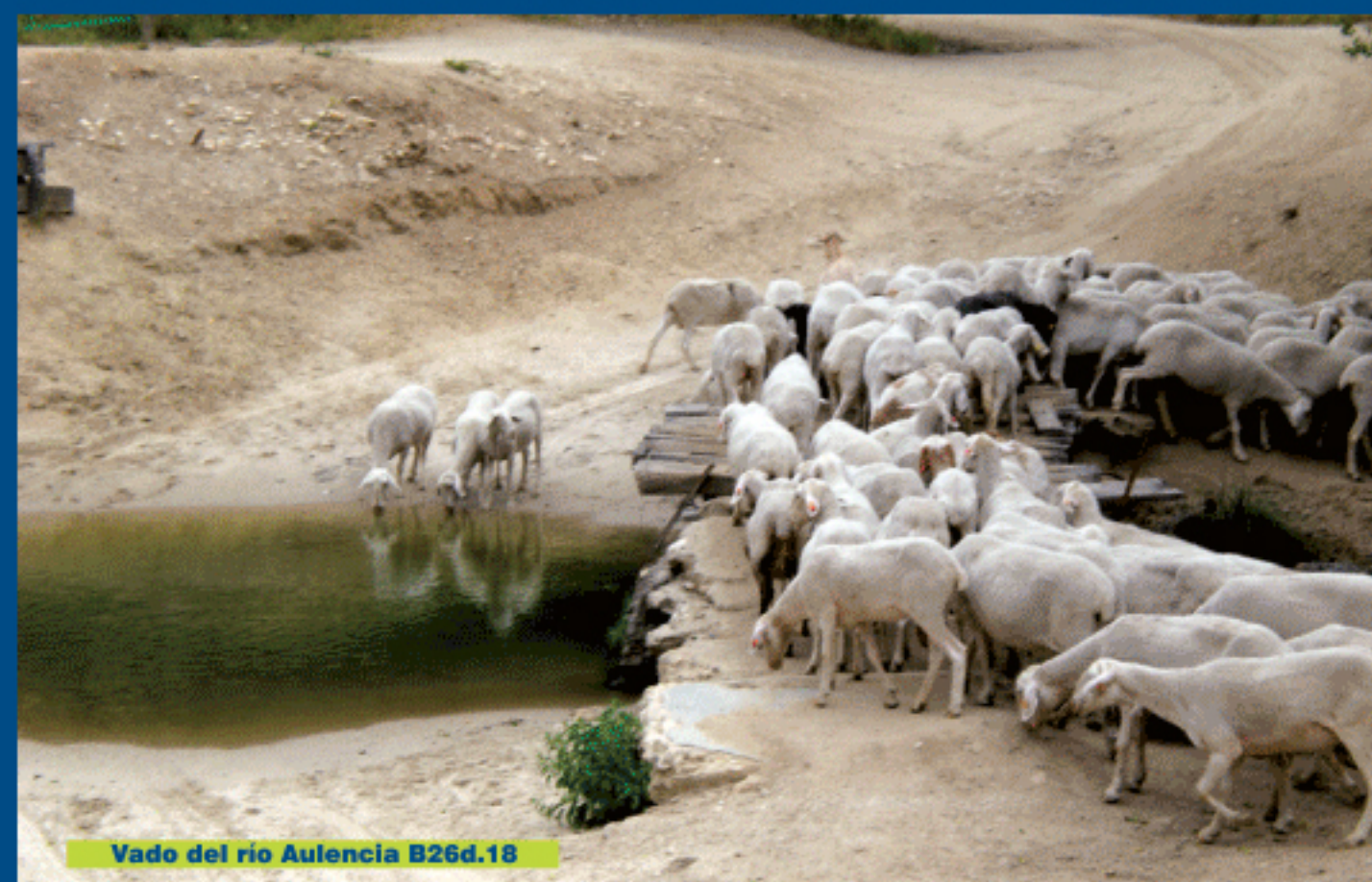
Vado del río Aulencia B26d.18

Junto a la ermita, tenemos dos barreras para vehículos, una a la derecha y otra a la izquierda. Giramos a la derecha, entrando en un área recreativa. A los pocos metros llegamos al arroyo de los Palacios, que cruzamos gracias a un puente. Ya en la otra orilla el camino se aleja del arroyo en dirección suroeste, pasando al pie de unas cárcavas arenosas. Este camino desemboca en otro mucho más ancho, que continúa hacia el sur.