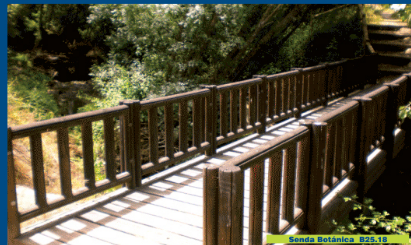
Senda Botánica B25.1B

Una vez en el margen opuesto de la carretera, continuamos de frente, en dirección sur-suroeste, por un camino estrecho y en no muy buen estado, por el que en 750 m salimos a otro camino mucho mejor. Desembocamos en una curva muy cerrada, pudiendo seguir a derecha o izquierda.