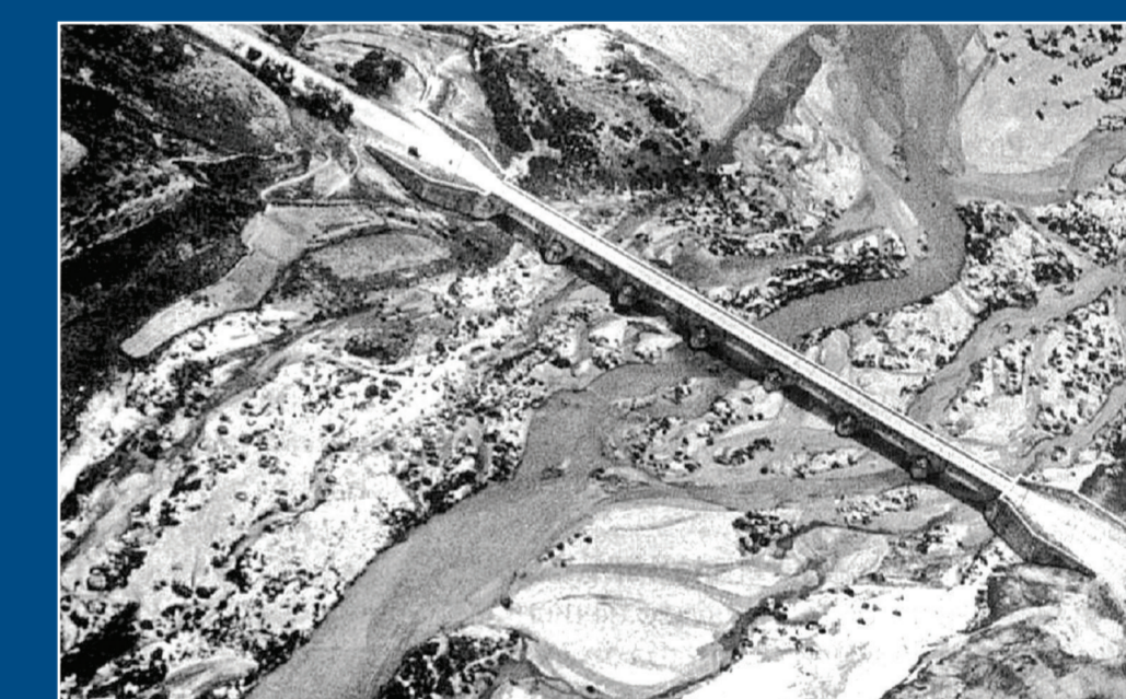
El Puente, en foto aérea de 1932 (a la derecha Móstoles).