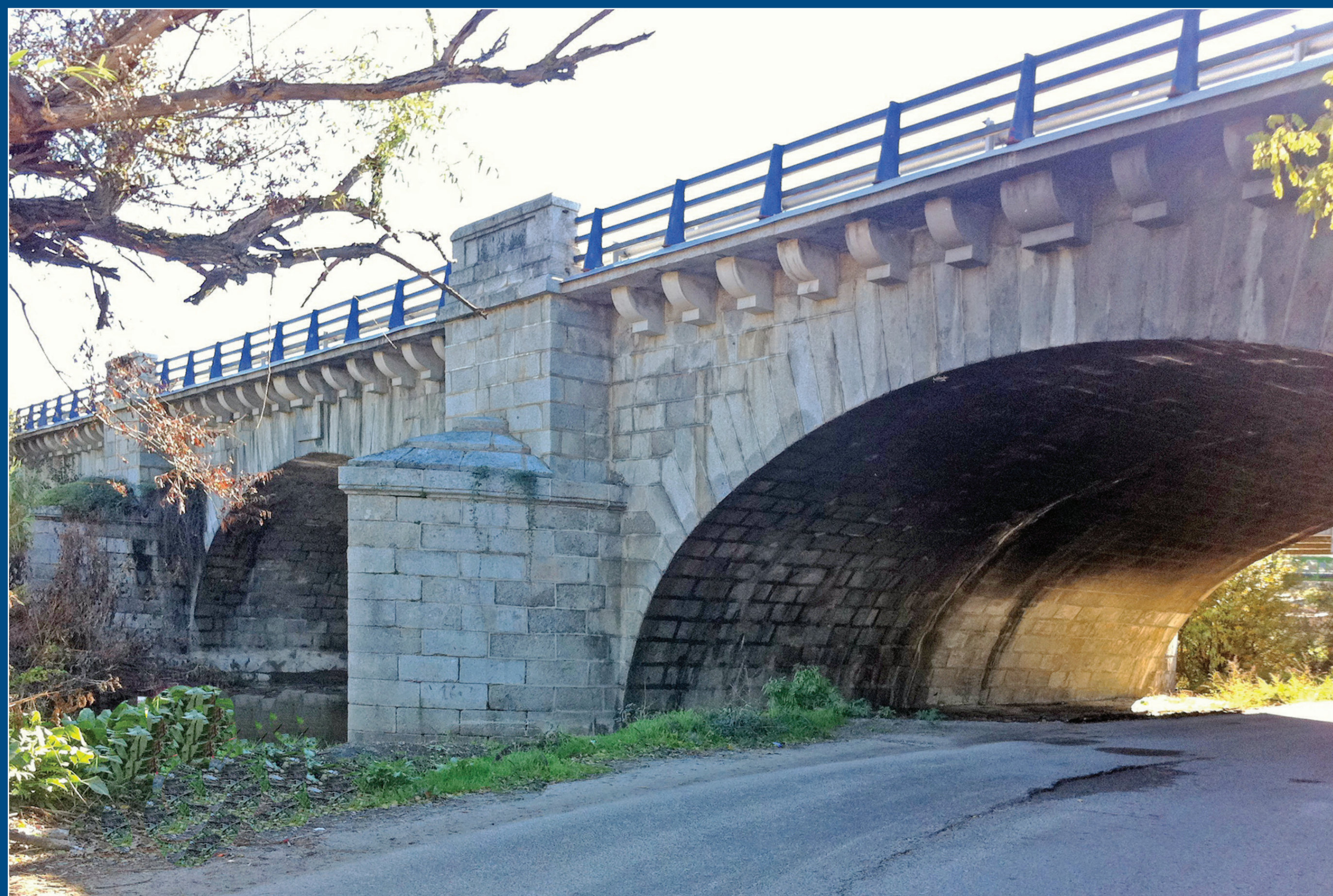
El Puente, desde el norte.

A mediados del siglo XVII hubo un proyecto para reconstruir el puente de la Zarzuela, dotando al camino de un paso seguro sobre el Guadarrama, pero con él se vieron enfrentados las villas de Navalcarnero y Casarrubios, cada una de las cuales aducía sus razones para que el nuevo puente se construyese en el paso que más le convenía, intentando atraer con ello el camino de Portugal hacia su casco urbano, con todas las ventajas que ello conllevaba para el desarrollo económico de la localidad.