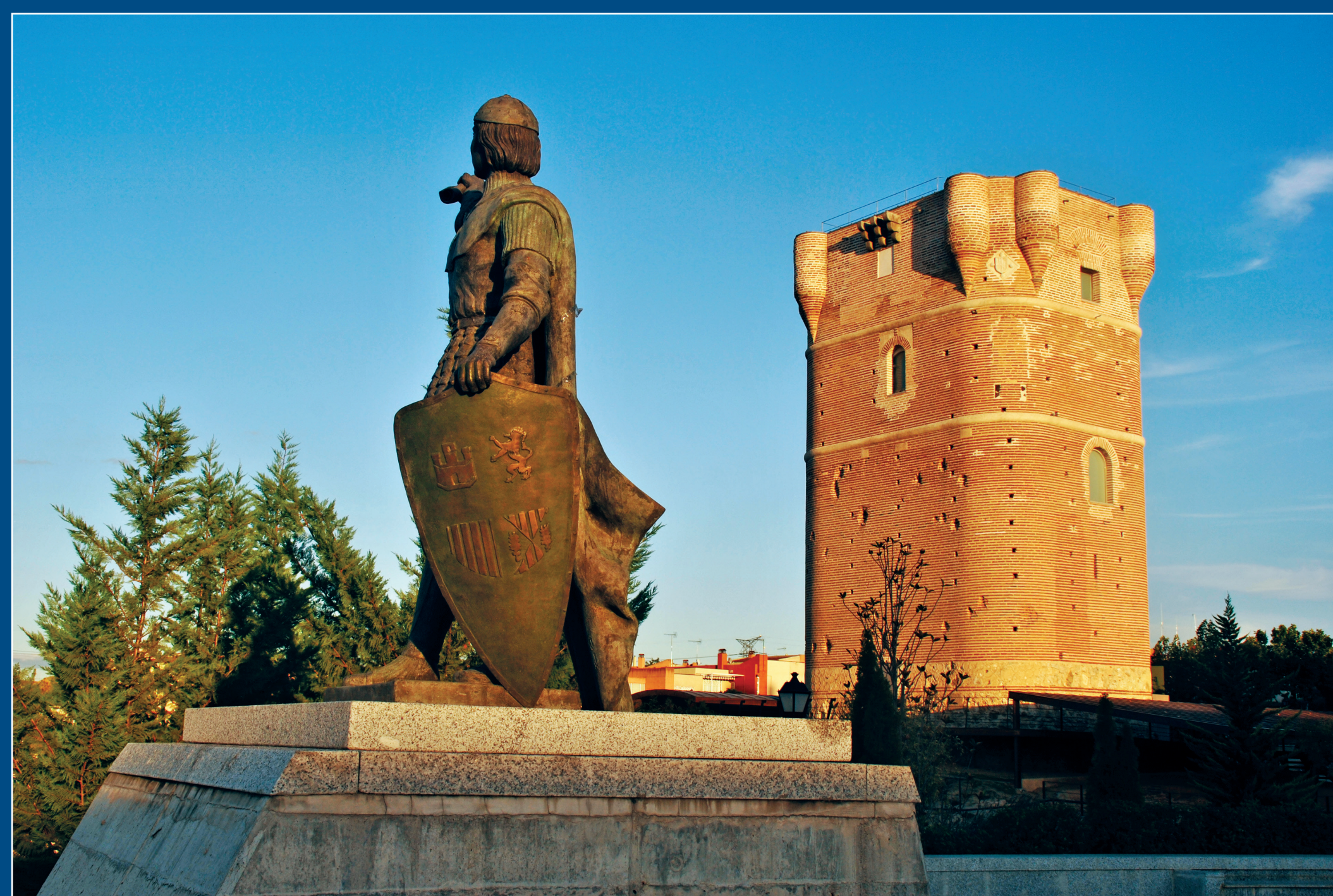
El torreón y monumento a Gonzalo Chacón.

La referencia escrita más antigua que conocemos sobre Arroyomolinos o Chozas de Arroyo de Molinos, como entonces se la conocía, es de 1361 y ya en 1375, aparece ligada al señorío de Casarrubios.