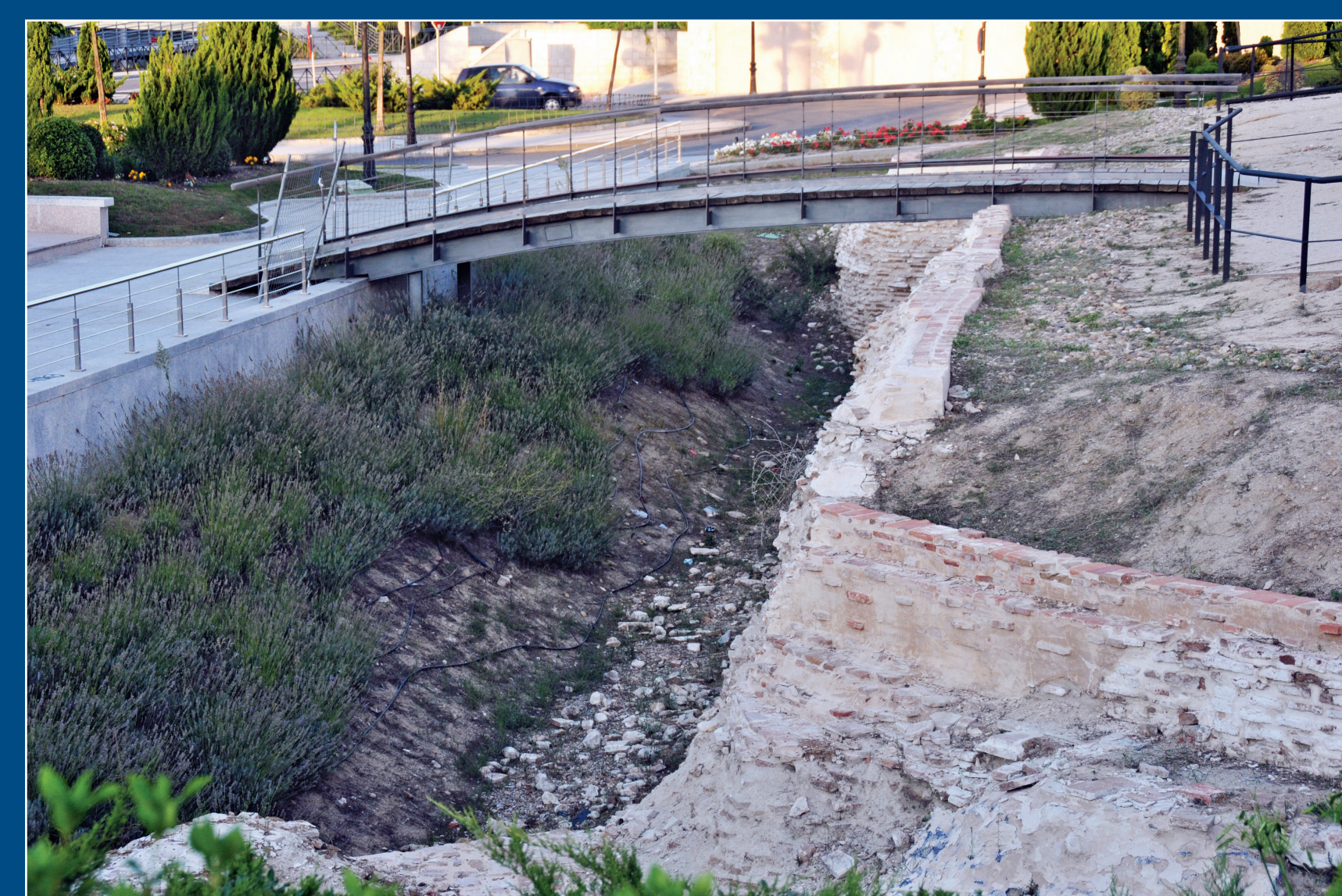
Antemuro y foso.

Todavía se conservan al exterior tres de los blasones o escudos de piedra originales, que corresponden a los Reyes Católicos y a los señores de Casarrubios, Gonzalo Chacón y Clara Alvarnárez, su esposa, que, si no fueron sus primeros constructores, sí que la hicieron terminar, hacia 1480.