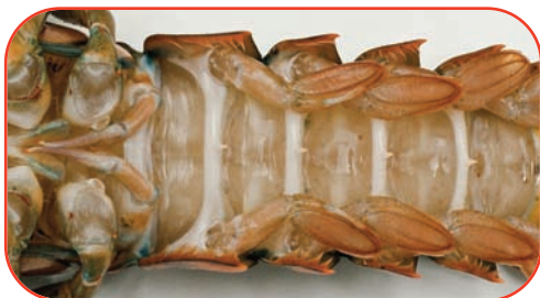
Parte ventral de la hembra