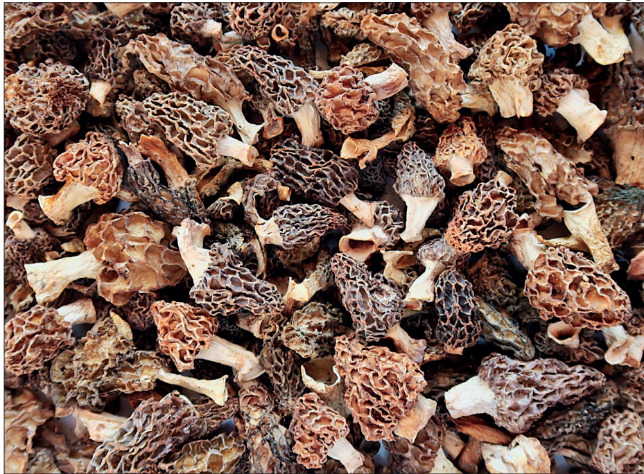
© José Gerardo López Colmenilla, cagarria, morilla