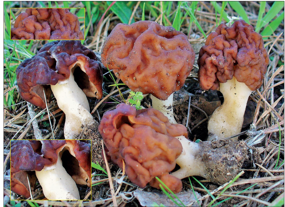
© Miguel Ángel Ribes Bonete, mitra, tripota, cerebro, cagarria