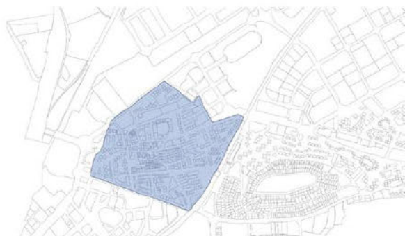
Ámbito 1: Bloque en H en la zona casco