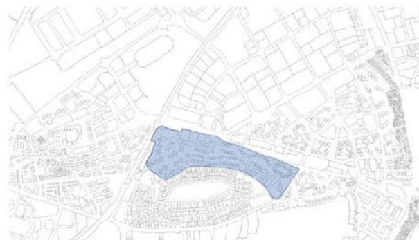
Ámbito 2: Bloque en Zona Parque Blanco