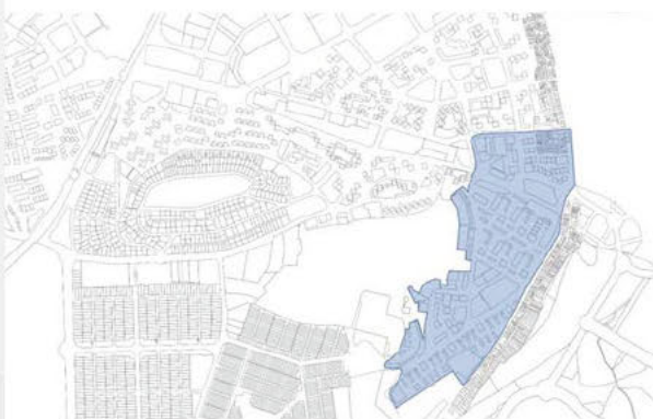
Ámbito 3: Bloque lineal en la zona ciudad 70