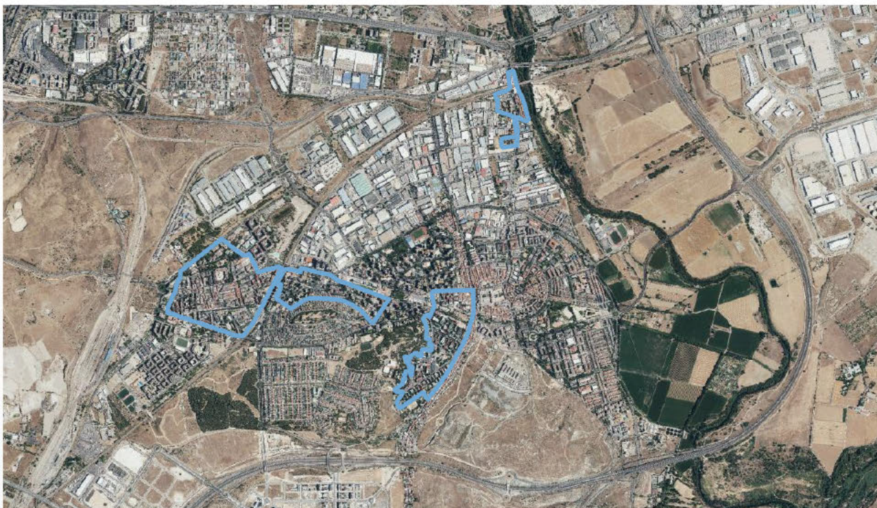
Localización del ERRP en el municipio de Coslada.