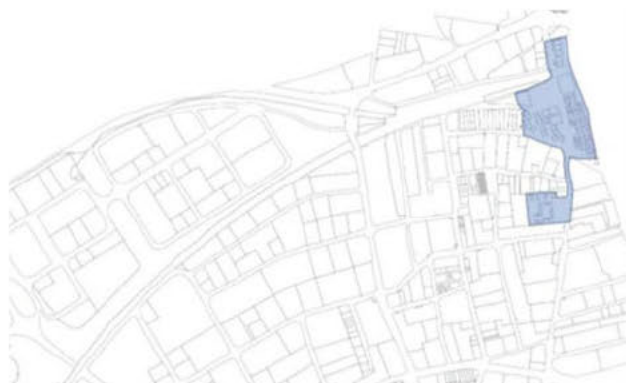
Ámbito 4: Bloque lineal en barrio de la Estación

FIRMADO por : Sello de tiempo TS@ - @firma. A fecha: 12/06/2024 09:47 AM FIRMADO por : MARIA JOSE PICCIO-MARCHETTI PRADO. DIRECTORA GENERAL DE VIVIENDA Y REHABILITACIÓN. A fecha: 11/06/2024 01:35 PM FIRMADO por : ANGEL VIVEROS GUTIÉRREZ. ALCALDE. A fecha: 11/06/2024 09:13 AM FIRMADO por : FRANCISCO JAVIER MARTIN RAMIRO. A fecha: 13/06/2024 01:34 PM Total folios: 11 (11 de 11) - Código Seguro de Verificación: [redacted] Verificable en https://sede.mitma.gob.es