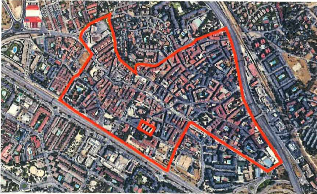
Localización del ERRP “Colonia Las Vírgenes” en el municipio de Las Rozas de Madrid.