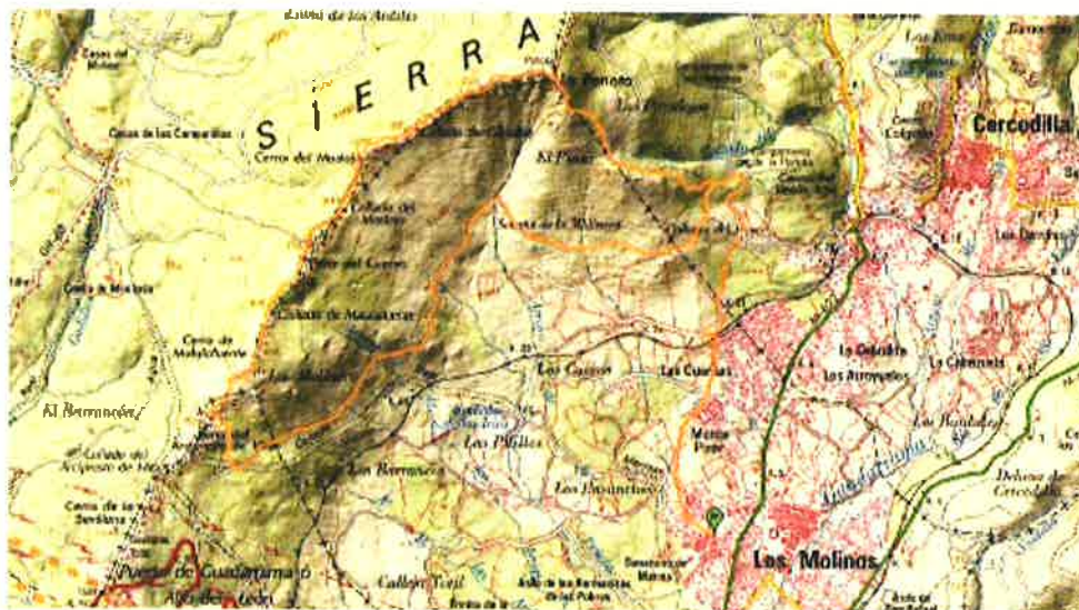
Localización del municipio de Los Molinos.