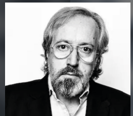
JUAN CARLOS GIRAUTA