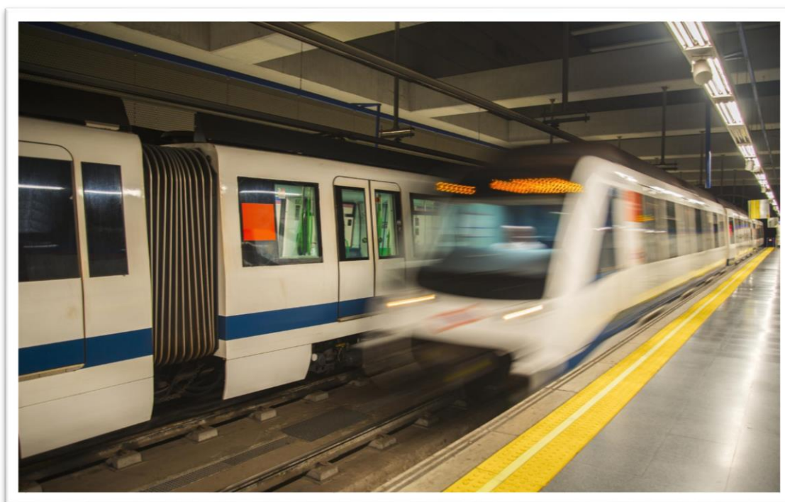
Metro de Madrid.

El coste total de la operación ha sido de 7.951.498,06 € siendo el coste subvencionable de 6.571.486,00 €.