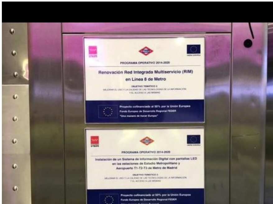
Estación de Aeropuerto T1-T2-T3, donde se aprecia el cartel de otra actuación financiada con Fondos FEDER del mismo Programa Operativo 2014-2020