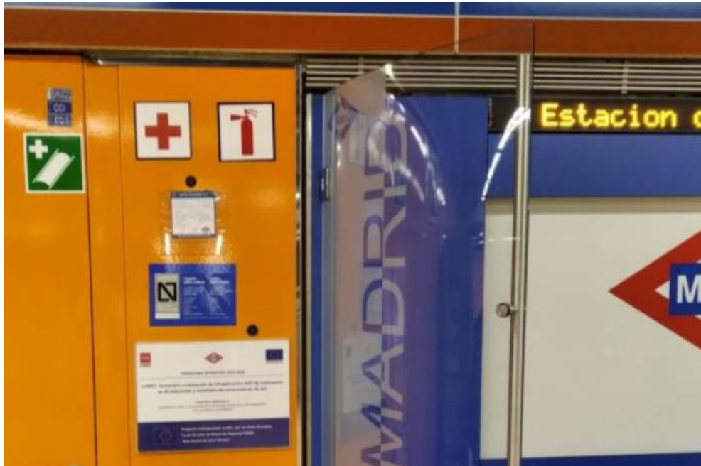
Estación de Hortaleza