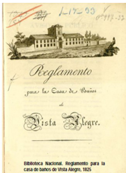
Palacio Viejo. Reglamento para la casa de Baños de Vista Alegre 1825. Biblioteca Nacional de España (signatura VC/997/33)

El edificio contaba con salas para el baño, casino, salones, y un jardín posterior donde disfrutar de la música y de los espectáculos al aire libre. Al Palacio Viejo se le anexionó La Estufa Grande, formando ambos una pantalla que protegía la intimidad del jardín de las miradas de los transeúntes.