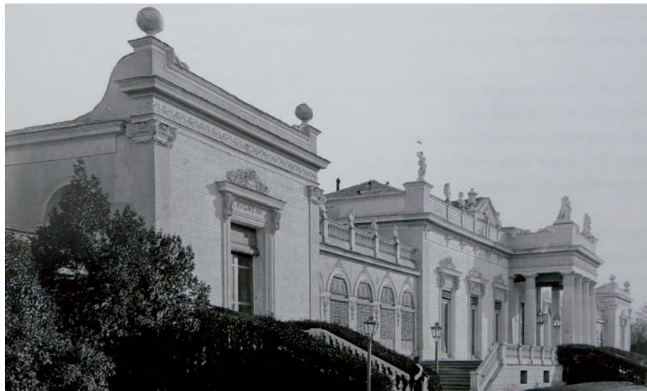
Palacio Nuevo. 1860-1886