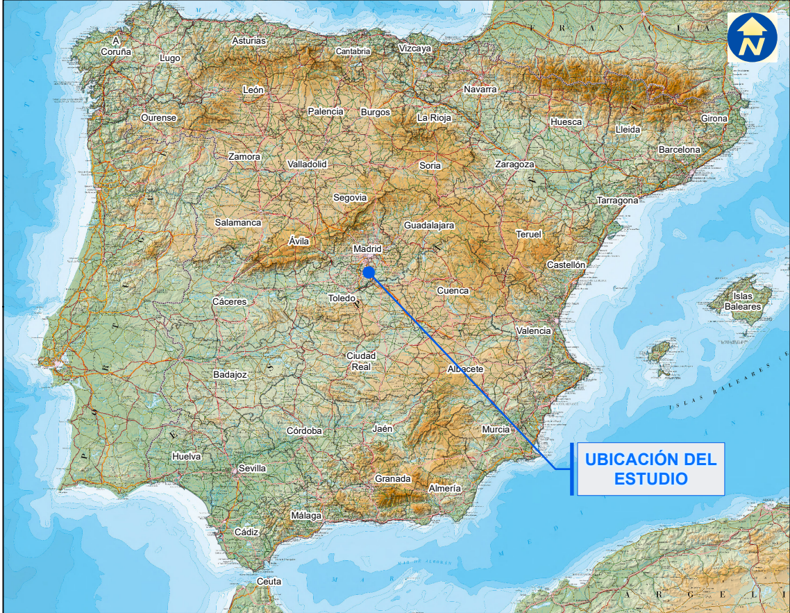
MAPA DE SITUACIÓN NACIONAL