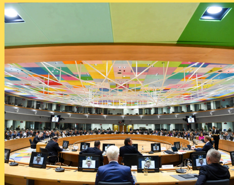
Sala de reuniones del Edificio Europa (Bruselas), sede del Consejo de la UE y del Consejo Europeo