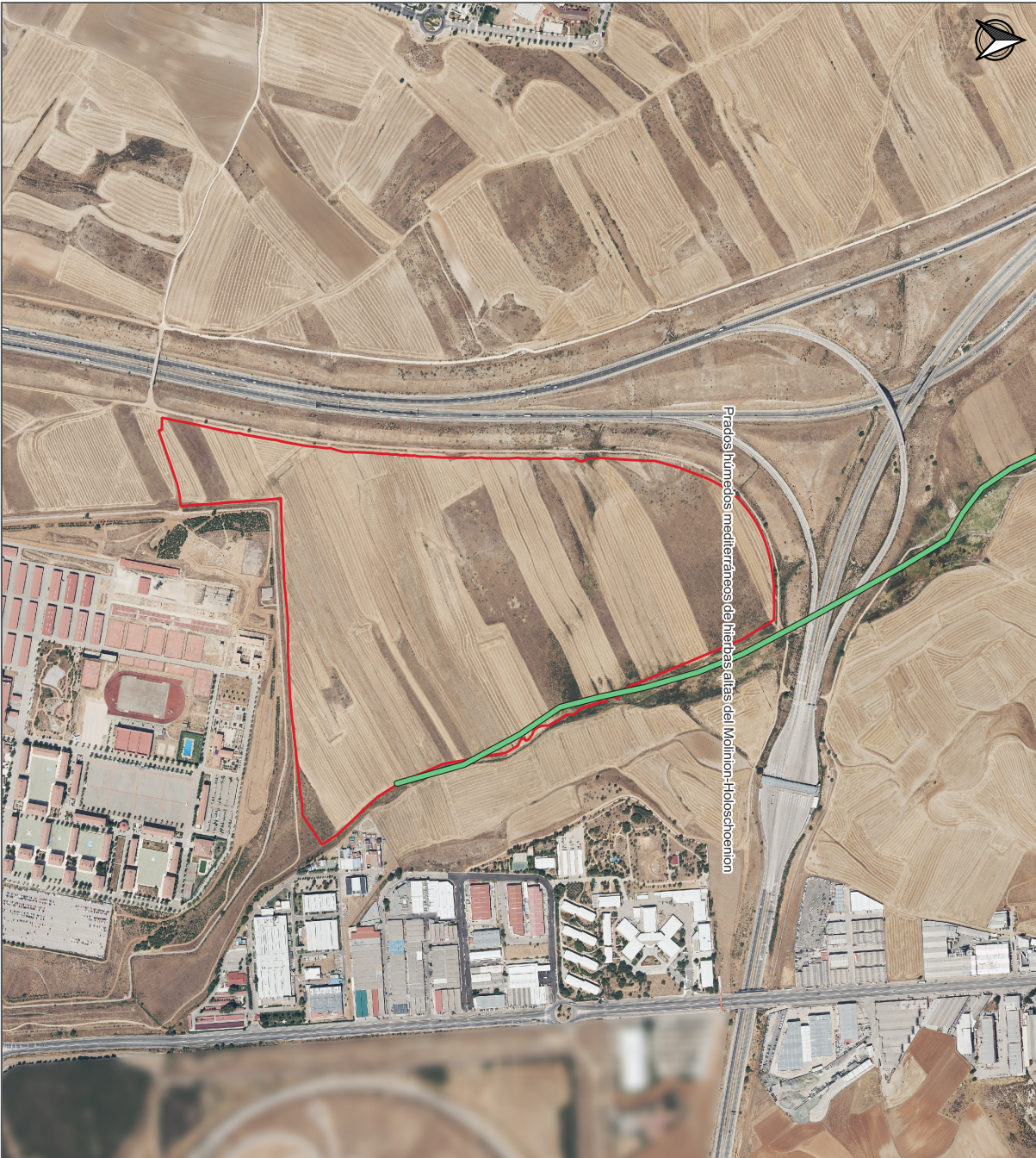
Prados húmedos mediterráneos de hierbas altas del Molino-Holtschoenion

Esta es una copia impresa del documento electrónico (Ref: 1716273 DLYG3-T9W0R-N5YVN 248AE22AE17969F713D7EBF076D08B291AE297), generada con la aplicación informática Firmador. El documento no requiere firmas. Mediante el código de verificación puede obtener la validez de la firma electrónica de los documentos firmados en la dirección web: https://sede.paracuellosdejarra.es/portal/verificarDocumentos.do?Firmado por: 1. C-EFS, O=COMISION GESTORA SECTOR 15 LA PERLA DE PARACUELLOS DEL JARAMA, CID:2.5.4.97-VATES:V86630572, CN=JOSE LUIS FERNANDEZ DEL VISO, G=JOSE LUIS, SERIALNUMBER=IDCES-50075066H, Description=Ref:AEAT/AEAT0030/PUESTO 1/57193/03102023115914 (CN=AC Representación, OU=CERES, O=FNMT-RCM, C=ES) el 17/11/2023 15:20:58