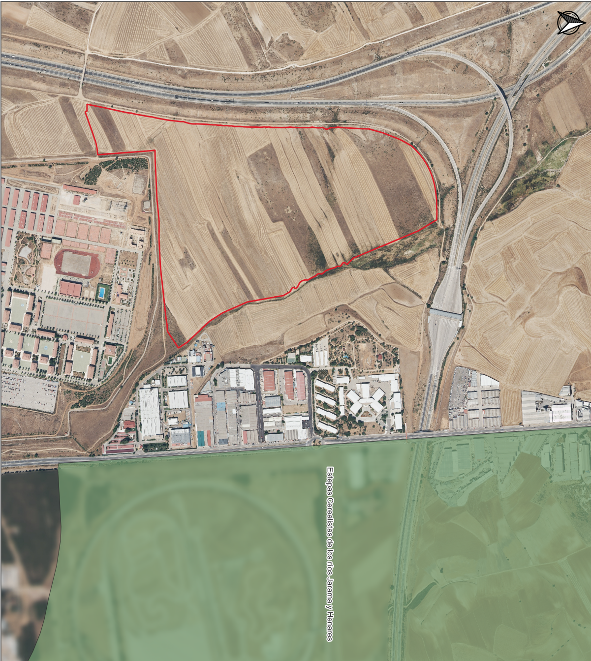
Estepas Cerealistas de los ríos Jarama y Henares

Esta es una copia impresa del documento electrónico (Ref: 1716281, 9SRFZ-EVCRV-G2LP5, 71C64BF64BDCBACE3FF3E0AE5264F052B10024) generada con la aplicación informática Firmadoc. El documento no requiere firmas. Mediante el código de verificación puede obtener la validez de la firma electrónica de los documentos firmados en la dirección web: https://sede.paracuellosdejarama.es/sede/verificarDocumento.do Firmado por: 1, C-ES, O-COMISION GESTORA SECTOR 15, LA PERLA DE PARACUELLOS DE JARAMA, CID:2.5.4.97-VATES:V86630572, CN=JOSE LUIS FERNANDEZ (R: V86630572), SN=FERNANDEZ DEL VISO, G=JOSE LUIS, SERIALNUMBER=IDCES-50075066H, Description=Ref:AEAT/AEAT0030/PUESTO 1/57183/03102023115914 (CN=AC Representación, OU=CERES, O=FNMT-RCM, C=ES) el 17/11/2023 15:25:17.