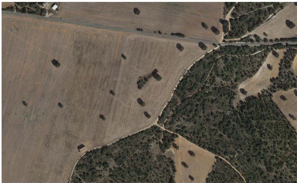
Ortofotografía de la ubicación de ST Armada.