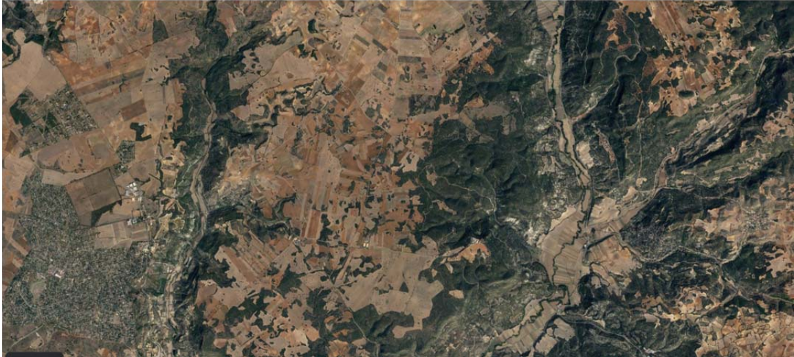
Ortofotografía de la ubicación de LAAT ST Armada – ST Piñón.