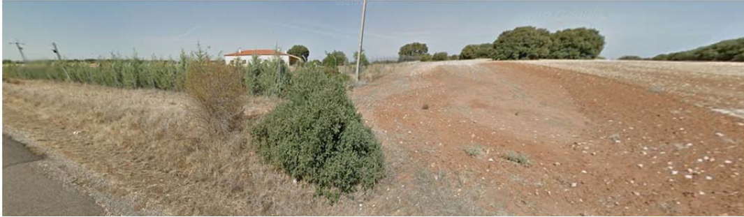
Vista 2 de las parcelas de implantación de la PSFV Armada Solar.