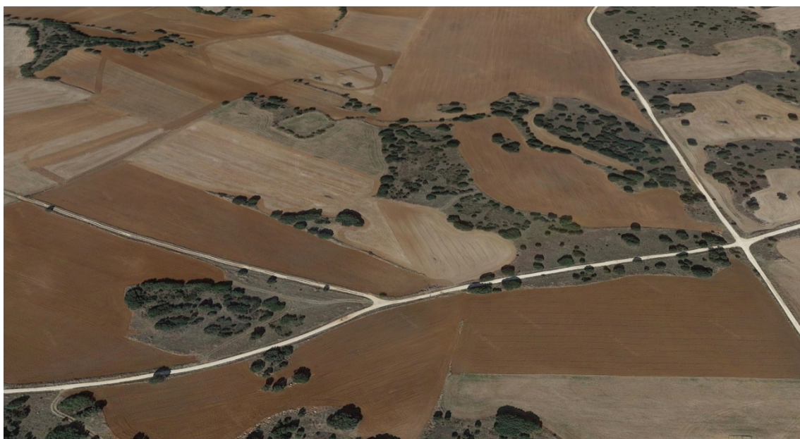
Zona de implantación del apoyo 10 de la LAAT Armada-Piñón