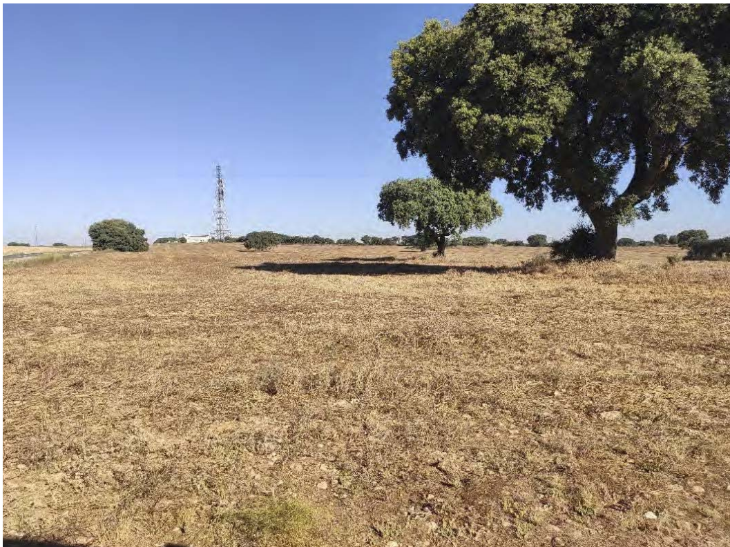
Zona de implantación del apoyo 02 de la LAAT Armada-Piñón