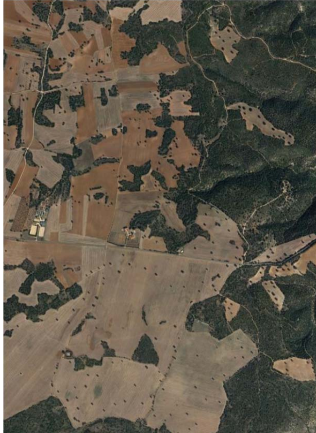
Ortofotografía de la ubicación de PSFV Armada Solar.