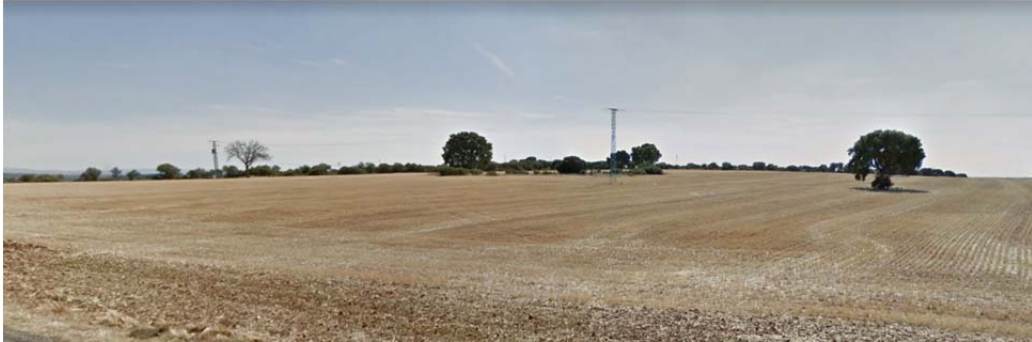
Vista de las parcelas de implantación de la ST Armada.