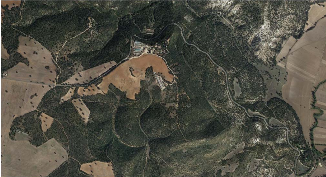
Ortofotografía de la ubicación de LAAT ST Ojeadores – ST Armada.