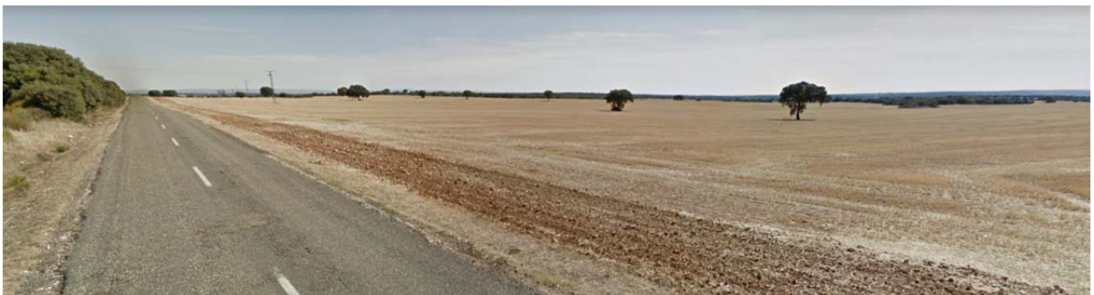
Vista 1 de las parcelas de implantación de la PSFV Armada Solar.