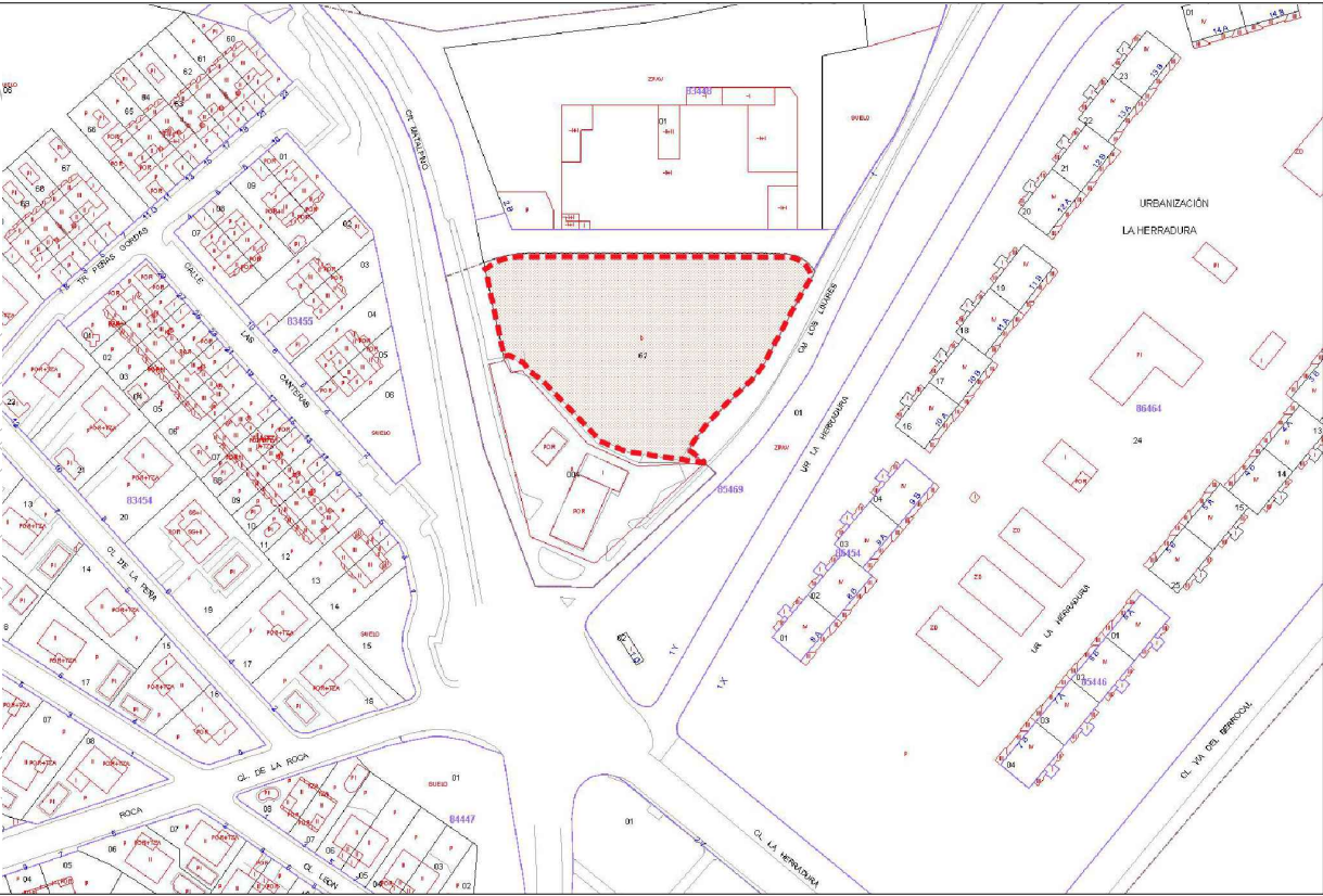
DELIMITACIÓN DEL SECTOR AR4 S2 LAS CANTERAS II EN PONENCIA CATASTRAL