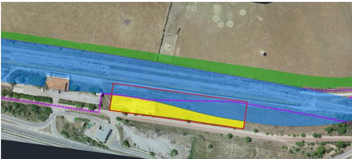
En amarillo se muestra la zona de ocupación temporal.

Que con motivo de la obra de construcción de la ampliación de la red de cercanías de Madrid hasta Soto del Real. Fase 1. infraestructura, vía y línea aérea de contacto, viene contemplado en el proyecto aprobado la ocupación temporal de la vía pecuaria Cordel de la carretera de Miraflores del cual adjuntamos ubicación de la afección. Además, se incluye la ubicación de posición proporcionada por Adif para colocar el cartel de obras de permanencia temporal el cual será retirado a la finalización de las mismas.