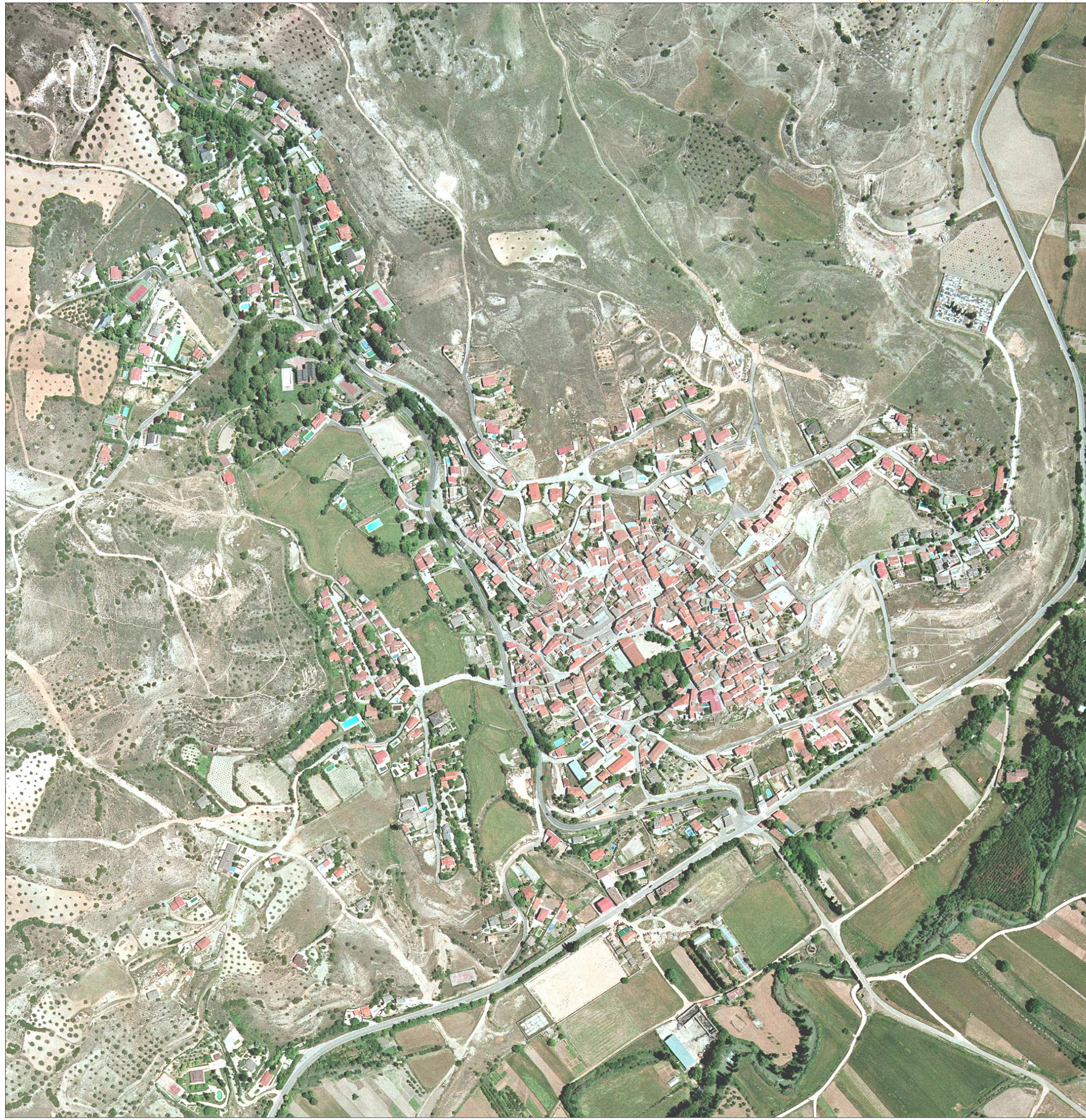
NÚCLEO URBANO DE ORUSCO