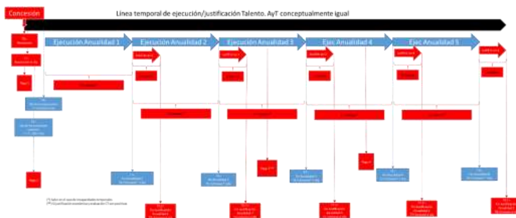
ILUSTRACIÓN 1: ESQUEMA RESUMEN DE ANUALIDADES, JUSTIFICACIONES Y PAGOS

Esta información puede verse esquematizada en la Ilustración 1: